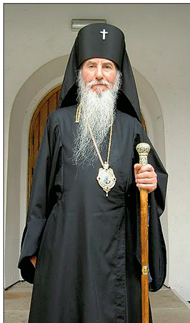
По благословию Архиепископа Берлинского, Германского и Великобританского Марка