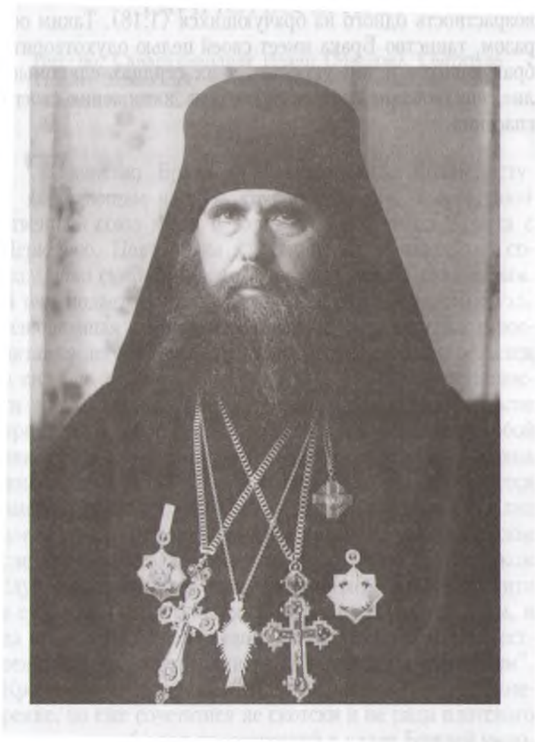
Схиархимандрит Иоанн (Маслов)