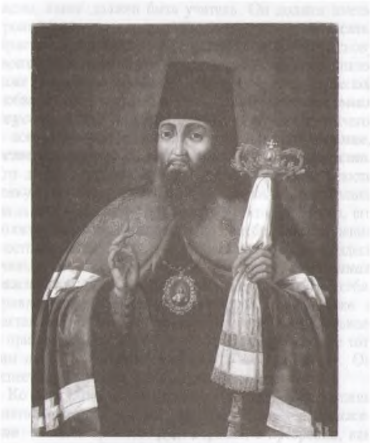
Святитель Тихон Задонский