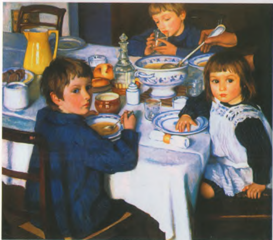
Зинаида Серебрякова За завтраком 1914