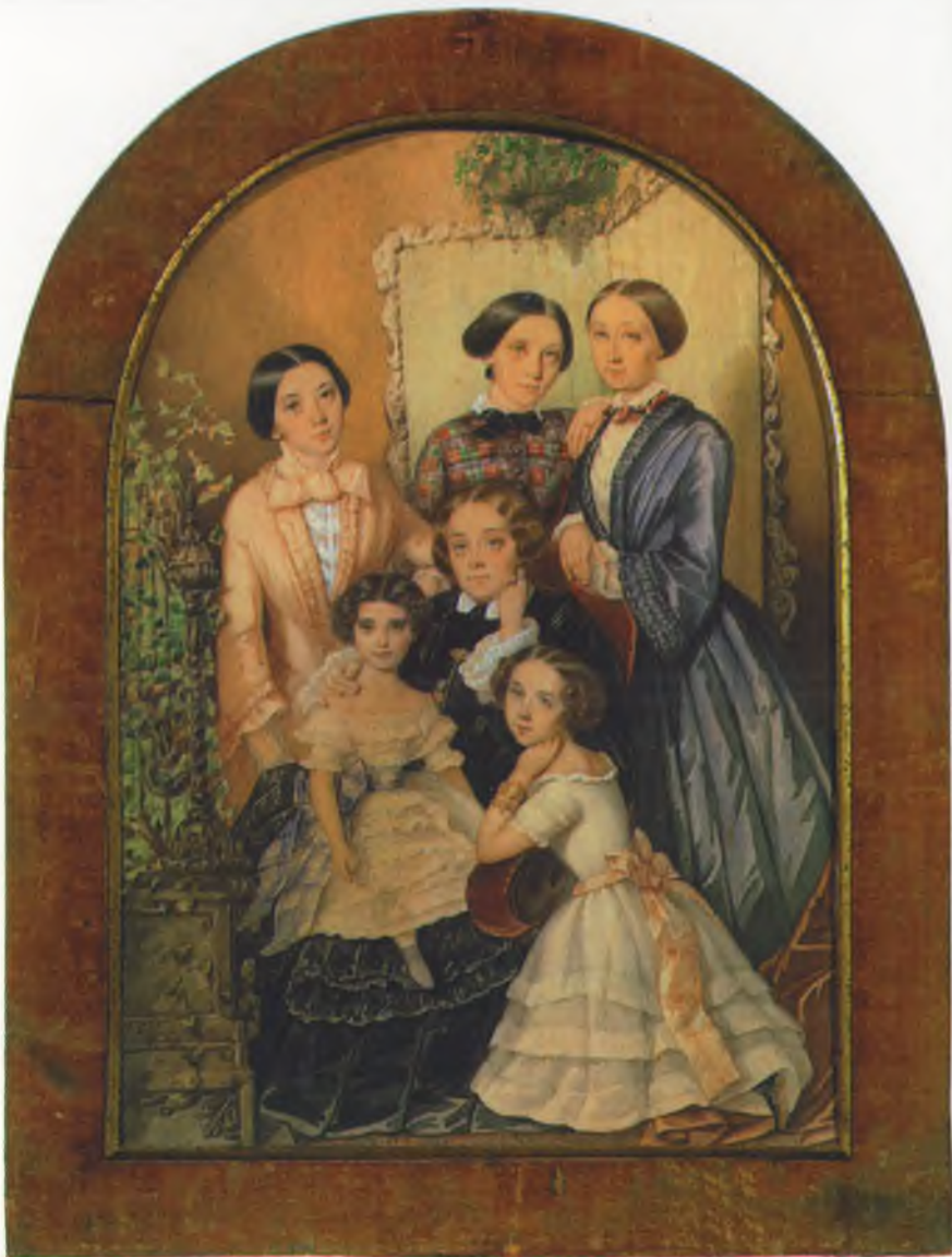
Судариков С.И. Портрет неизвестной с дочерьми Конец 1840-х гг.