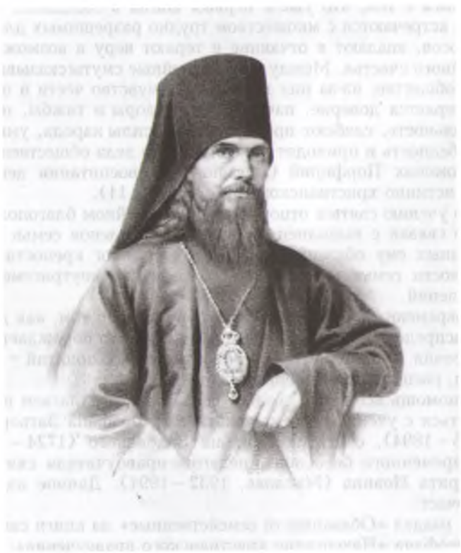
Святитель Феофан Затворник