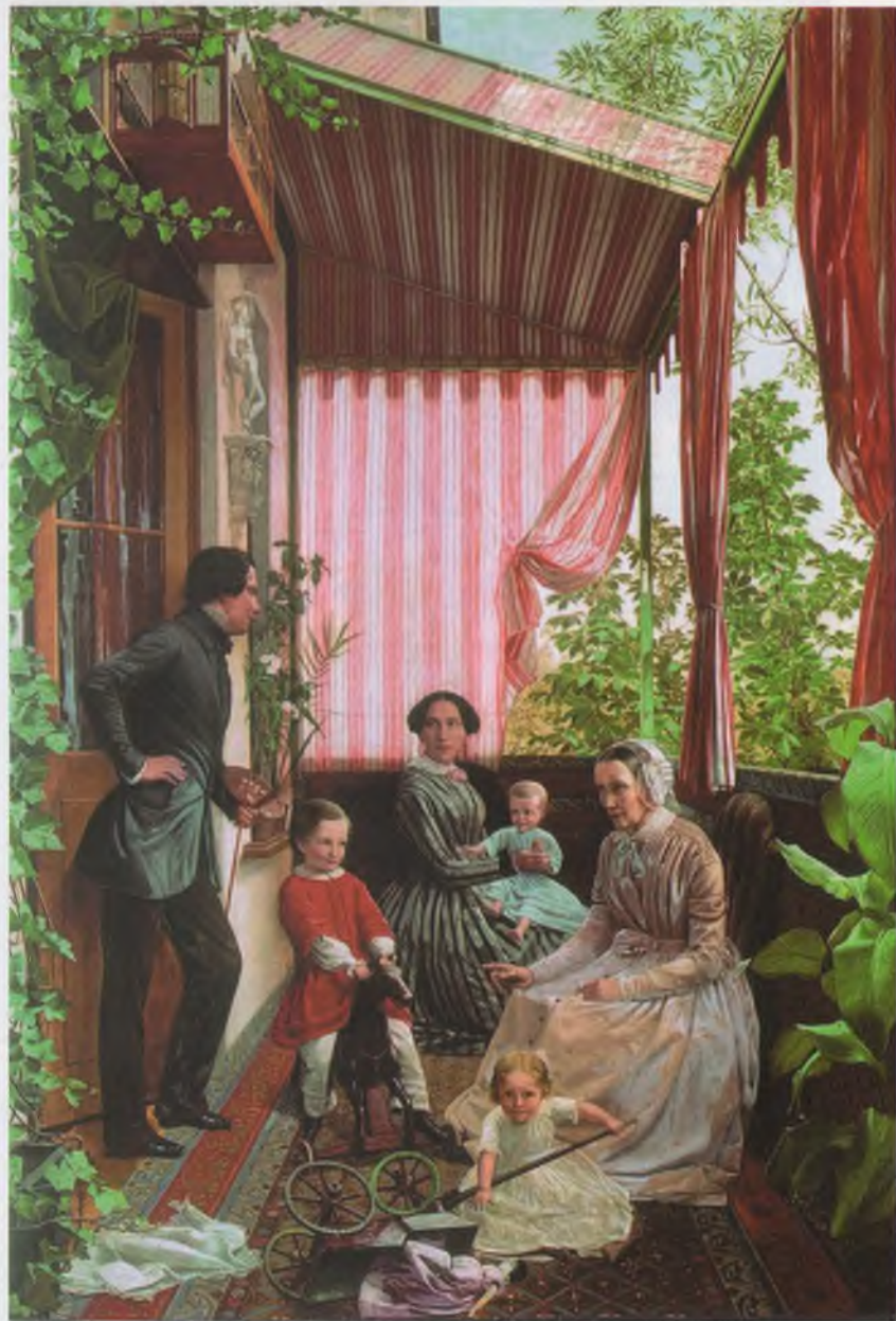
Славянский Ф.М. Семейная картина (На балконе) 1851