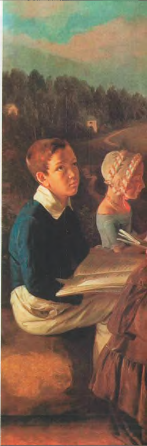
Хруцкий И.Ф. Семейный портрет 1854