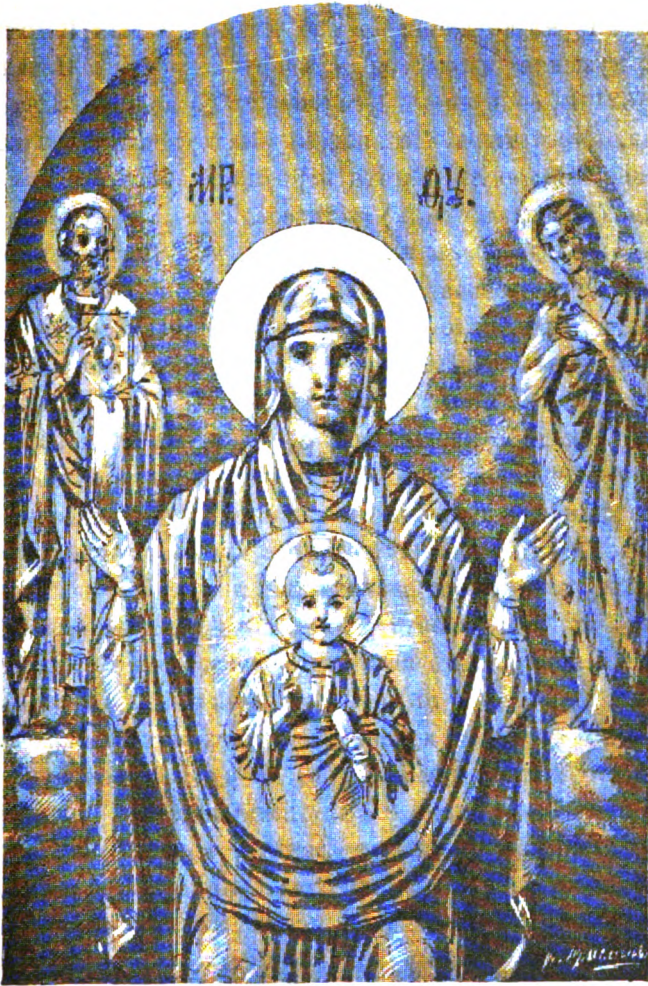
Абалакская икона Божіей Матери.