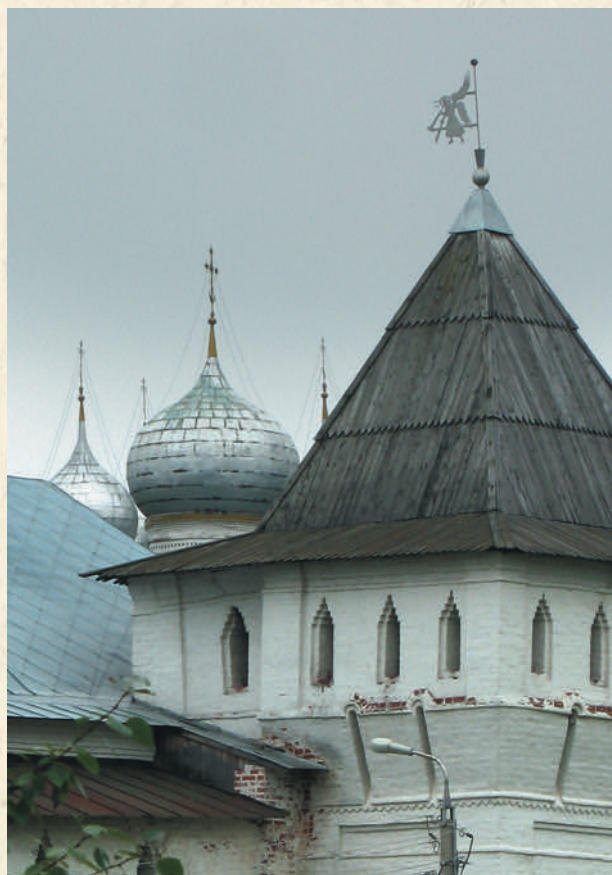
Угловая сторожевая башня

и часть зданий с музеем (Борисоглебский филиал Ростовского музея-заповедника), который находится здесь с 1924 года. Одной из традиций обители стало возобновление многодневного крестного хода, совершаемого ежегодно во второй половине июля в село Кондаково, на родину преподобного Иринарха. Тысячи человек собираются, чтобы вместе пройти долгий и благодатный путь из Борисоглебской обители до источника святого Иринарха Затворника. При этом участники по очереди несут на себе вериги святого.