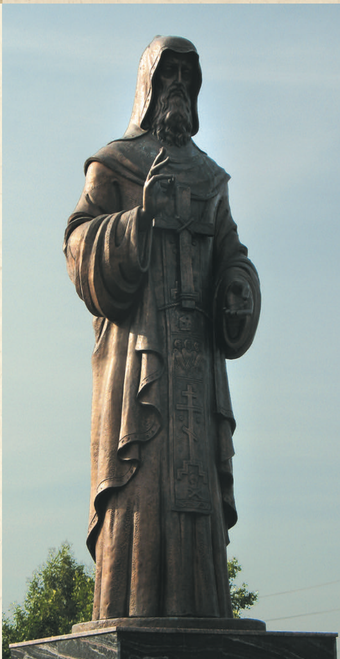
Памятник преподобному Иринарху Затворнику. Скульптор З. Церетели