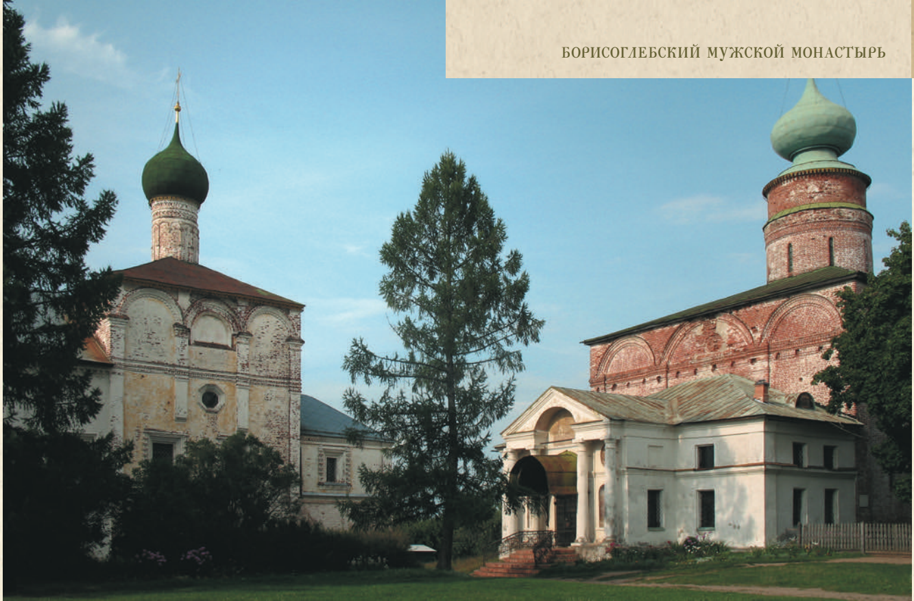
Благовещенский храм и Борисоглебский собор Борисоглебского монастыря