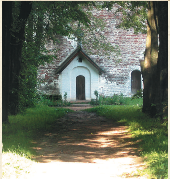
Келья преподобного Иринарха Затворника

Монастырь был возвращен Русской Православной Церкви в 1994 году. Возвращен, правда, частично — монашеская обитель продолжает делить территорию