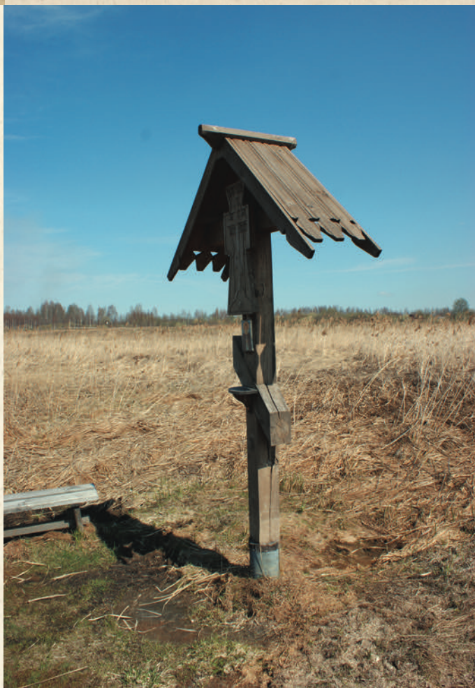
Крест на месте соляного источника в 800 метрах от Варницкого монастыря

строительство планируется завершить к 2014 году, когда будет отмечаться 700-летие со дня рождения святого.