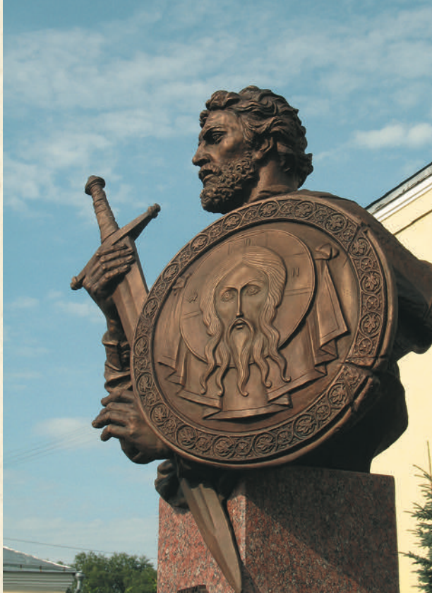
Памятник князю Дмитрию Пожарскому. Скульптор З. Церетели

надвратные церкви — Сергиевская и Сретенская — построены на исходе XVII столетия, пятый храм — в честь святого Иоанна Предтечи — устроен во втором ярусе звонницы.