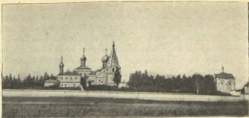
Даниловъ монастырь съ сѣверной стороны.