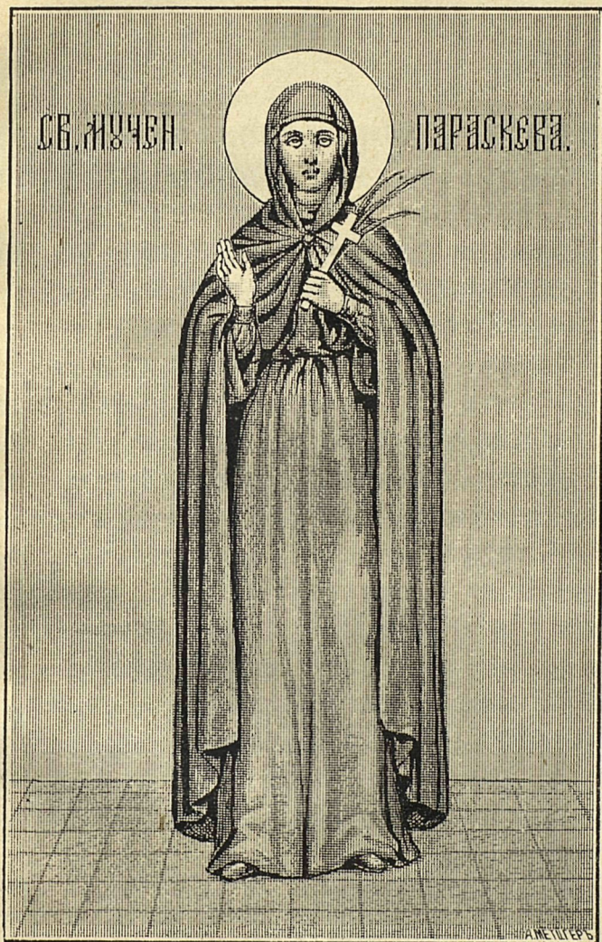
Св. мучен. Параскева.