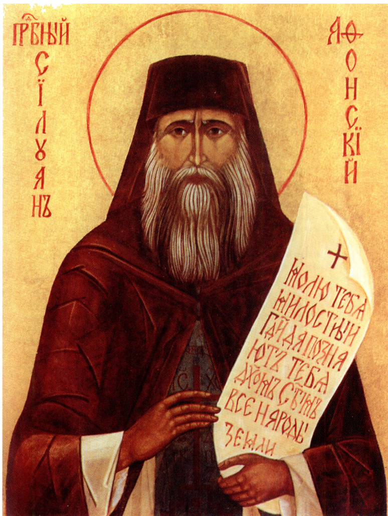
Прп. Силуан Афонский

Икона, письма схиархим. Софрония (Сахарова), из иконостаса храма в честь прп. Силуана Афонского Свято-Иоанно-Предтеченского монастыря (Эссекс, Англия)