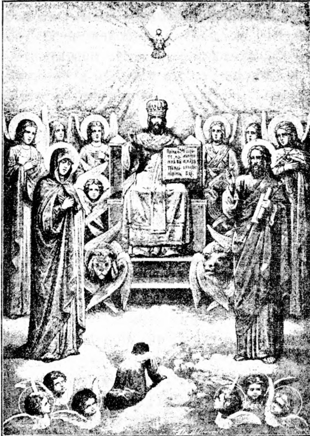
Созерцаніе рая душею и поклоненіе ея Богу.

чинялась и повиновалась и была ихъ рабою, то тѣмъ паче удерживается ими и въ ихъ остается власти, когда отходить изъ міра. А что касается до части благой, то долженъ ты представлять себѣ, что дѣло бываетъ такъ. При святыхъ рабахъ Божіихъ еще нынѣ