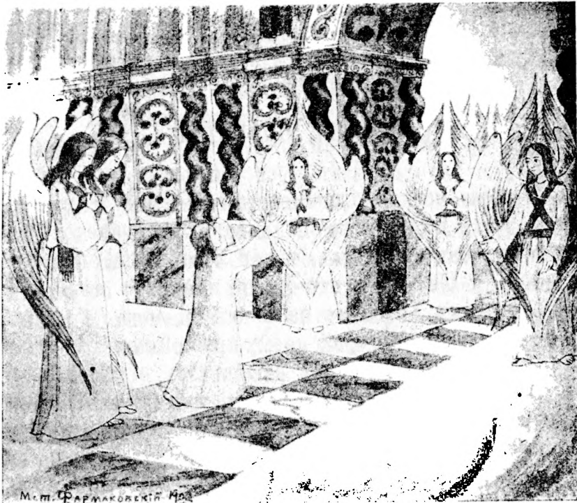
Предъ вратами небесными.

Итакъ, души совершенныхъ праведниковъ не задерживаются на воздушныхъ мытарствахъ, а прямо переносятся Ангелами въ царствіе небесное.