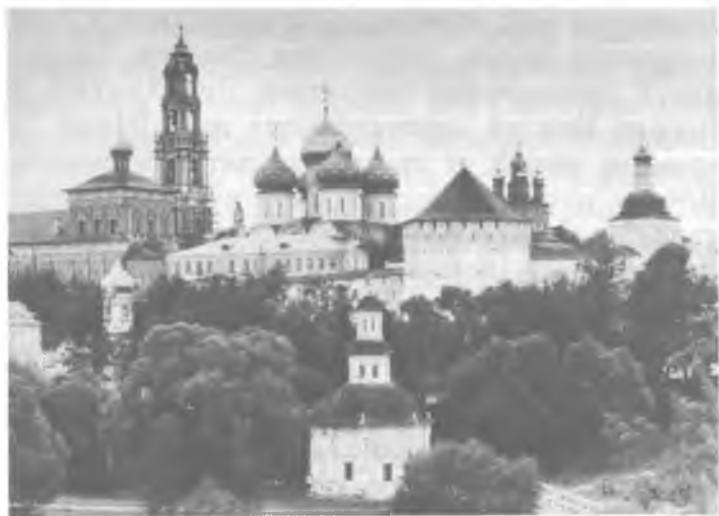
Свято-Троицкая Сергиева Лавра

Что же это такое — Церковь? Церковь, дорогие мои, есть то Царство Божие, о котором Господь возвестил в святом Евангелии. Вспомните первые слова евангельской проповеди: «Покайтесь, ибо приблизилось Царство Небесное» (Мф. 3, 2). Во время земной жизни Спасителя Царствие Божие только приблизилось, а после Его Вознесения на Небо, в день сошествия Святого Духа, Царствие Божие осуществилось на земле как царство благодати. Церковь есть царство благодати, она не от мира сего, она явилась на земле вместе с пришествием Духа Святого. Дух Святой открыл нам тайну Святой Единосущной, Соприсносущной, Нераздельной и Неслиянной Троицы.