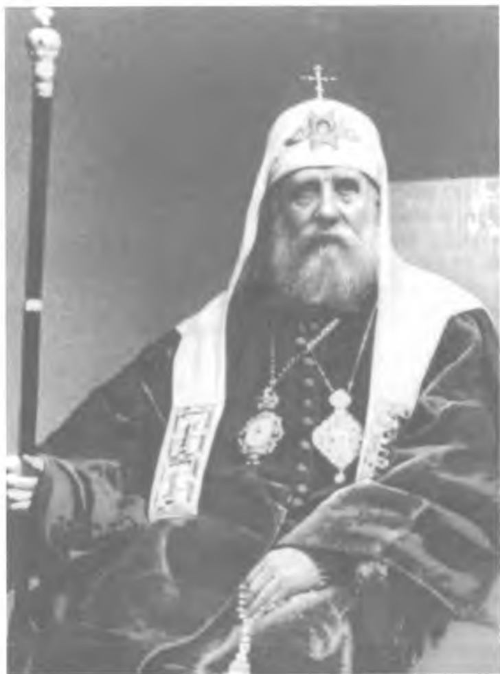
Святейший Патриарх Тихон