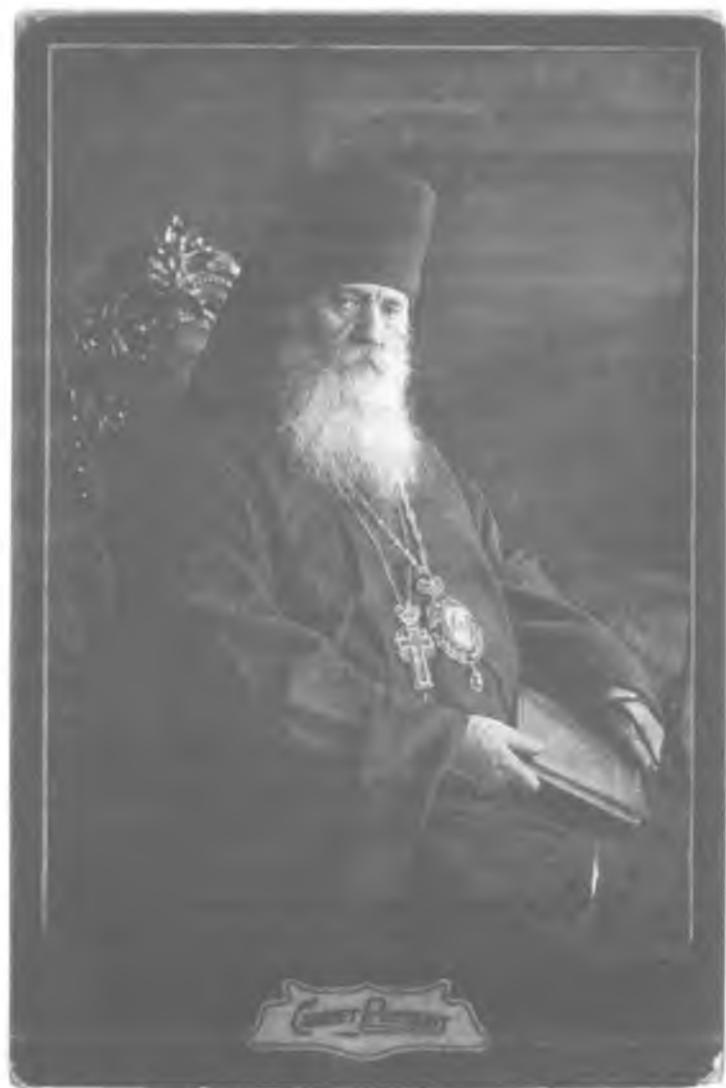
Архимандрит Кронид (Любимов), наместник Троице-Сергиевой Лавры