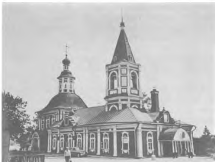
Храм во имя пророка Илии в Сергиевом Посаде