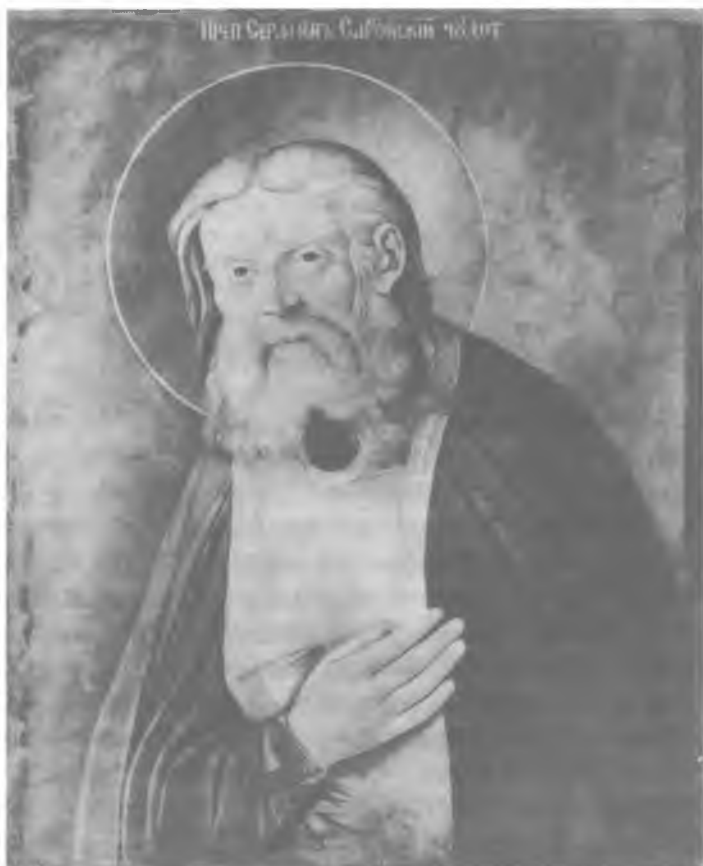
Икона прп. Серафима, принадлежавшая о. Тихону