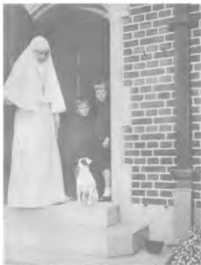
Великая княгиня Елизавета Феодоровна

И в молодости, и в преклонные лета отец Тихон отличался жаждой знаний. Он успешно учился в университете и был в то же время вольнослушателем Московской Духовной Академии 1 : писал работы на богословские темы, изучал церковную историю, апологику, экзегетику. Его дневник тех времен изобилует богословскими размышлениями — след раздумий над академическими сочинениями. Углубление в богословие не