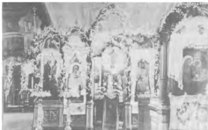
Праздничное убранство Ильинского храма