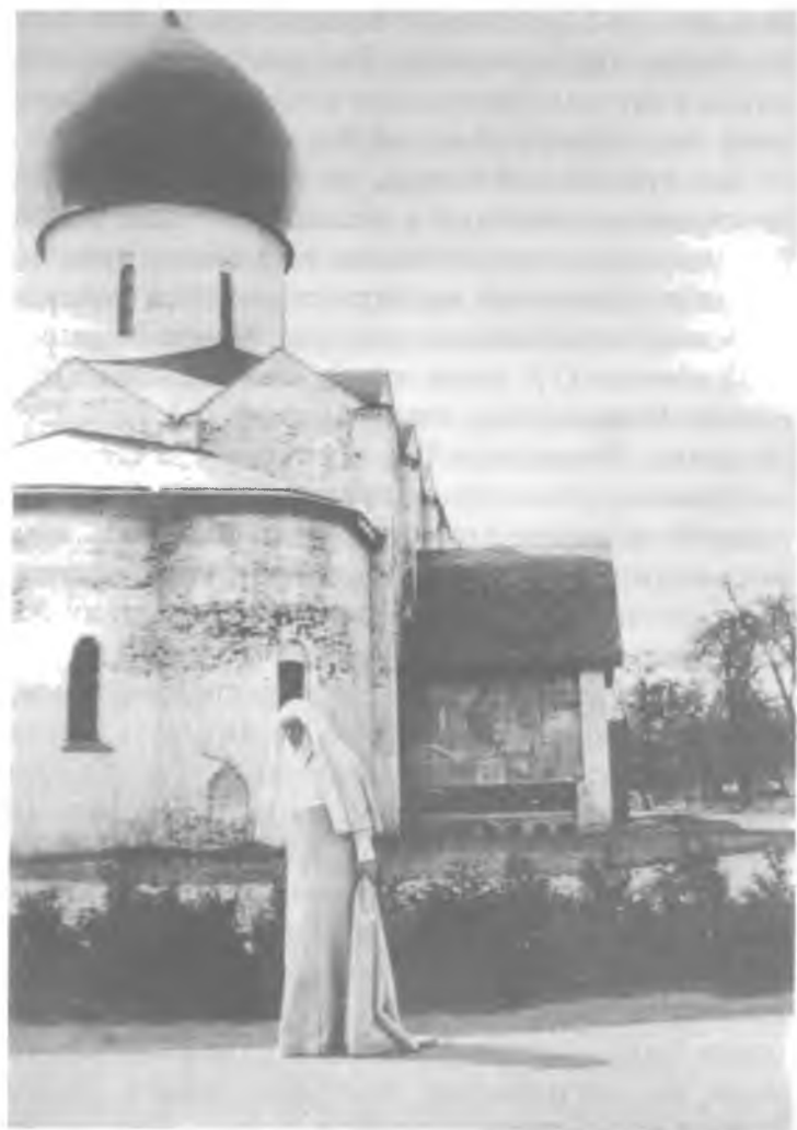
Марфо-Мариинская обитель. Храм Покрова Пресвятой Богородицы. Великая княгиня Елизавета Феодоровна