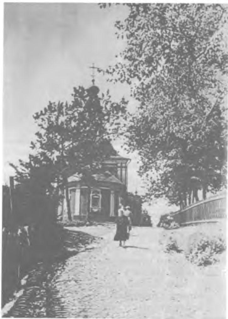
Дорога к Ильинскому храму

как космическое событие, происходящее здесь и сейчас, и основательно готовился к нему: прочитывал службу наступающего праздника, выделяя особо какую-то стихиру или прокимен, близкий