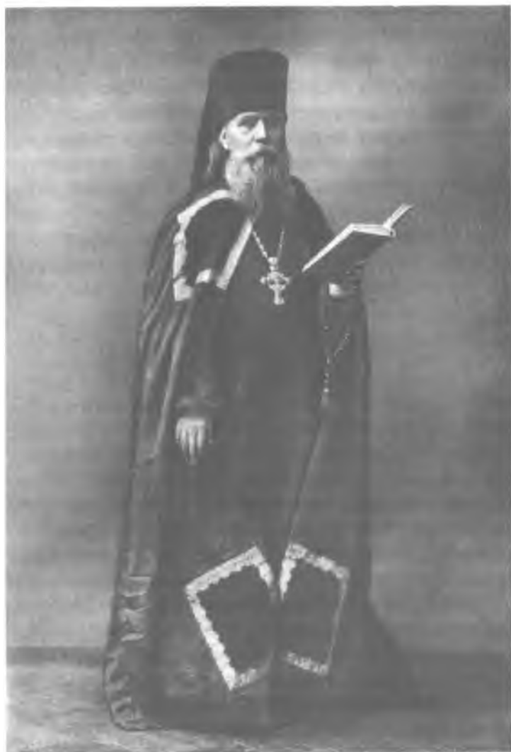
Архимандрит Георгий (Лавров)