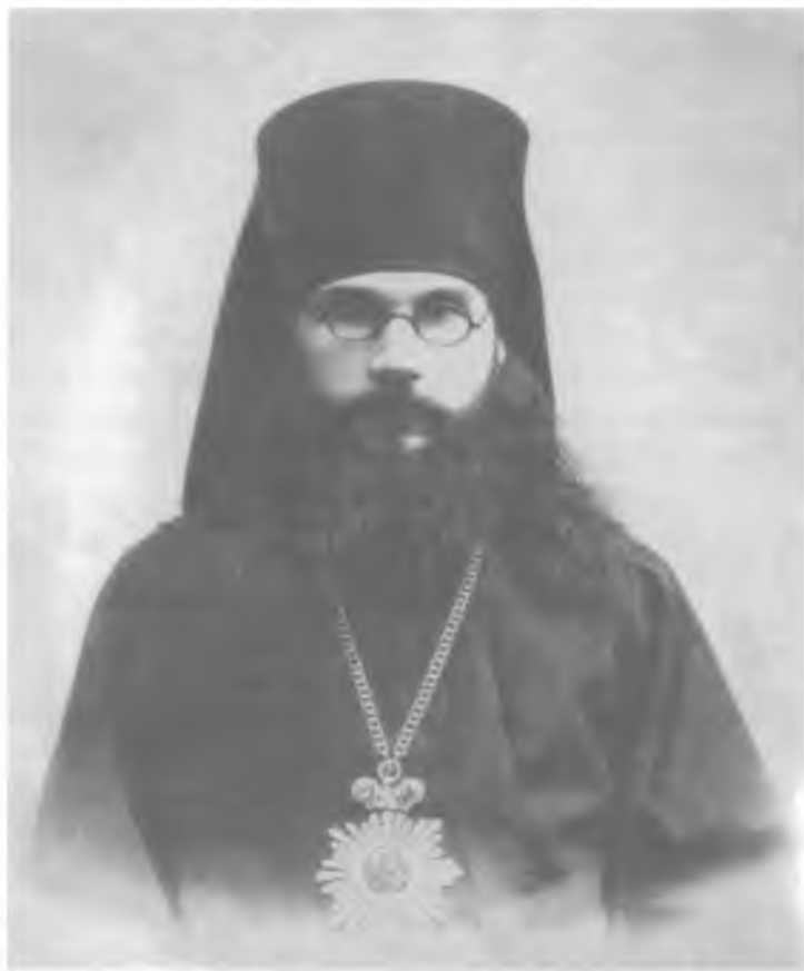
Архиепископ Феодор (Поздеевский)

чтобы привести в единство с Русской Православной Церковью иерархов и духовенство дальневосточных русских приходов, до того времени находившихся в расколе. Это поручение епископ Елевферий выполнил с большим тактом.