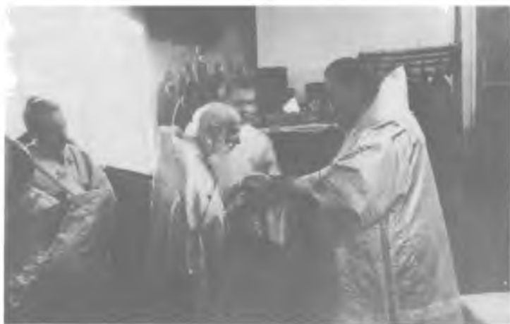
Митрополит Пимен (будущий Патриарх) за богослужением в Ильинском храме на Ильин день

посредственно реагировал на какие-то вещи, участвуя в общем разговоре, особенно с молодежью. Надо сказать, что он был всегда в курсе всех событий и новостей как церковных, так и общественно-политических. Следил за всем, что происходило не только в стране, но и в мире. Вспоминается такой эпизод: папа просматривает свежие газеты, именно просматривает, как всегда, схватывая самое важное в данный момент, и сокрушенно качает головой, вздыхает и медленно истохо крестится. Спрашиваю: «Что-то случилось?» А он отвечает, что гибнут люди, льется человеческая кровь. (Где-то на других континентах шли войны, ему это было не безразлично, ему было больно).