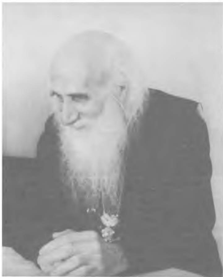
Протоиерей Тихон (Пелих). Фото 1970-х годов

лучить совет и наставление. Он в какой-то степени был, я бы сказал, сердцеводец. И не случайно отец Тихон был определен Святейшим Патриархом Алексием I духовником учащихся Московских Духовных школ. Это была особая честь. Святейший доверил его пастырскому душепопечительству молодых юношей, которые в трудные годы приходили учиться богословию. Не кому-то из монастырских старцев, которых