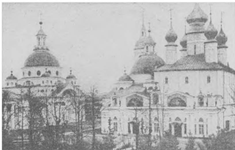
Спасо-Яковлевский Димитриев мужской монастырь, г. Ростов, Ярославская губ.