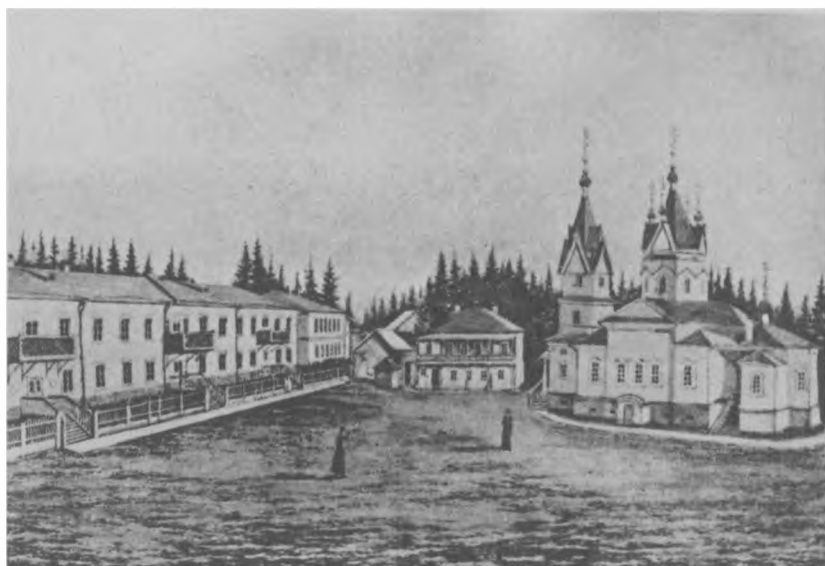
Александрo-Невский Филейский мужской монастырь, г. Вятка