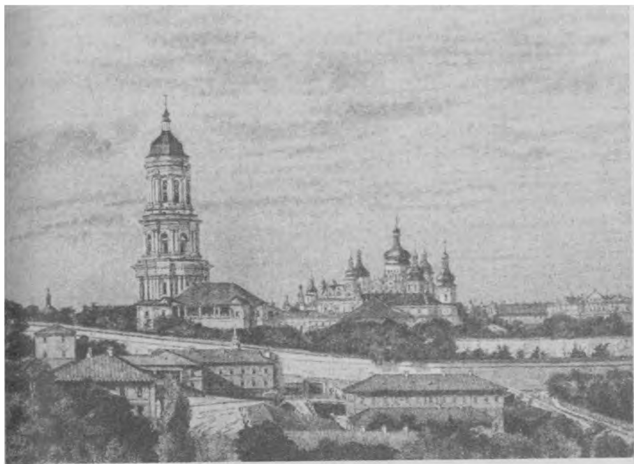
Киево-Печерская Лавра, г. Киев