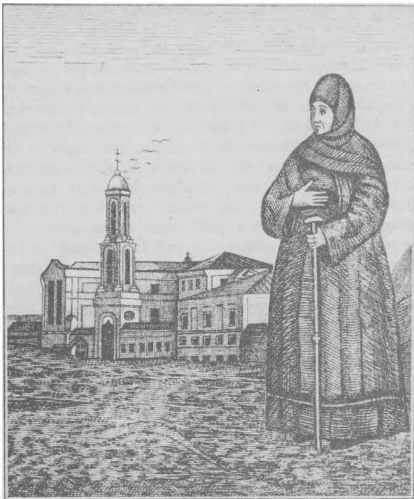
Старица Матрона Задонская