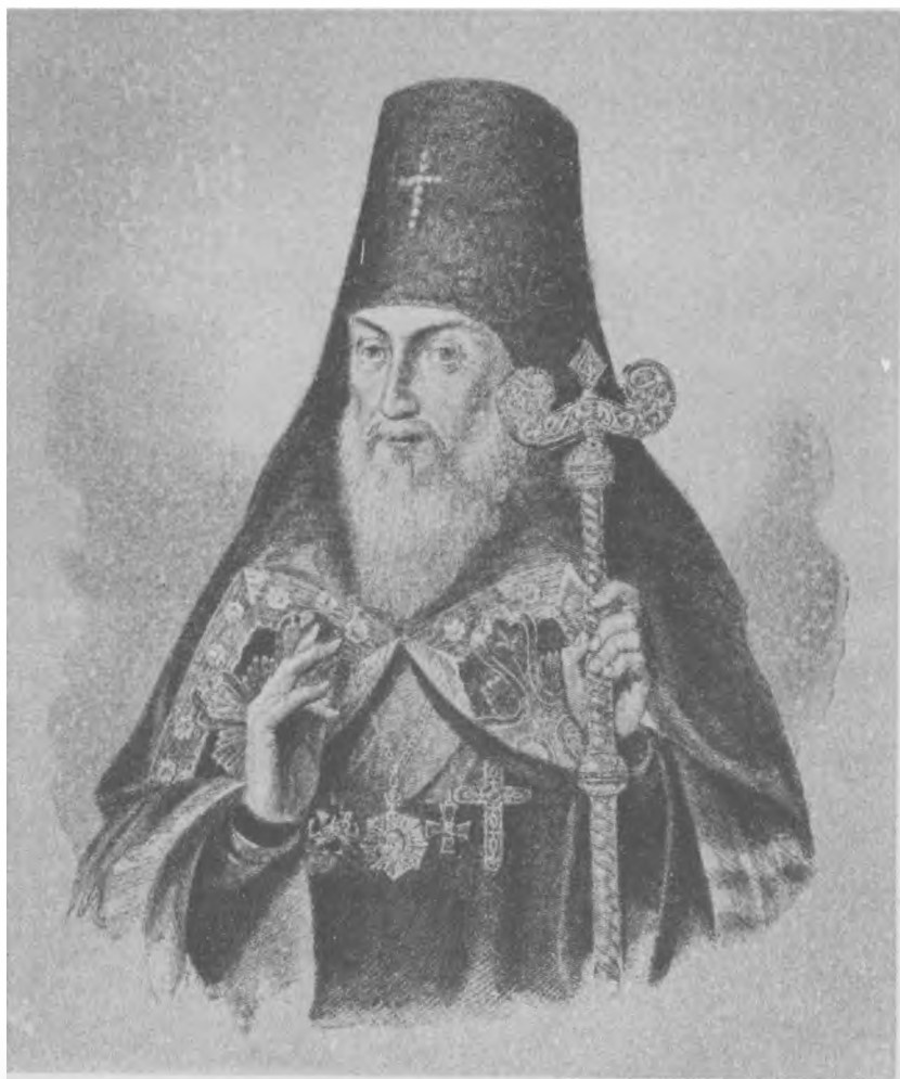
Преосвященный Антоний, архиепископ Воронежский и Задонский