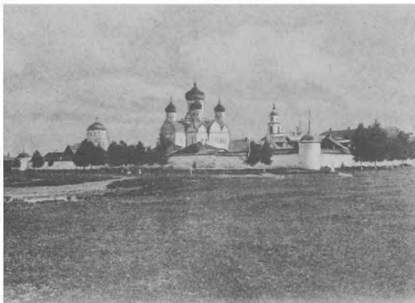
Кашинский Сретенский женский монастырь, Тверская губ.