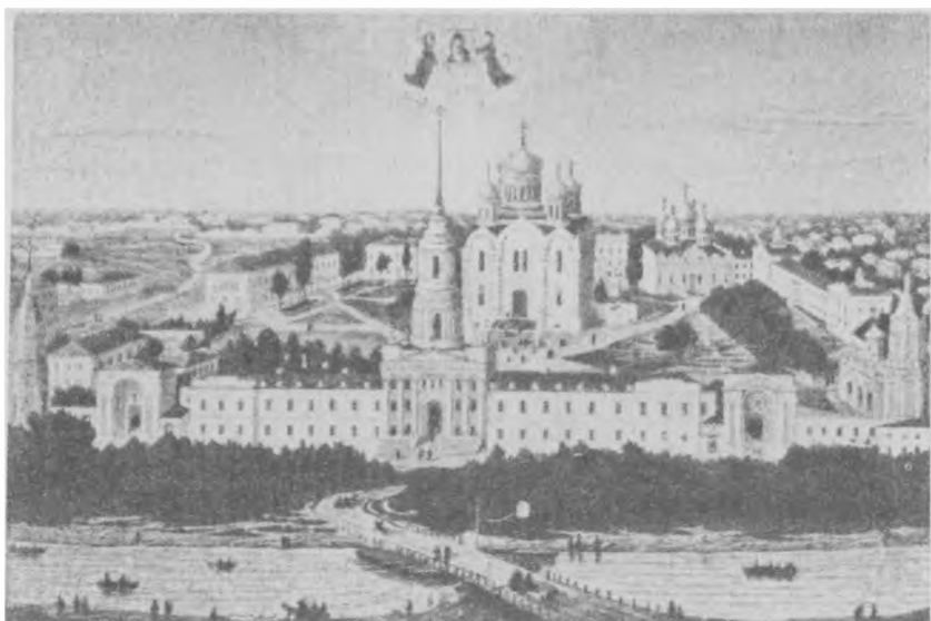
Задонский Богородицкий мужской монастырь, Воронежская губ.