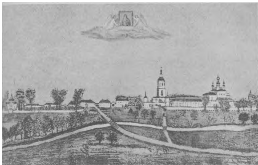
Санаксарский Богородицкий мужской монастырь, Тамбовская губ.