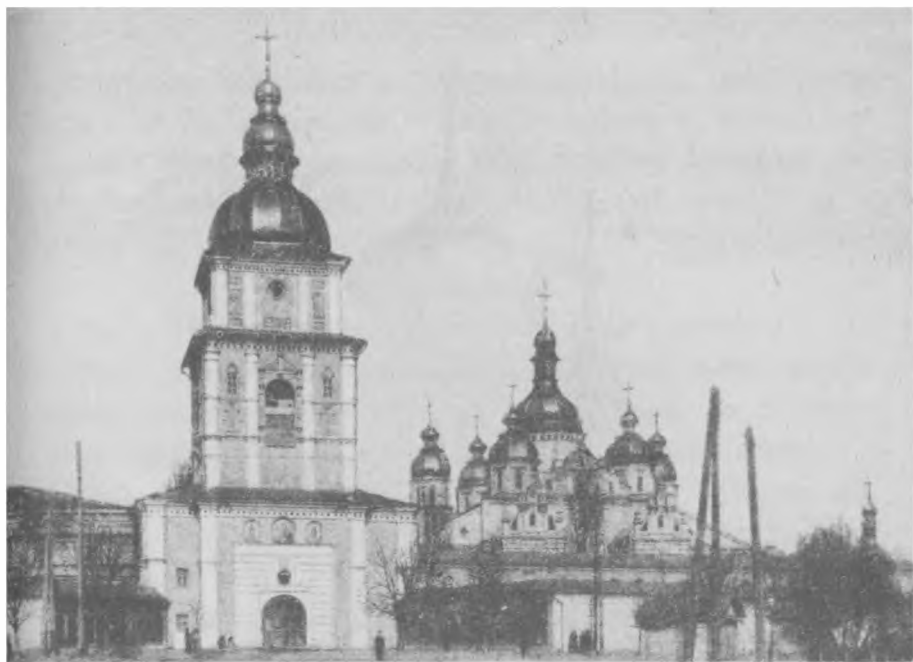
Киево-Михайловский Златоверхий мужской монастырь, г. Киев