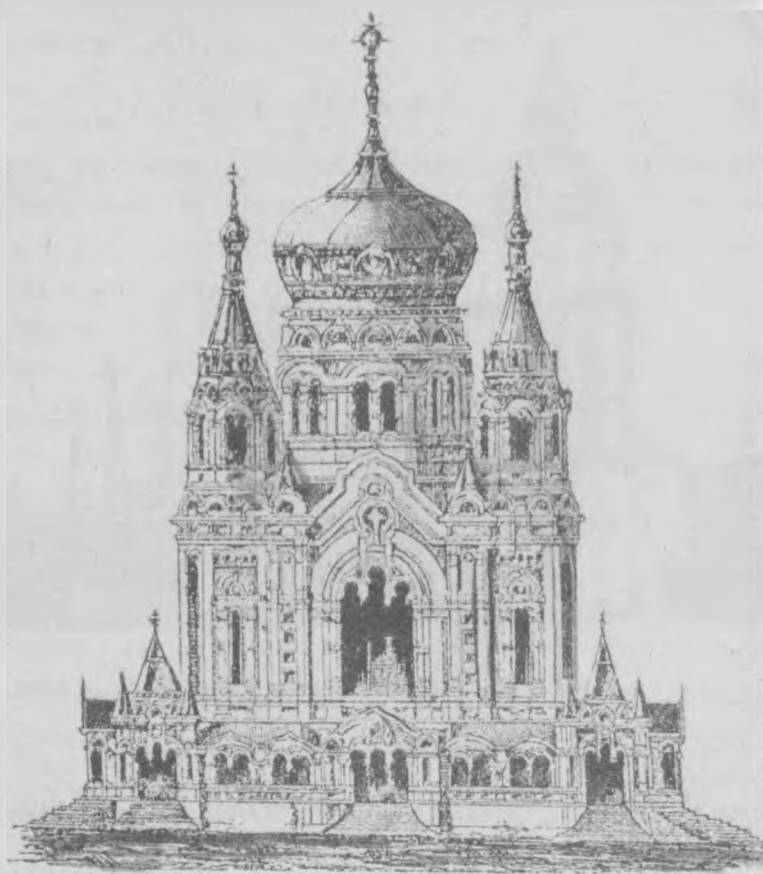
Феофания, мужской скит, Киевская губ.