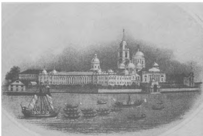
Нилова Столобенская мужская пустынь, Тверская губ.