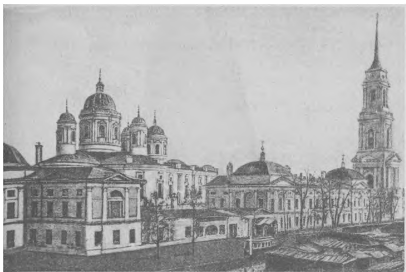
Благовещенский Митрофанов мужской монастырь, г. Воронеж