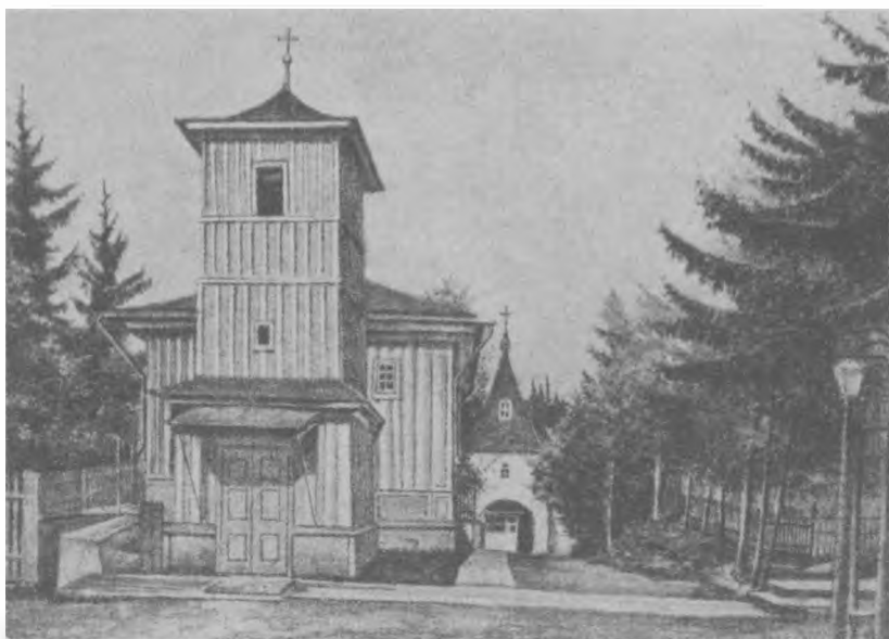
Успенский храм Александро-Невского монастыря, г. Вятка