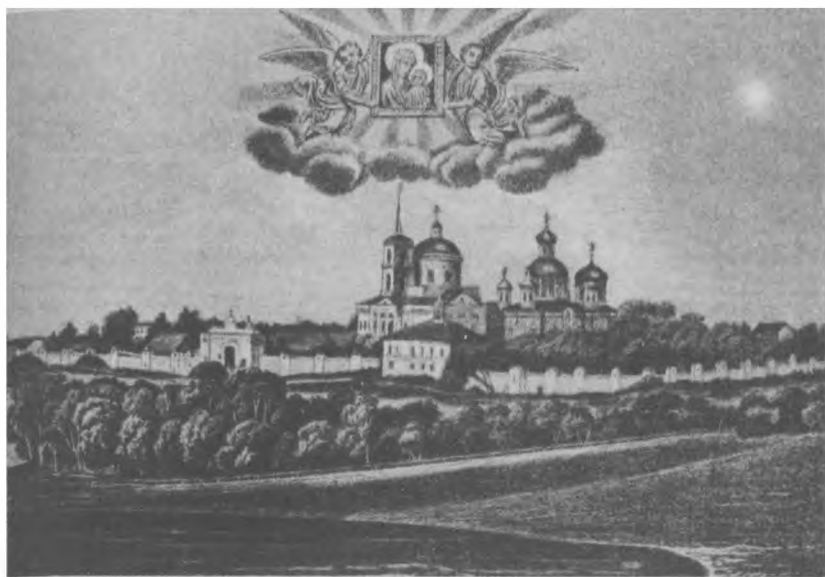
Селезновский Иоанно-Казанский женский монастырь, Тамбовская губ.