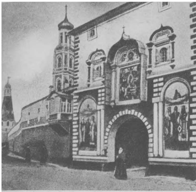
Святые врата Симонова мужского монастыря, г. Москва