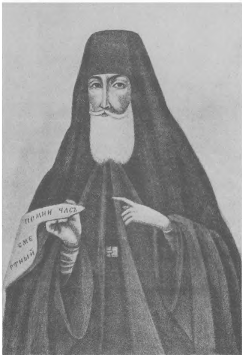
Старец Феодор Санаксарский