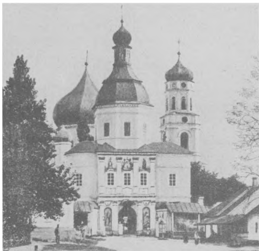
Иверский храм и под ним Святые врата Глинской Рождество-Богородицкой мужской пустыни, Курская губ.