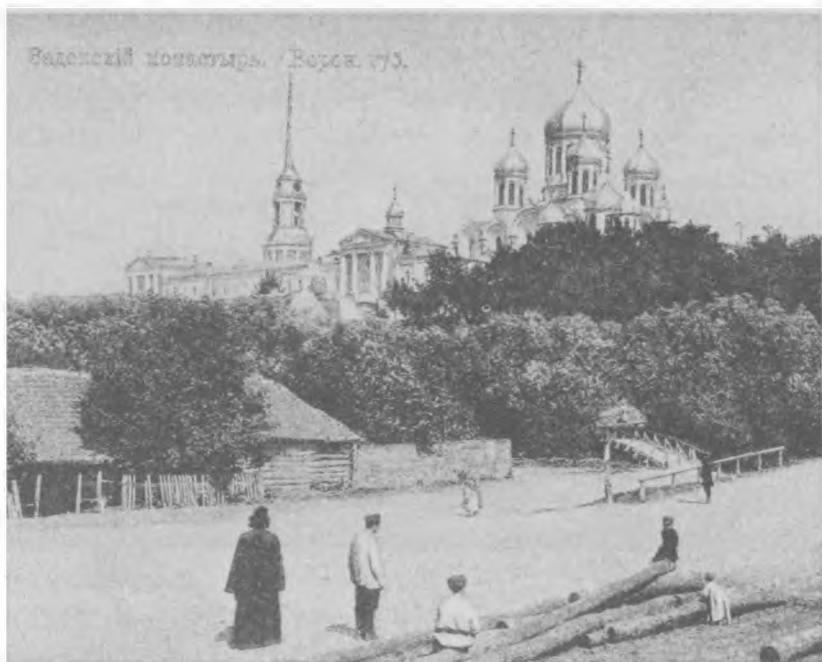
Близ стен Задонского Богородицкого монастыря