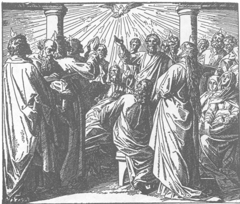
Сошествие св. Духа на апостолов