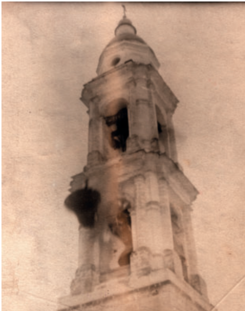
Сброс колоколов со звонницы храма Архангела Михаила.