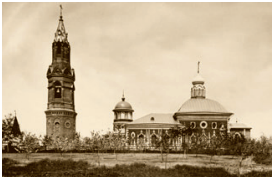
Никольский мужской единоверческий монастырь в Москве.