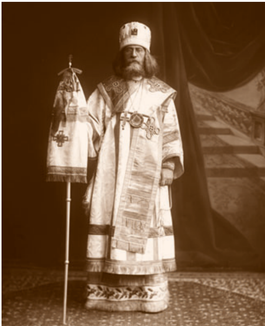
Первый единоверческий епископ священномученик Симон (Шлеев).