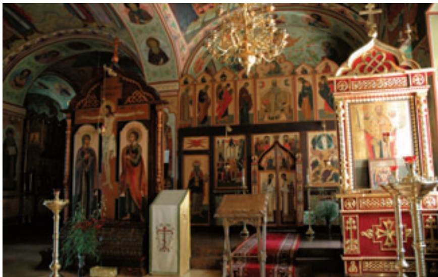
Никольский придел храма Архангела Михаила.