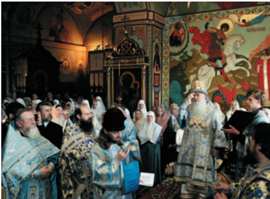
Архиерейское богослужение в Михаило-Архангельском единоверческом храме села Михайловская Слобода возглавляет митрополит Крутицкий и Коломенский Ювеналий.