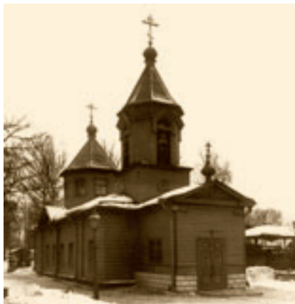
Благовещенская единоверческая церковь на Волковом кладбище в Санкт-Петербурге. Фото начала XX века

С восшествием в 1825 году на престол императора Николая I Павловича отношение правительства к старообрядчеству ужесточилось. Изданные при Александре I постановления относительно нежелательности полемики православного духовенства со старообрядцами о вере были отменены, раздавались