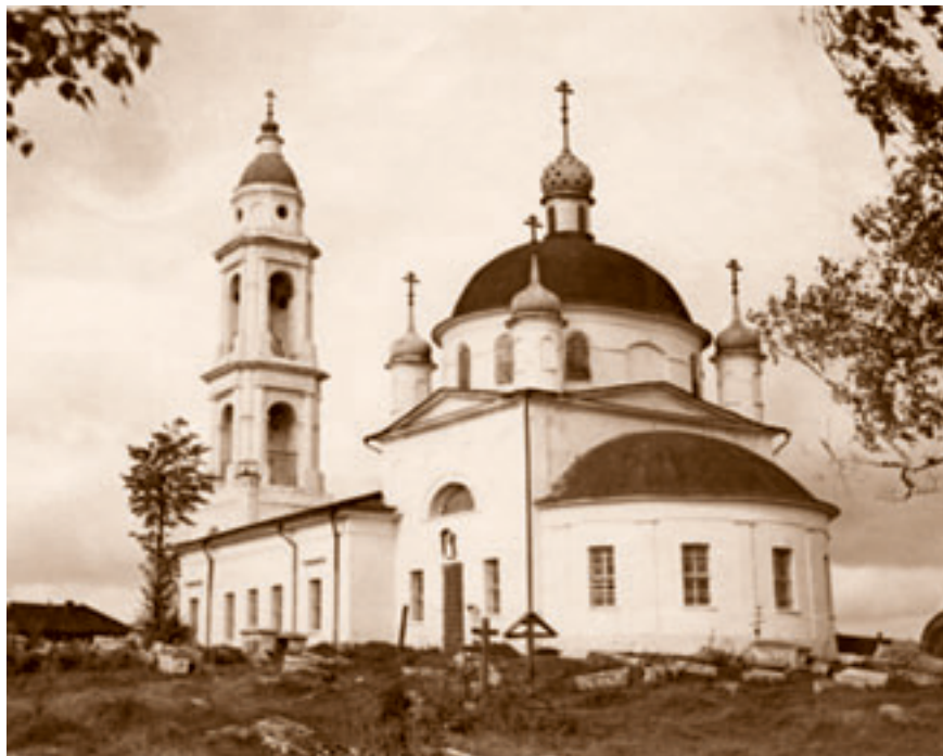
Храм Архангела Михаила в 1950–1960-е годы