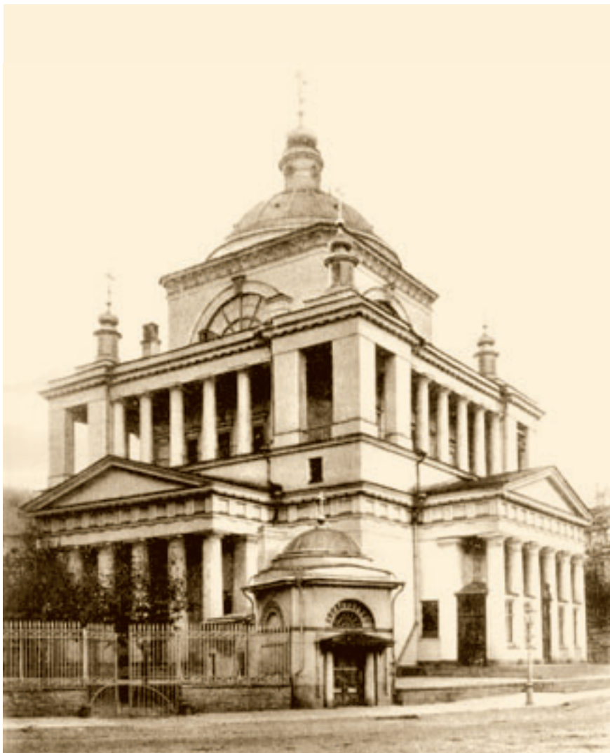
Никольская единоверческая церковь на Николаевской улице в Санкт-Петербурге.