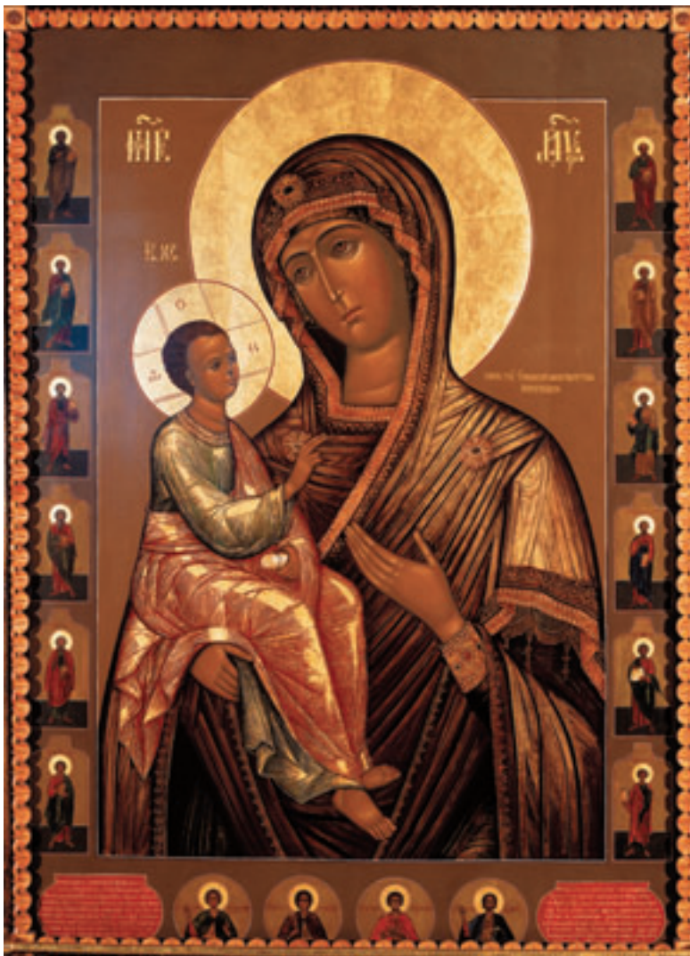
Икона Пресвятой Богородицы Иерусалимская.