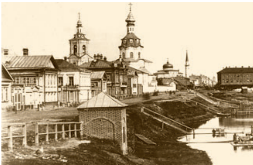
Четырех-Евангелистовский единоверческий храм в Казани.