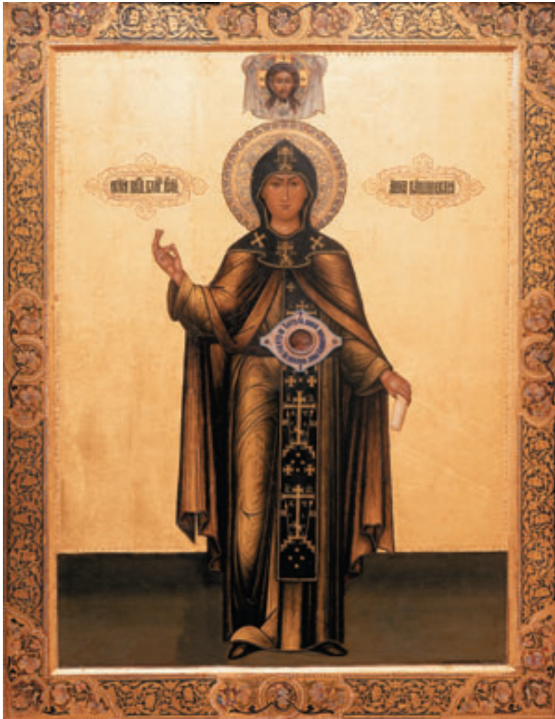
Икона преподобной Анны Кашинской.