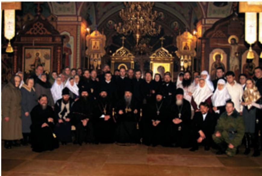
После архиерейского богослужения с епископом Каракасским и Южно-Американским Иоанном.