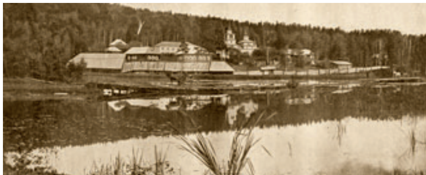
Воскресенский мужской единоверческий монастырь в Златоусте.