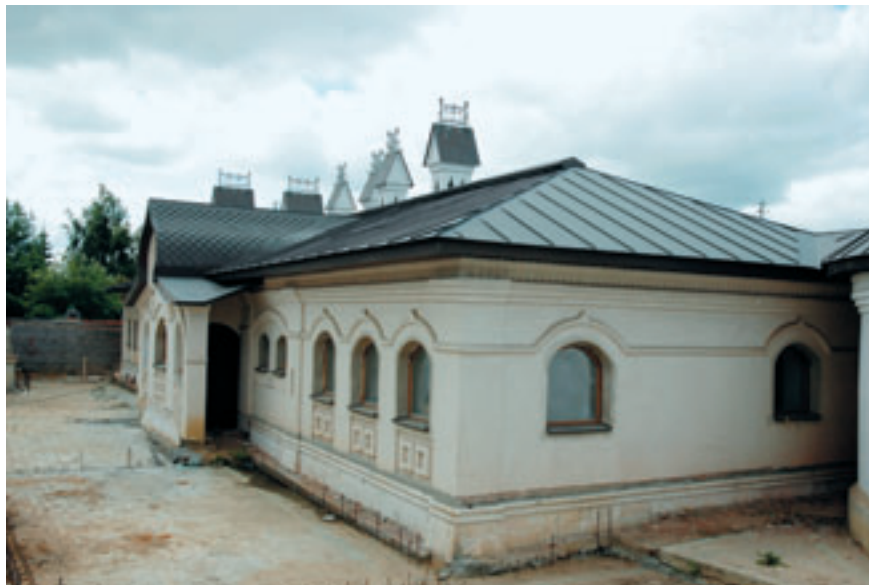
Административное здание на территории храма Архангела Михаила.