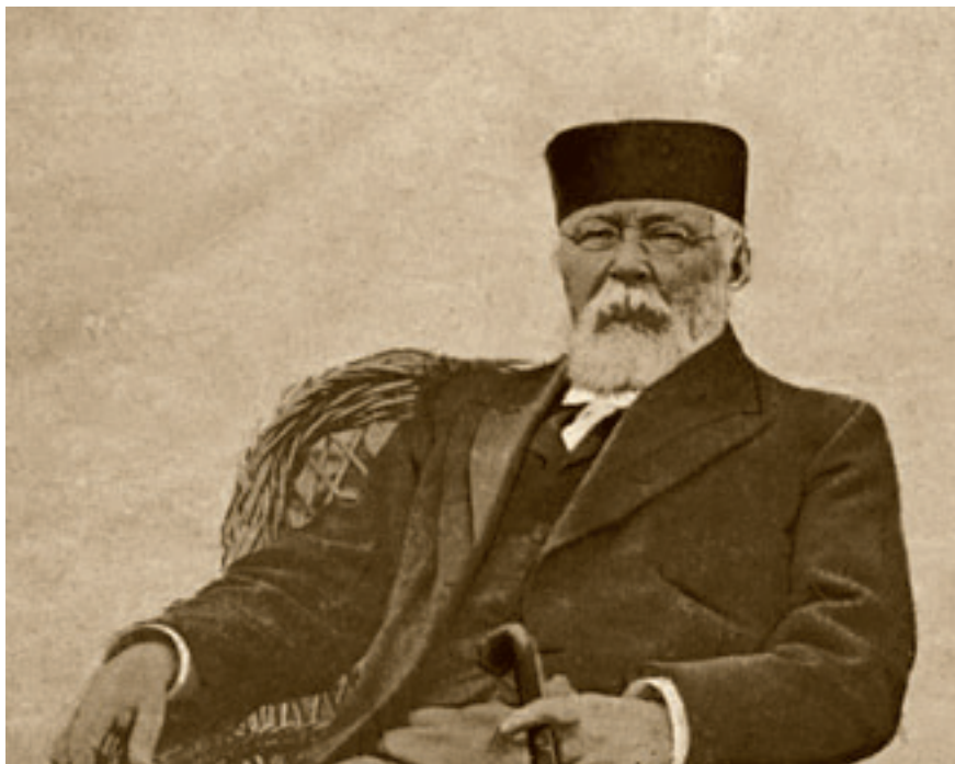
Тертий Иванович Филиппов.