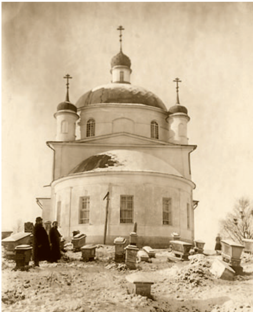
Алтарная апсида храма Архангела Михаила.