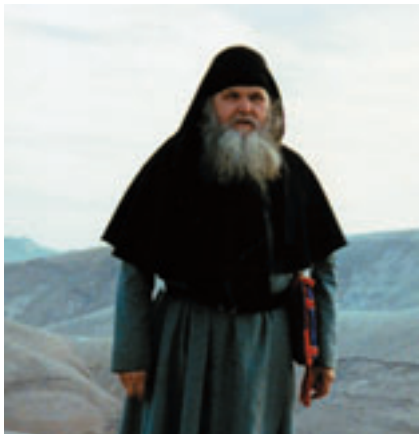
Епископ Даниил Ирийский.