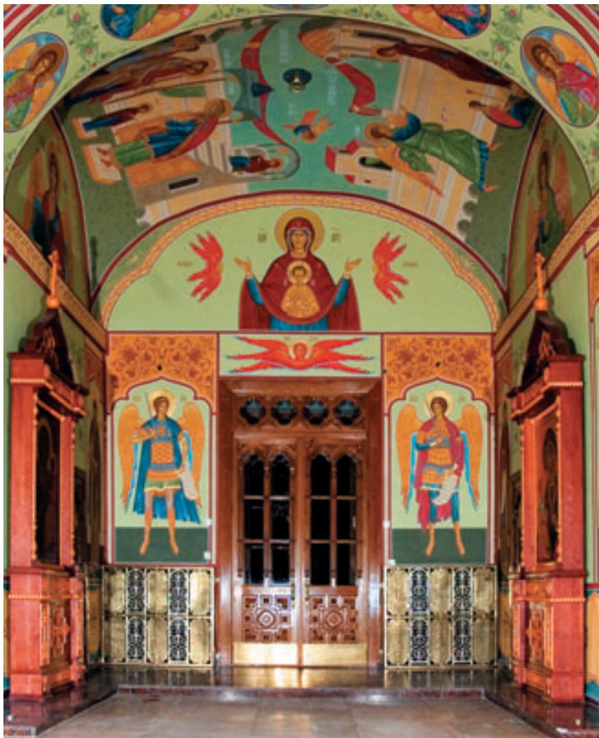
Западная часть трапезной храма Архангела Михаила.