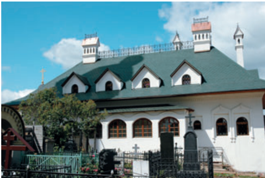
Дом причта храма Архангела Михаила.