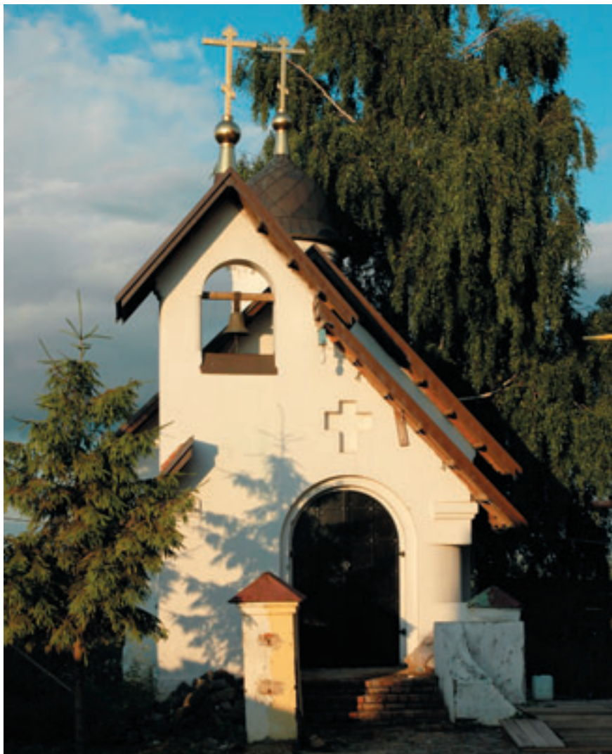
Церковь преподобной Анны Кашинской.