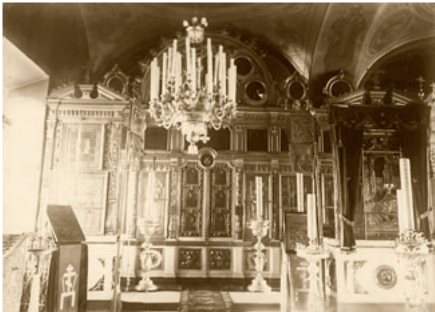
Георгиевский придел храма Архангела Михаила.