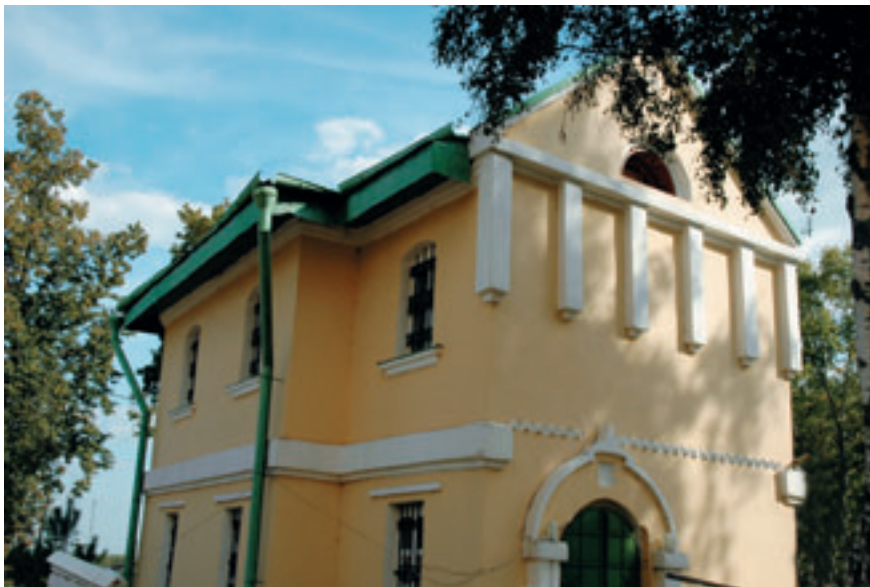
Братский (бывший трапезный) корпус на территории храма Архангела Михаила.