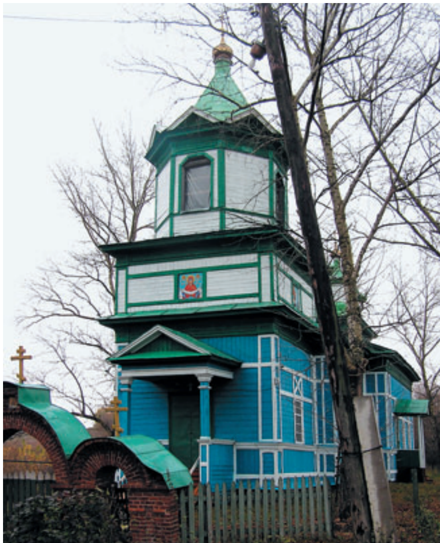
Покровская единоверческая церковь села Малое Мурашкино.