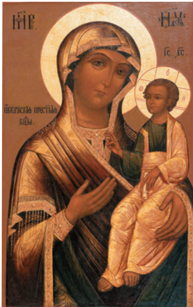
Икона Пресвятой Богородицы Иверская.