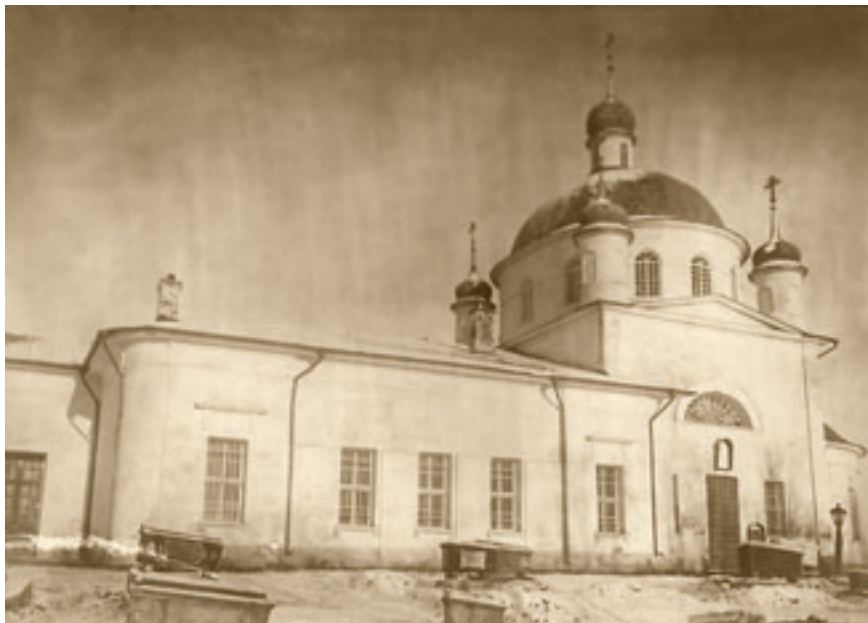
Южный фасад храма Архангела Михаила.