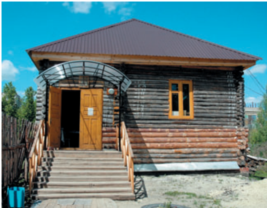
Часовня при строящемся Никольском единоверческом храме в Кузнецке.