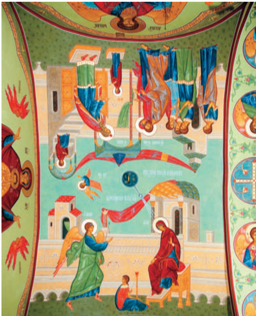
Свод западной части трапезной храма Архангела Михаила.