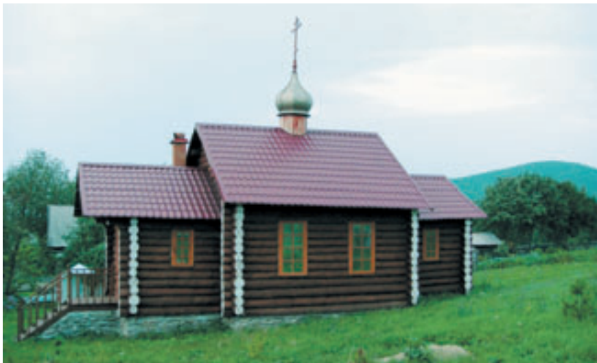
Михаило-Архангельский единоверческий храм в Верхнем Тагиле.