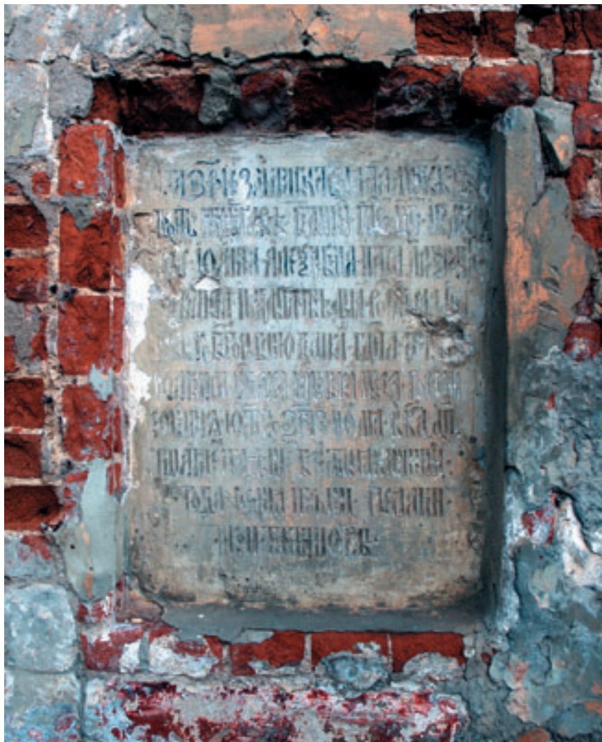
Закладная доска на южном фасаде храма Архангела Михаила.