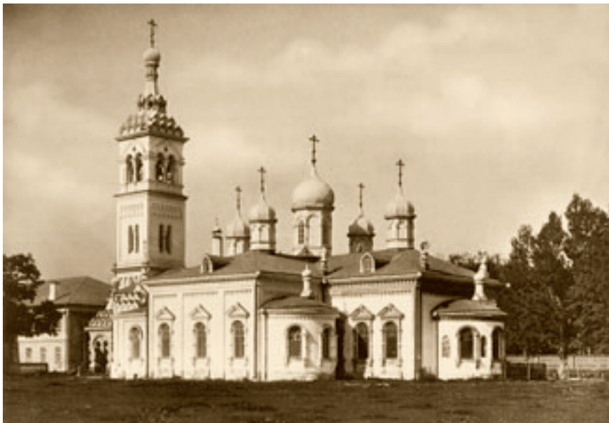
Никольская единоверческая церковь на Рогожском кладбище в Москве.