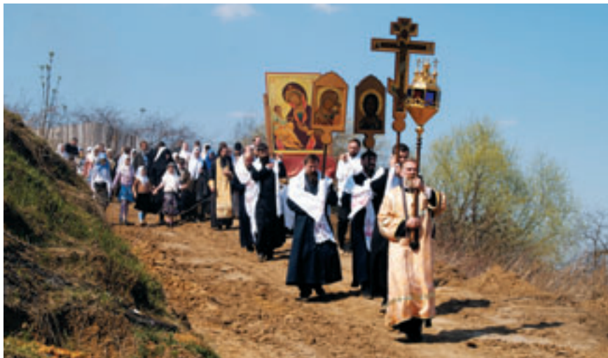
Крестный ход, посвященный Иеросалимской иконе Пресвятой Богородицы в Неделю святых Жен-Мироносиц.