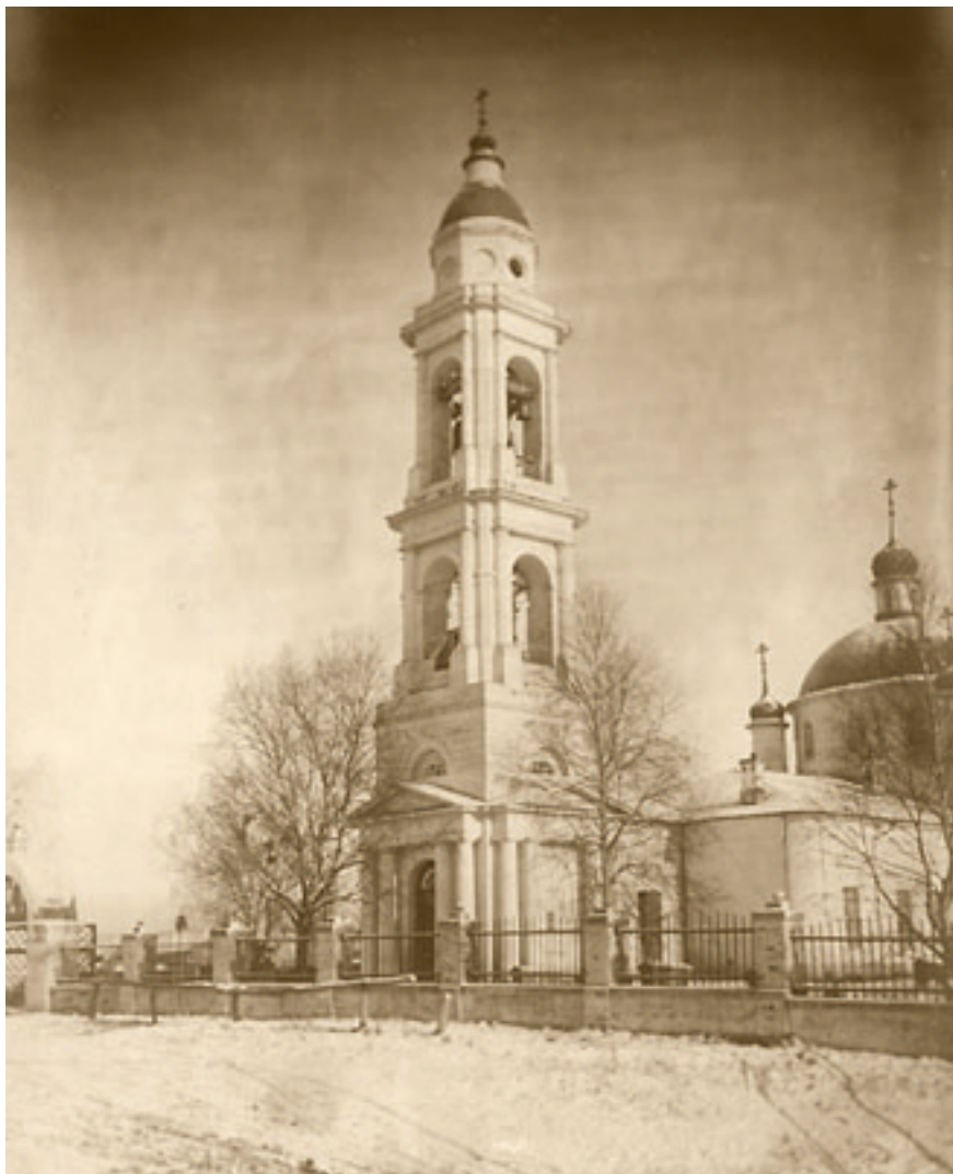
Юго-восточный фасад храма Архангела Михаила.