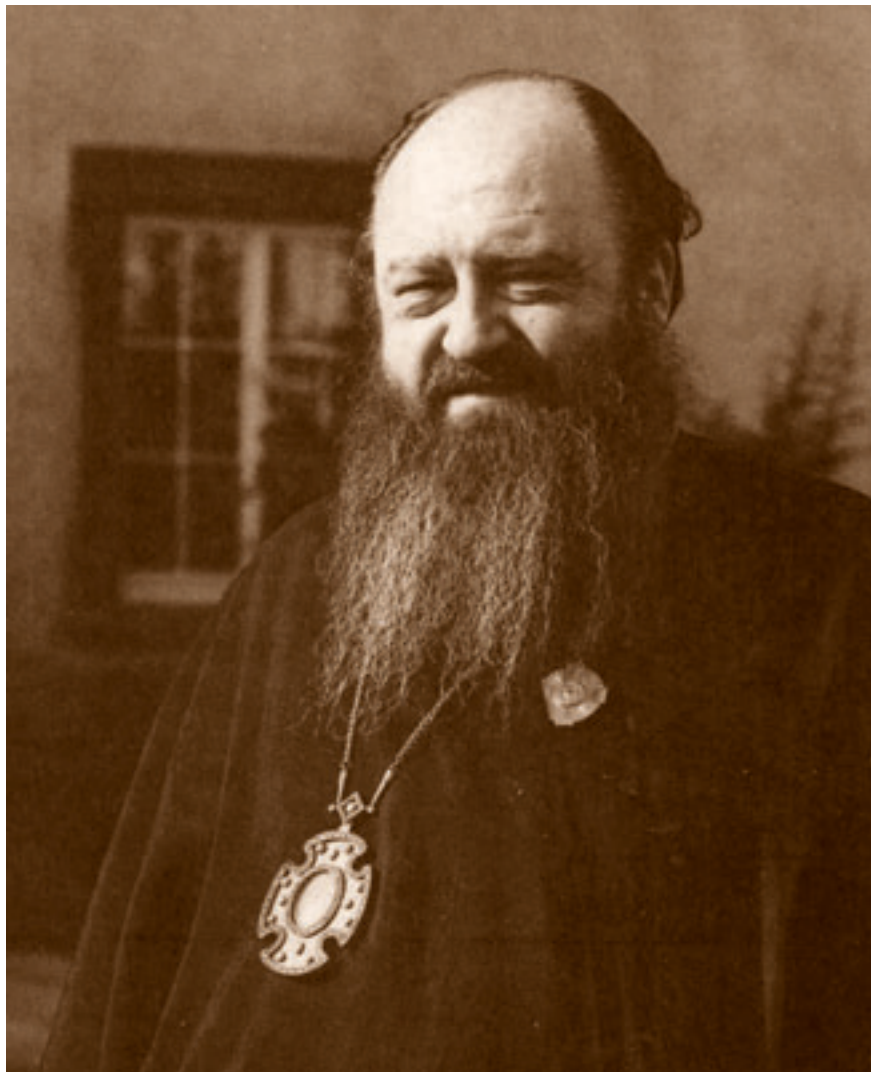
Митрополит Ленинградский и Новгородский Никодим (Ротов).