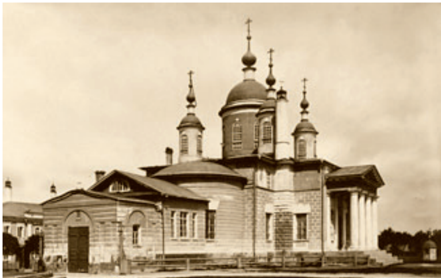
Введенский единоверческий храм в Москве.