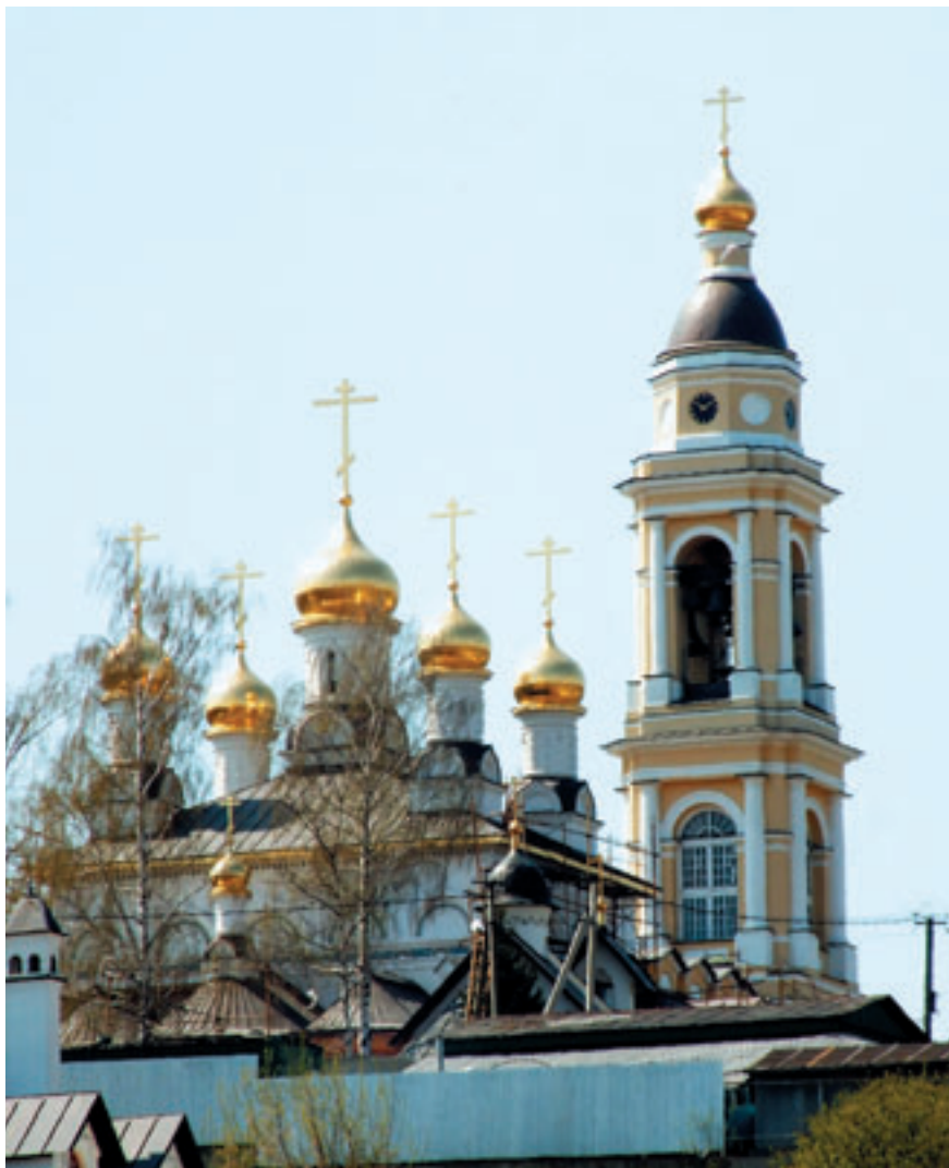
Храм Архангела Михаила после реконструкции.