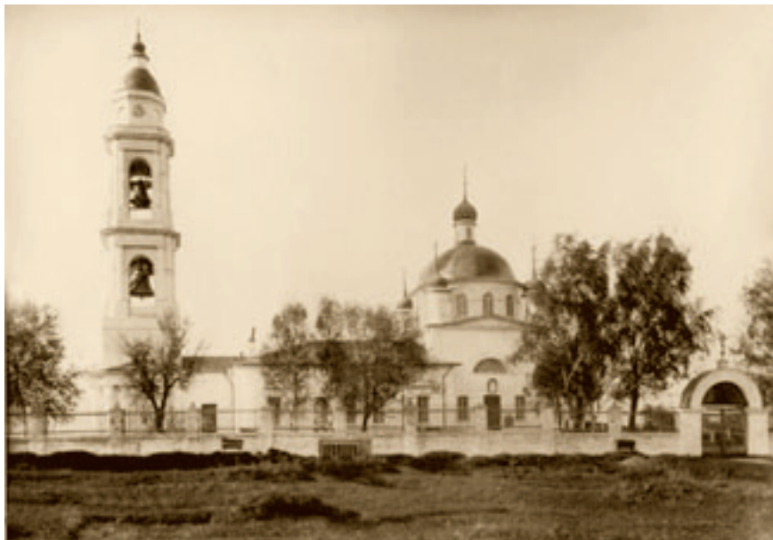
Михаило-Архангельский единоверческий храм в Михайловской Слободе.