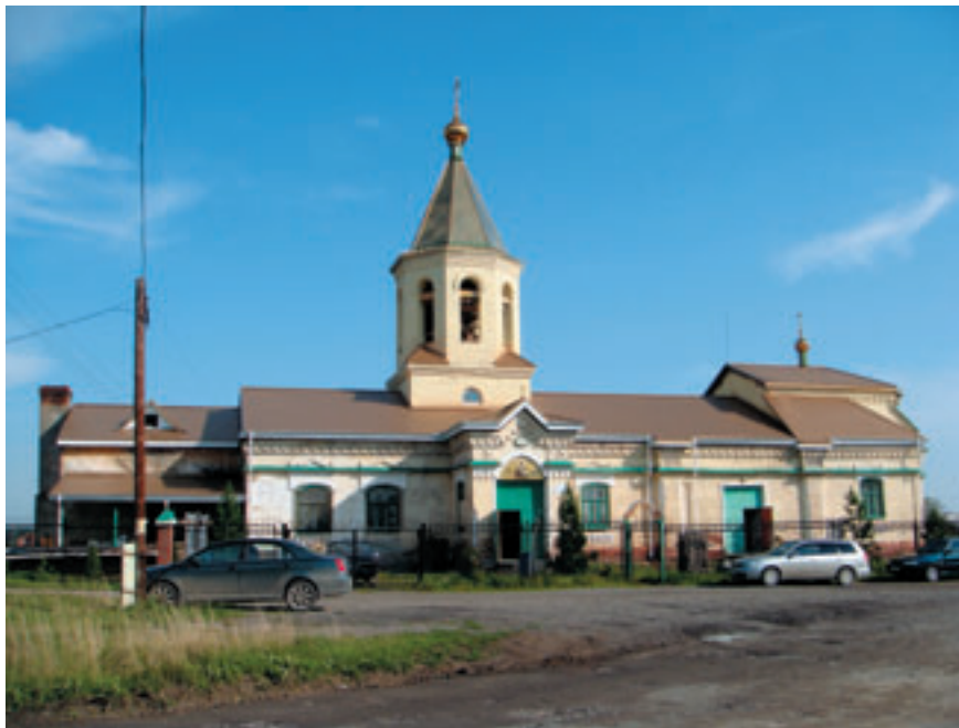
Никольский единовещеский храм в Нижнем Тагиле.