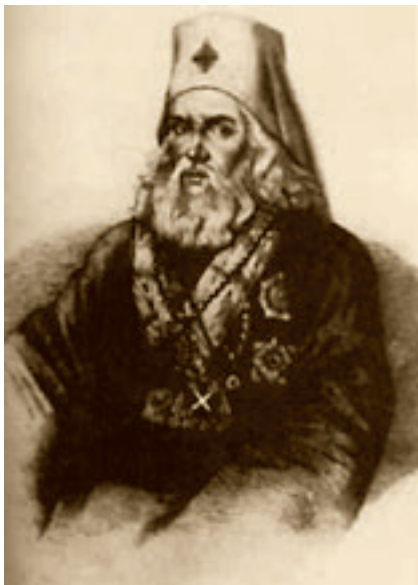
Митрополит Платон (Левшин).