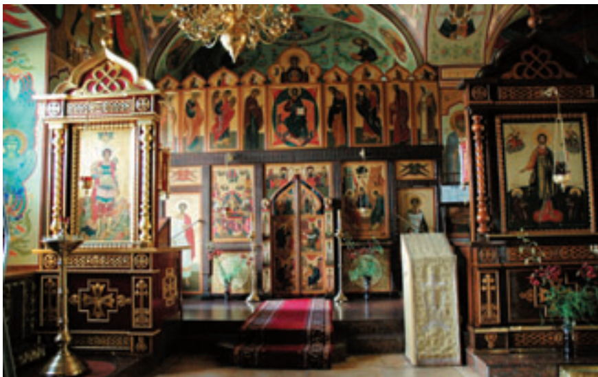
Георгиевский придел храма Архангела Михаила.