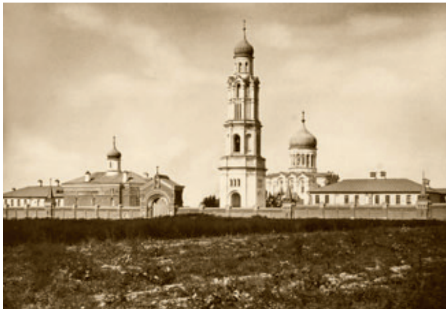
Всехсвятский женский единоверческий монастырь в Москве.