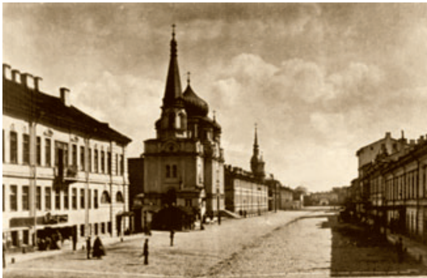
Никола-Миловская единоверческая церковь в Санкт-Петербурге.