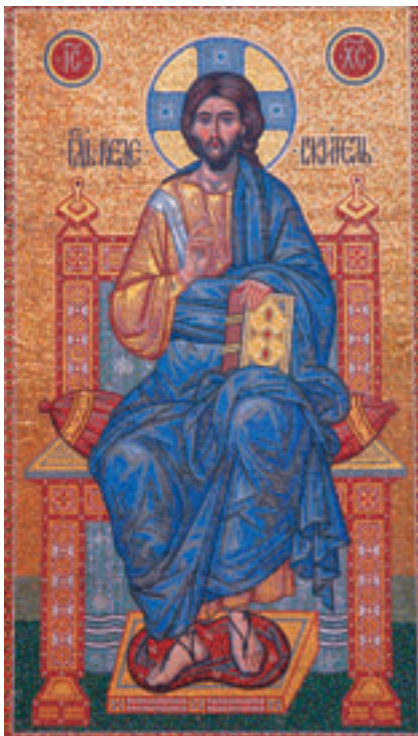
Мозаичная икона «Господь Вседержитель», установленная на фасаде трапезной части храма Архангела Михаила.