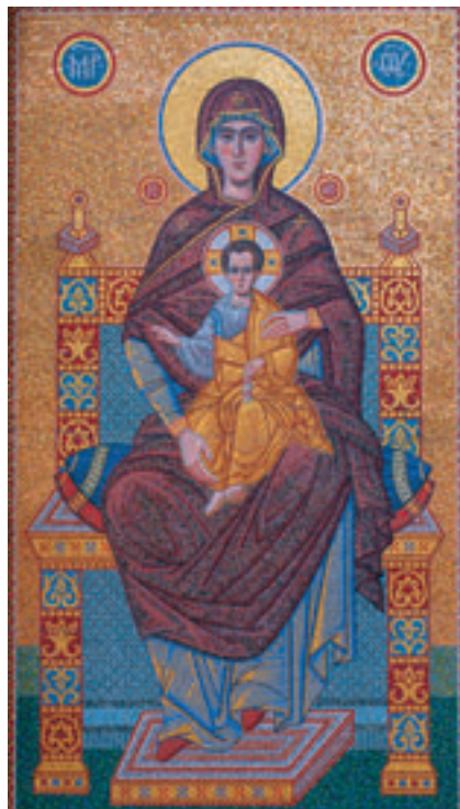
Мозаичная икона «Знамение Пресвятой Богородицы», установленная на фасаде трапезной части храма Архангела Михаила.