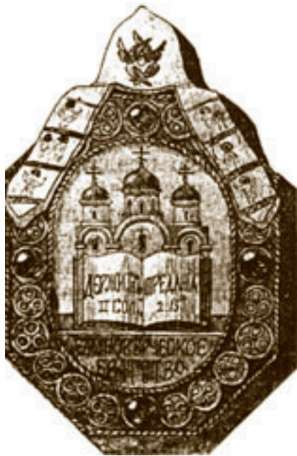
Знак Санкт-Петербургского единоверческого братства.

выражений в противораскольничьей литературе смотрят не как на истинных чад Церкви, что Единоверие считается лишь переходной ступенью к Православию. Лекции были опубликованы в «Чтениях в Обществе любителей духовного просвещения», «Правительственном вестнике», других газетах и стали широко известны, «нужды единоверия» вызвали сочувствие в обществе. Оппонентами Филиппова выступили профессора Санкт-Петербургской духовной академии И.Ф. Нильский, И.В. Чельцов и другие богословы, видевшие в Единоверии лишь временное и потому терпимое явление. Хотя в 1885 году Синод издал постановление архипастырей, собравшихся в Казани, в котором впервые было сказано не только о значительном миссионерском значении Единоверия, но и о его тождестве с Православием, все же прежний взгляд на Единоверие как на временное явление оставался преобладающим, о чем свидетельствуют решения Второго миссионерского съезда (1892). В ответ на ходатайство единоверцев о епископе миссионеры постановили считать это пожелание за оскорбление и взять с единоверцев подписку не возбуждать его впредь.