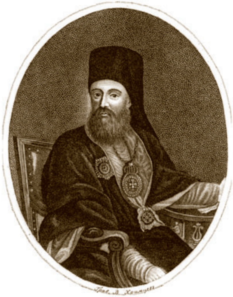
Архиепископ Никифор (Феотоки).