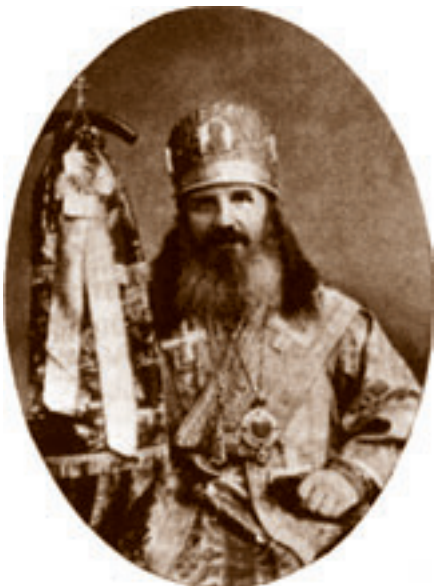
Епископ Вассиан (Веретенников).