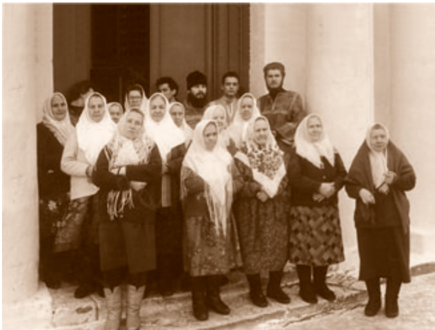
Первый клирос возрожденного храма Архангела Михаила.