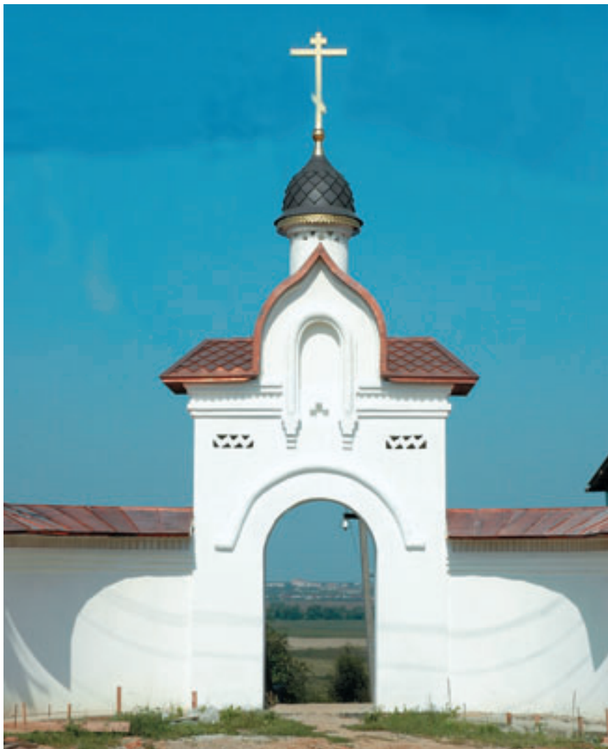
Северные врата на площади перед храмом Архангела Михаила.