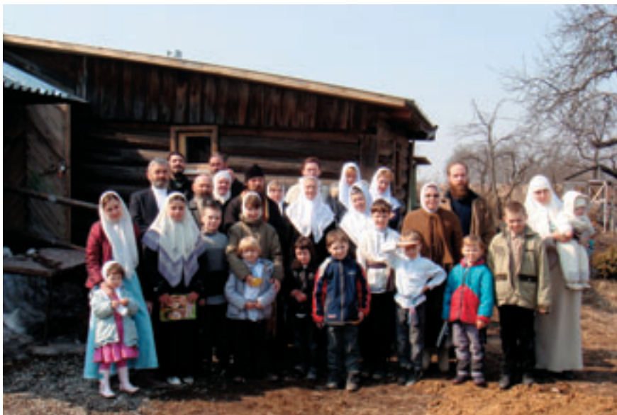
Учащиеся воскресной школы храма Архангела Михаила и их родители у гончарной мастерской.