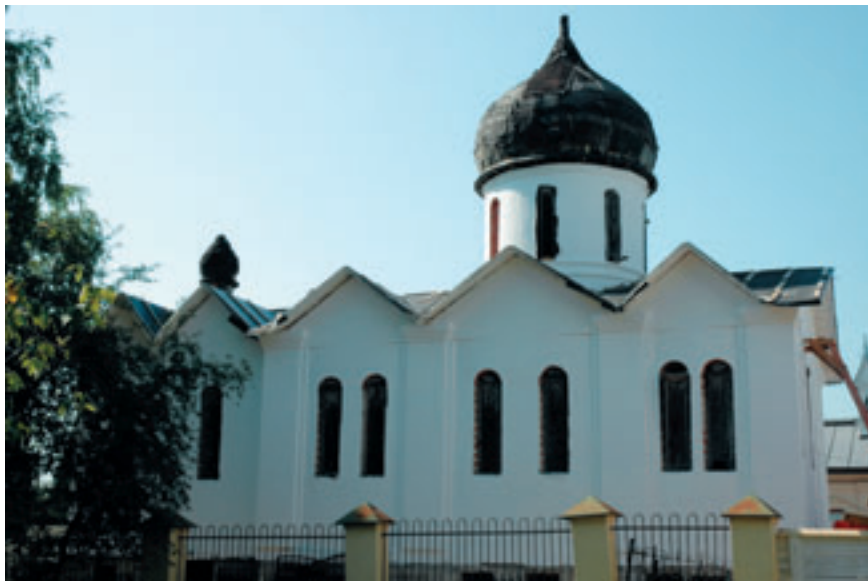
Храм преподобного Паисия Великого.