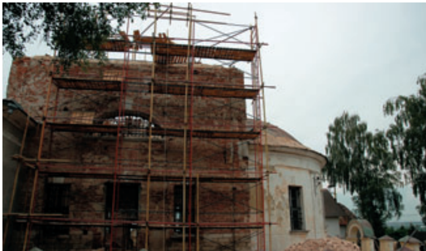
Начало реконструкции летнего храма.