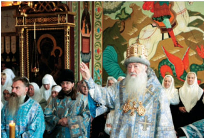
Архиерейское богослужение на праздник Рождества Пресвятой Богородицы возглавляет митрополит Крутицкий и Коломенский Ювеналий.