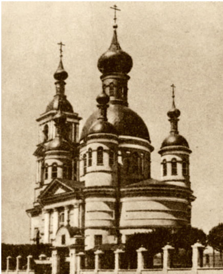
Троицкий единоверческий храм в Москве.