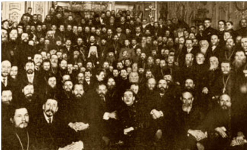
Первый Всероссийский единоверческий съезд в Санкт-Петербурге.