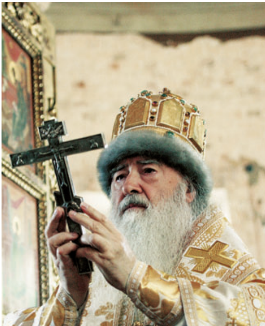
Митрополит Крутицкий и Коломенский Ювеналий в храме Архангела Михаила.