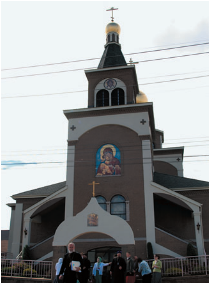
Храм Рождества Христова в городе Ири, штат Пенсильвания, США.