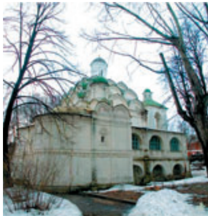
Храм Покрова Пресвятой Богородицы в Рубцове.