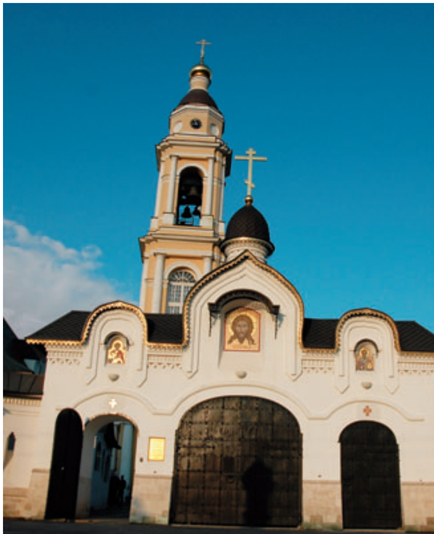
Святые врата и колокольня храма Архангела Михаила.