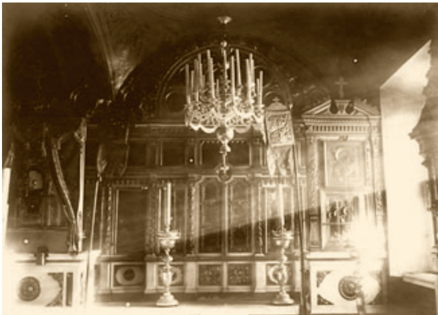
Никольский придел храма Архангела Михаила.