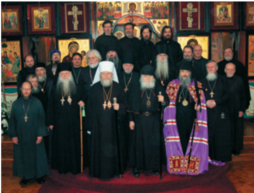
Священнослужители – участники конференции «Православие в XXI веке», прошедшей в храме Рождества Христова в Ири, под руководством митрополита Илариона Нью-Йоркского и Восточно-Американского.