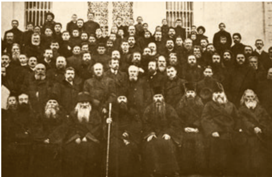
Московский епархиальный единоверческий съезд.