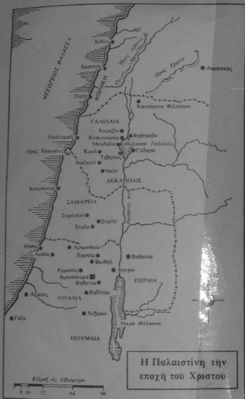
Η Παλαιστίνη τὴν ἐποχὴν τοῦ Χριστοῦ