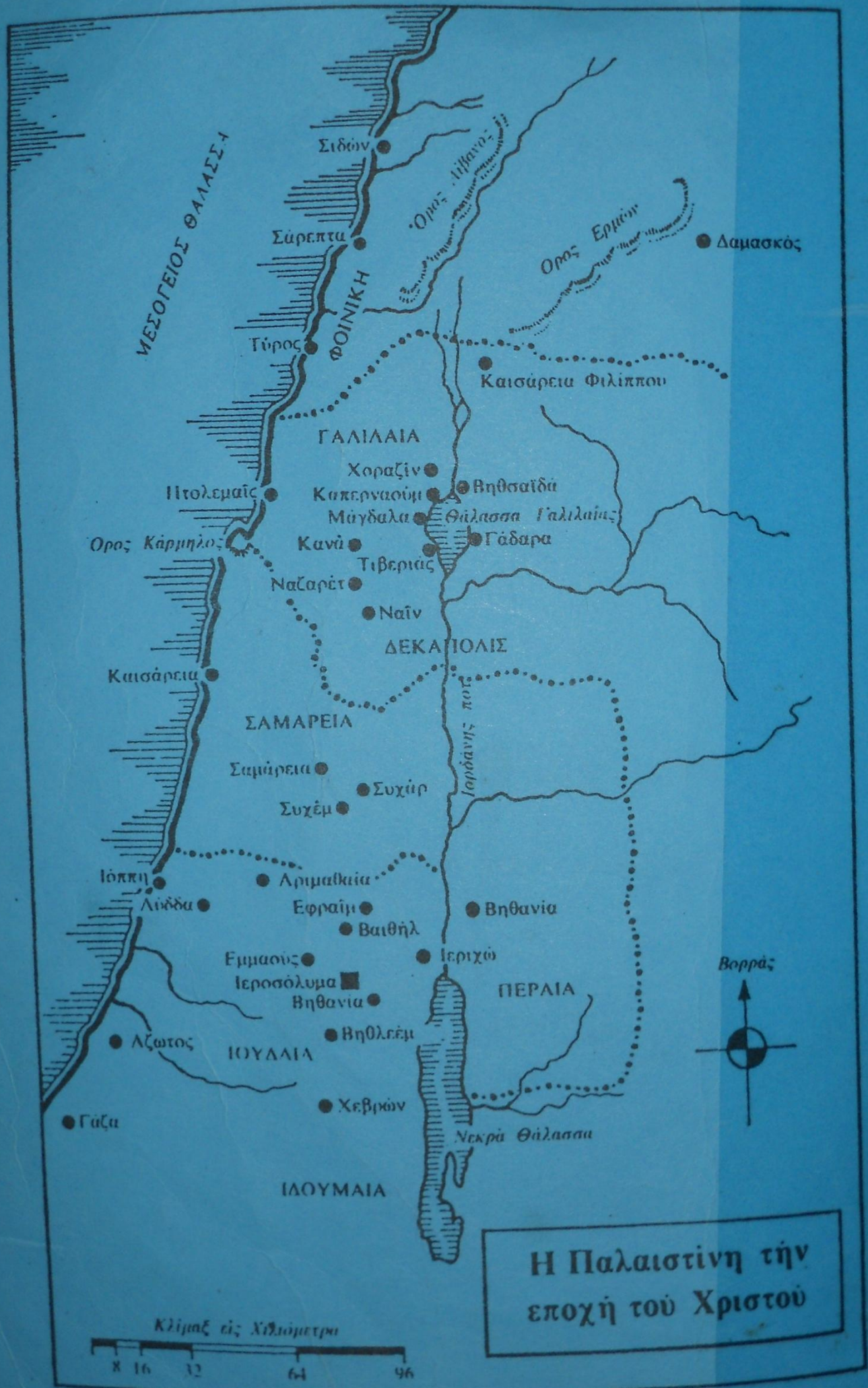
Η Παλαιστίνη τήν εποχή του Χριστού