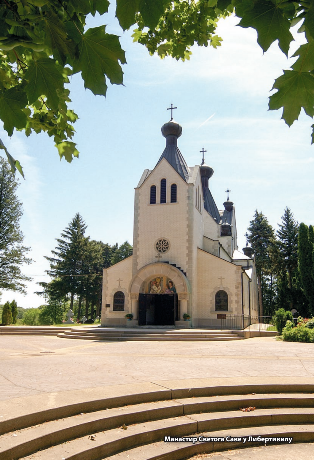
Манастир Светога Саве у Либертивилу