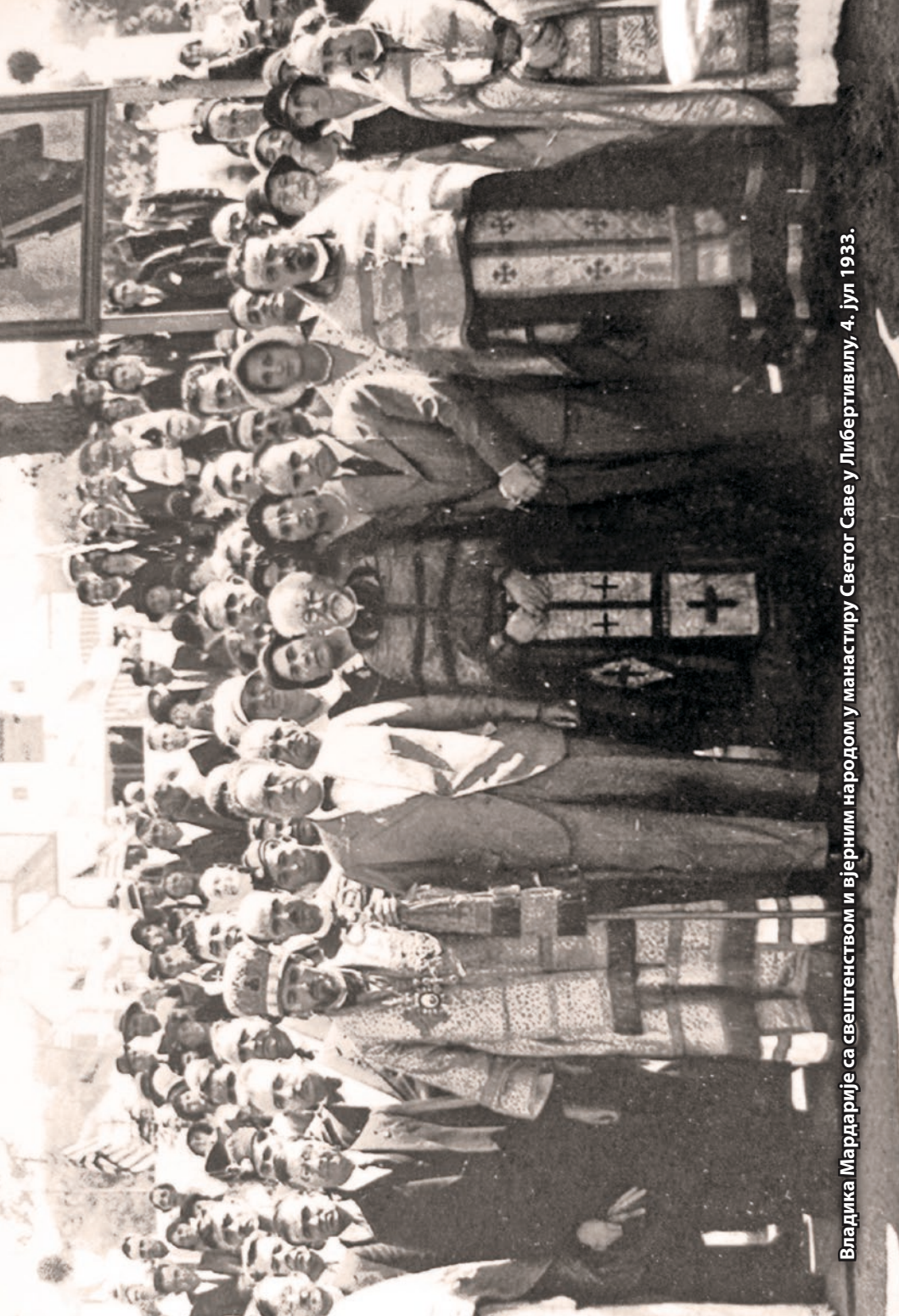
Владика Мардарије са свештенством и вјерним народом у манастиру Светог Саве у Либертивилу, 4. јул 1933.