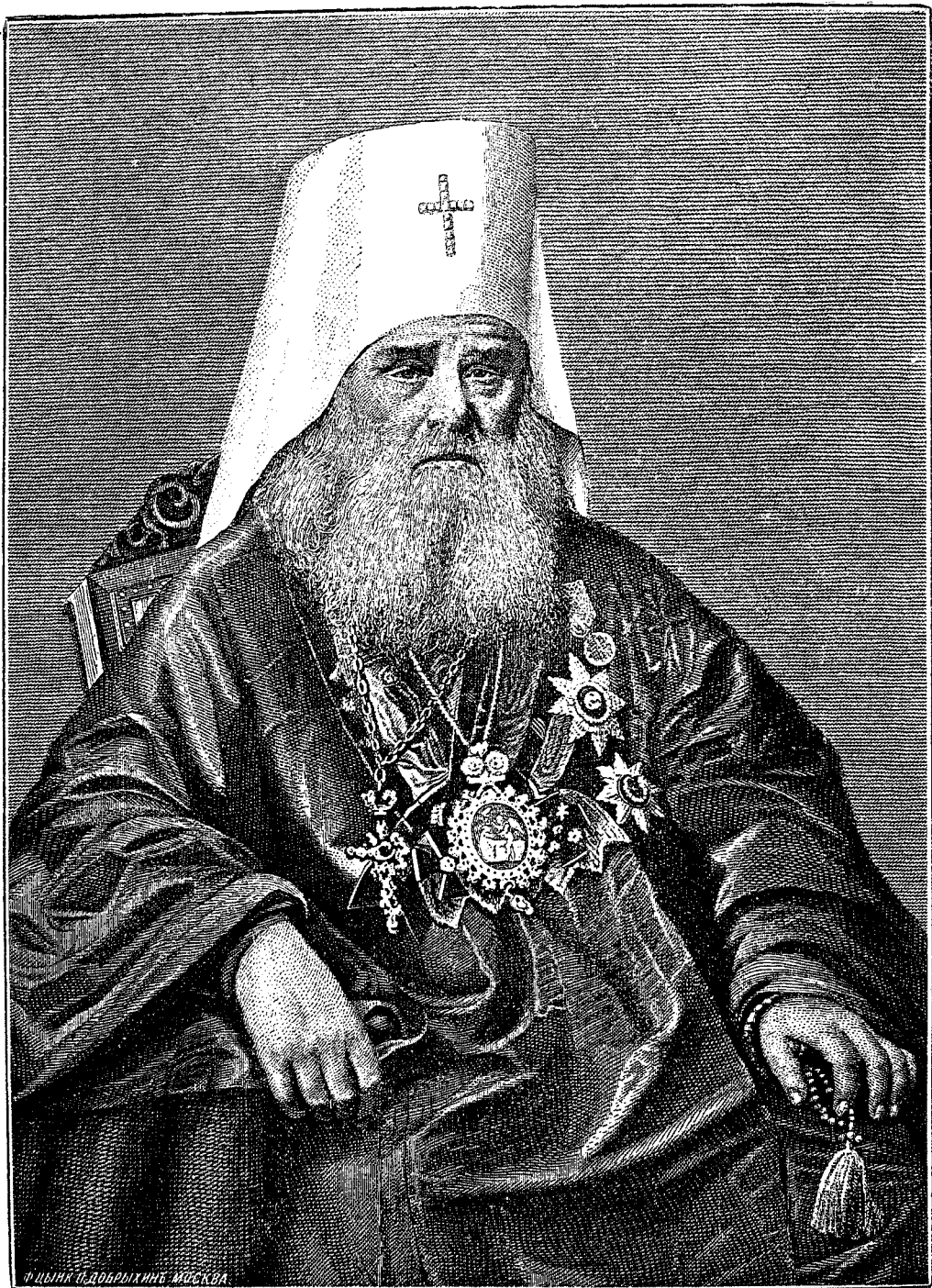
ИННОКЕНТІЙ МИТРОПОЛИТЪ МОСКОВСКІЙ И КОЛОМЕНСКІЙ, первый Предсѣдатель Православнаго Миссіонерскаго Общества [1870—1879 гг.].