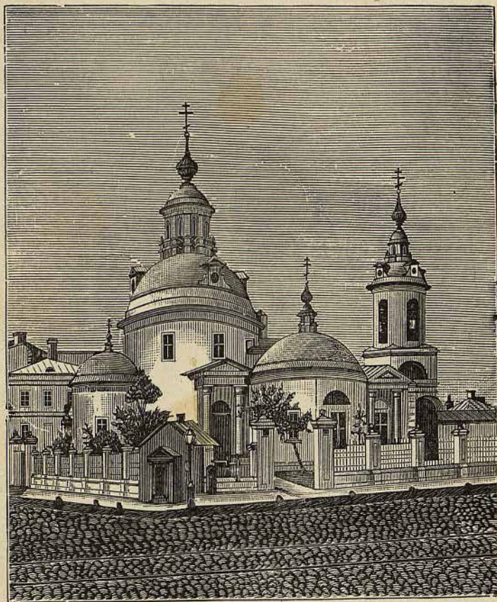
КОСМОДАМІАНСКАЯ, НА ПОКРОВКЪ, ЦЕРКОВЬ.