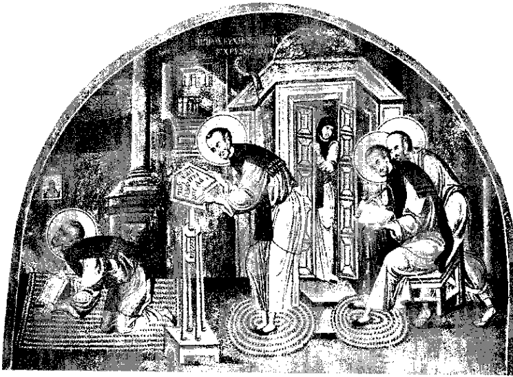
Св. Јован Златоуст и Св. Апостол Павле у виђењу Златоустовог ученика Прокла (фреска у Манастиру Хиландару, око 1800.г.)