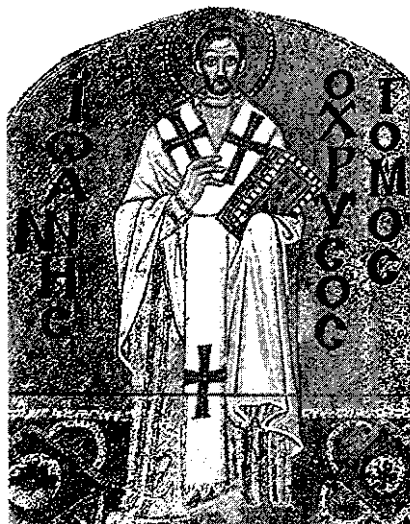
Свети Јован Златоуст (мозаик у Светој Софији у Цариграду, 9-10. век)

одаљује и младића и девојку. Јер, и то увелико доприноси целомудрености, пошто младиће мами похотљивост, а девојке жеља за украшавањем и кинђурењем. Све то дакле потиснимо. И тако ћемо моћи да угодимо Богу одгајајући такве подвижнике. Да бисмо и ми и деца могли задобити блага обећана онима који Га љубе, благодаћу и човекољубљем Господа нашега Исуса Христа, са Којим Оцу, заједно са Светим Духом, слава, власт, част, сада и увек и у векове векова. АМИН.