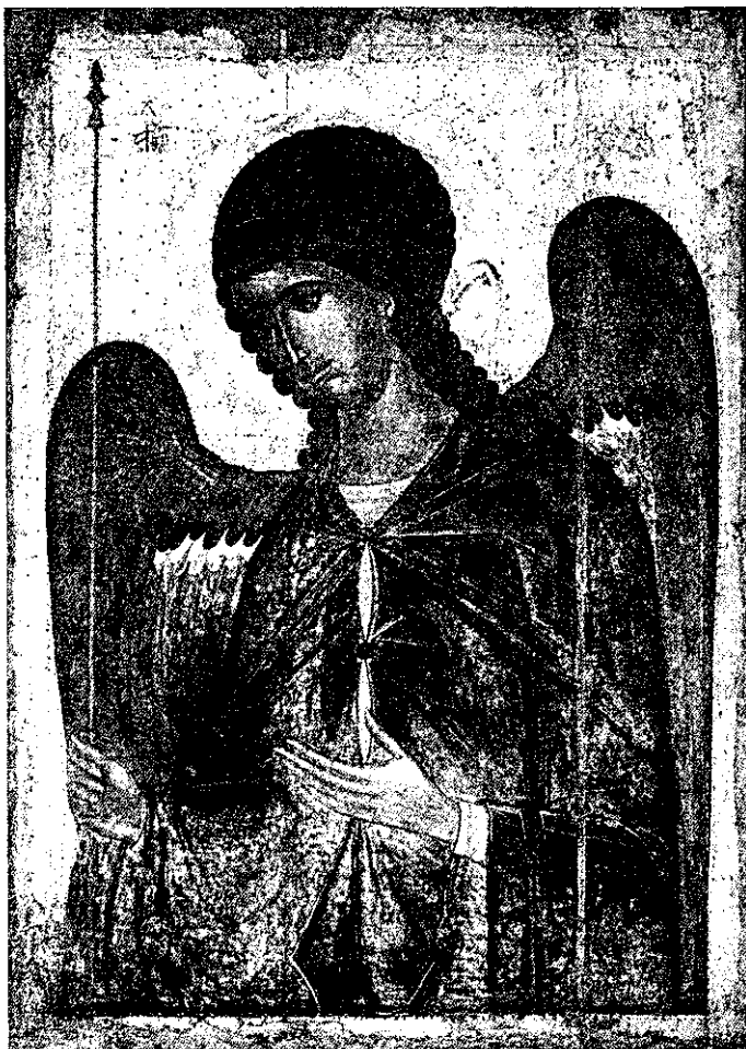
Архангел Гавриил. 1387—1395 гг. Икона Высоцкого чина. Москва, Государственная Третьяковская галерея