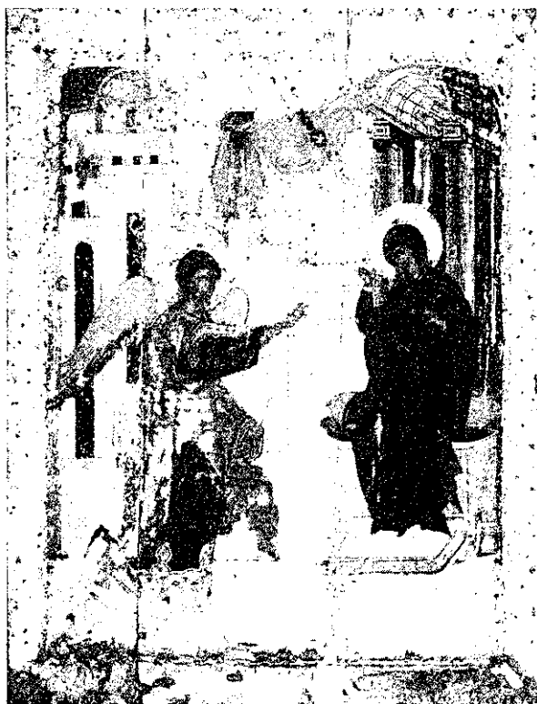
Благовещение. 1405 г. Икона Праздничного чина Благовещенский собор Московского Кремля

этого, лицедея икону Благовещения, нельзя встать лицом к лицу ни перед архангелом, ни перед Богородицей как бы по отдельности. Личностное обусловлено здесь взаимной обращенностью, особой динамикой события. Так, скажем, архангел Гавриил всегда совершает шаг . Он может быть более или менее выраженным, например, широким, чуть ли не размашистым, подчеркивающим неожиданность появления архангела, его «прилет»; может быть и сдержанным, как бы более чутким, осторожным и легким. Но шаг всегда есть, икона показывает действие вхождения Гавриила к Марии. Поднятая