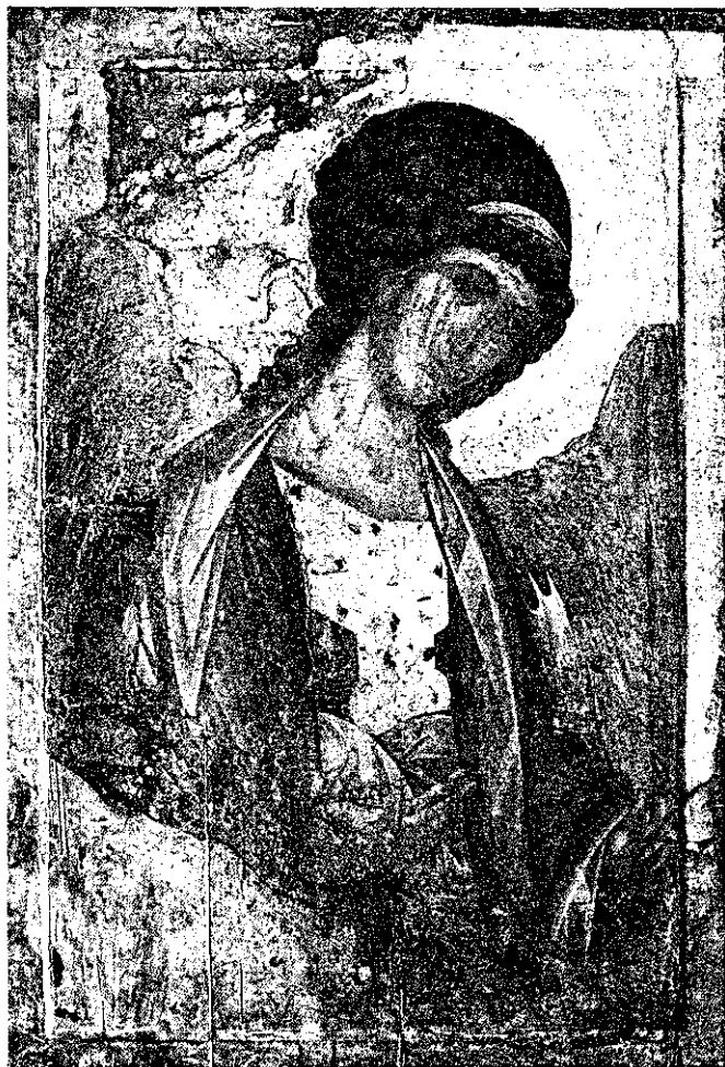
Андрей Рублёв. Архангел Михаил. 1410-е гг. Икона Звенигородского чина. Москва, Государственная Третьяковская галерея