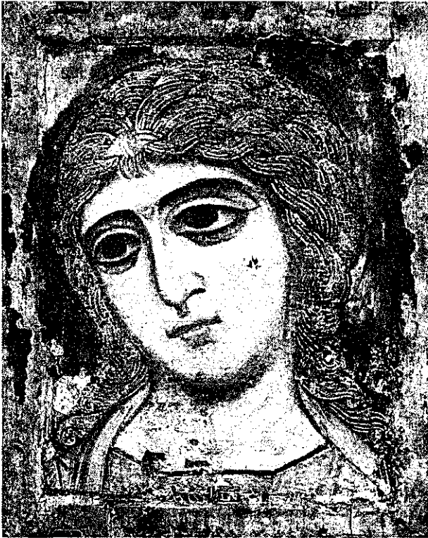
Ангел Златые власы. Новгородское письмо, вторая половина XII в. Санкт-Петербург, Государственный Русский музей

себе. Причем при всей общности крупного плана сразу надо констатировать существенное в этом пункте различие. Икона являет лицо, тогда как автопортрет Леонардо предлагает крупный план головы, и еще надо разобраться, что именно есть эта голова. Пока же подчеркнем, что если лик ангела предъявлен как таковой, бытийствует сам по себе, а крупный план лишь усиливает самобытие лица, дополнительно акцентирует равенство его самому себе, то образ, созданный Леонардо, неотрывен от своей поверхности. Он существует исключительно среди своего окружения. Повторимся,