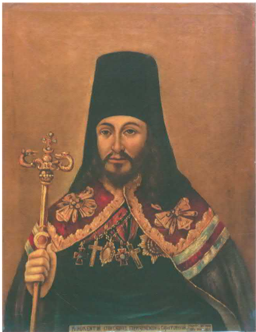
М. П. ПОСВЯЩЕНН. СВЯТЫЙ ПЕРВАШКОВЪ СЛАВНОМЪ