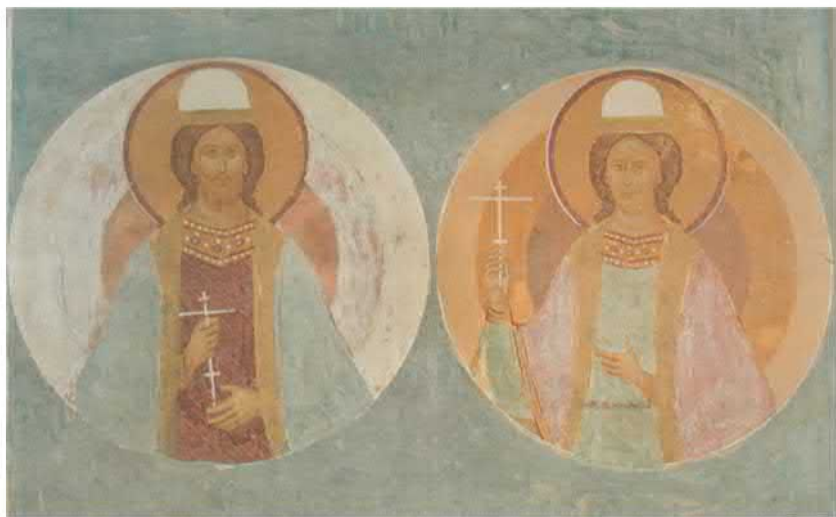
Благодарные князья Борис и Глеб. Фреска работы Дионисия. 1502. Ферапонтов монастырь