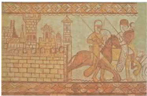
Рыцари-тамплиеры, возвращающиеся с битвы при Аль-Букайе в 1163 году. Фреска из часовни тамплиеров в Крессак-Сен-Жени (Пуату-Шаранта, Франция). XII в.