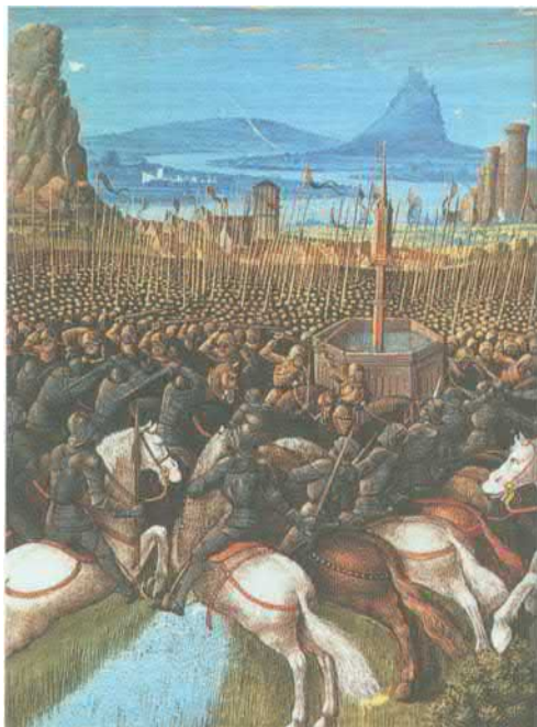
Битва при Хаттине. Миниатюра Себастьяна Мамеро. Около 1474. Французская национальная библиотека