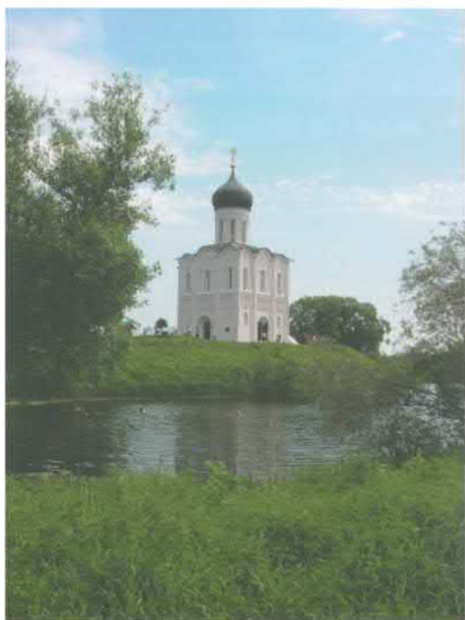
Храм Покрова на Нерли. XII в. Фото 2009 г.