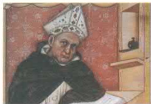
Альберт Великий. Фреска работы Томмазо да Модены. 1352. Тревизо, Италия