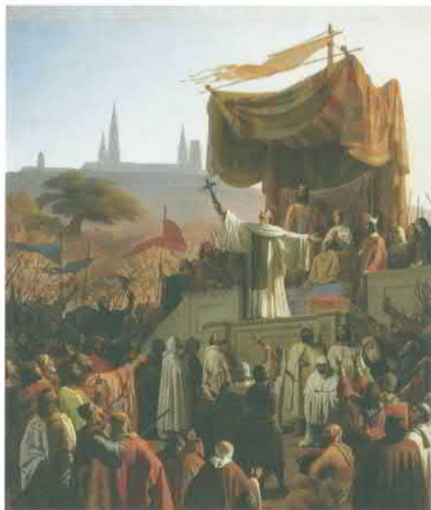
Бернард Клервоский призывает в Везле христианский мир к крестовому походу в 1146 году. Картина работы Эмиля Сигнола. Середина XIX в.