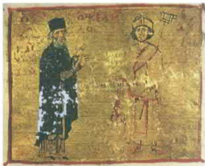
Михаил Пселл (слева) со своим учеником, императором Михаилом VII Дукой. Византийская миниатюра. XII–XIII вв. Афонский монастырь Пантократор