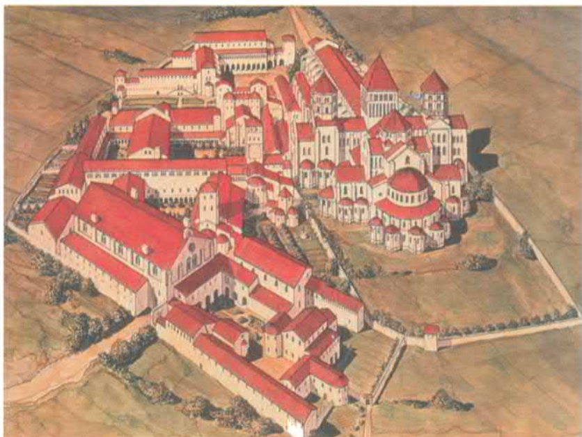
Аббатство Клуни в XII в. Реконструкция Жана-Клода Голвина