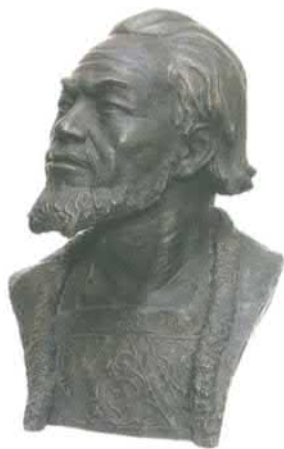
Благодарный князь Андрей Боголюбский. Реконструкция работы М.М. Герасимова, 1939