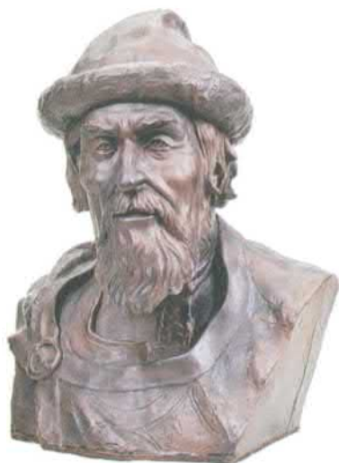
Благодарный князь Ярослав Мудрый. Реконструкция работы М.М. Герасимова. 1940