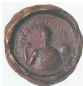
Императорская печать Оттона Великого. X в.