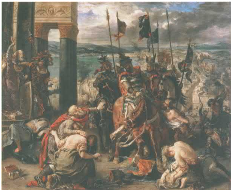
Взятие Константинополя крестоносцами. Картина работы Эжена Делакруа. 1840