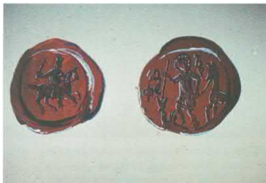
Печать благоверного князя Александра Невского. Середина XIII в.