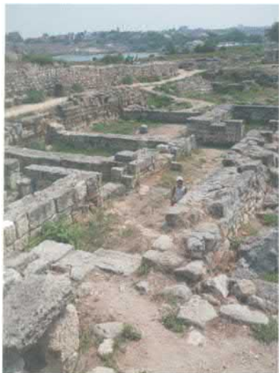
Остатки античного Херсонеса близ Севастополя. Фото 2016 г.