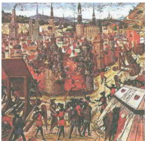
Взятие Иерусалима во время первого крестового похода в 1099 году. Миниатюра XIV–XV вв.