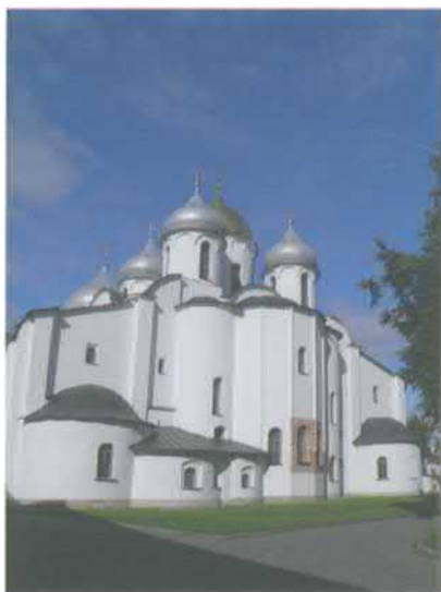
Софийский собор в Новгороде. XI в. Фото 2015 г.