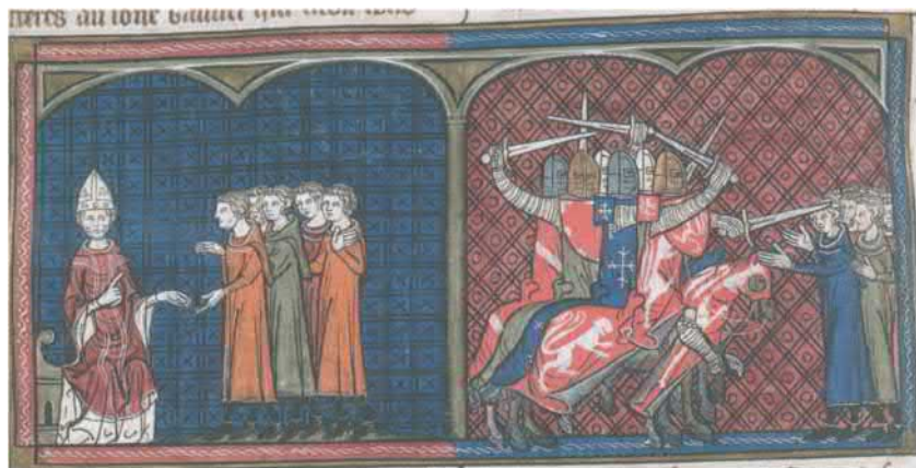
Папа Иннокентий III отлучает альбигойцев-катаров от Церкви (слева); Альбигойский крестовый поход (справа). Миниатюра середины XIV в. Британская библиотека