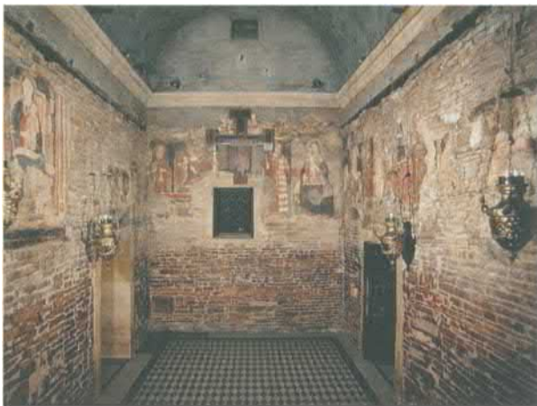
Дом Божией Матери («Святая хижина») в Лорето, Италия. Современное фото