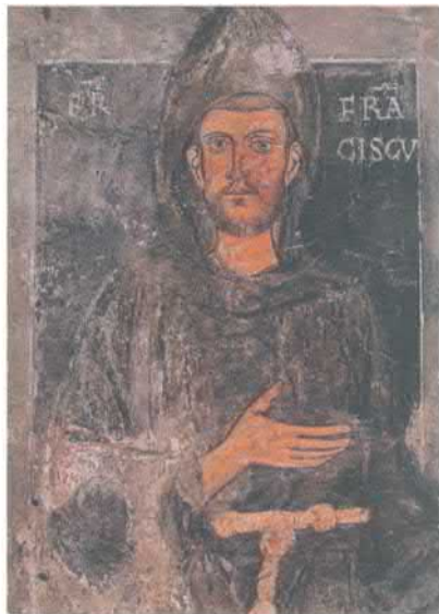
Франциск Ассизский. Прижизненное изображение на стене монастыря св. Бенедикта в Субиако, Италия. Начало XIII в.