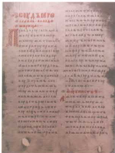
«Русская правда». Начало древнейшего известного списка – Синаодального списка Пространной редакции. Конец XIII в.