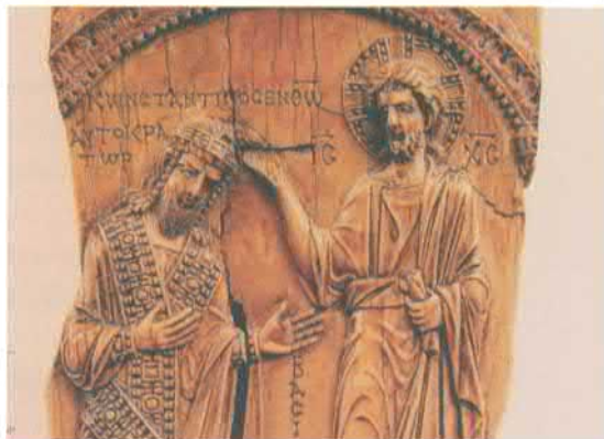
Христос благословляет императора Константина Багрянородного. Слоновая кость. Около 945. Государственный музей изобразительных искусств, Москва