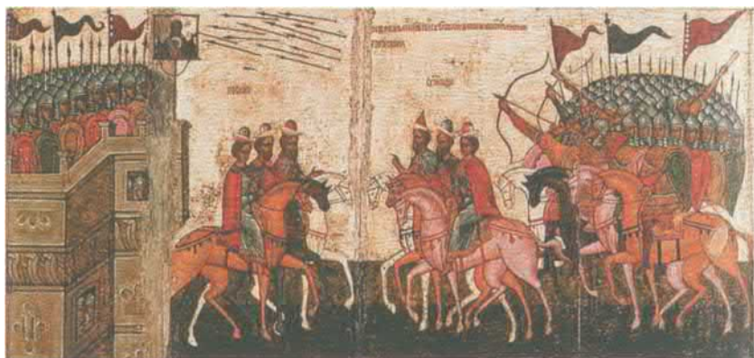
Чудо от иконы Знамение (Битва новгородцев с суздальцами). Фрагмент иконы. Новгород, середина XV в.