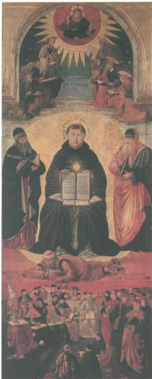
Триумф Фомы Аквинского. Работа Беночцо Гоццоли. 1471. Лувр, Париж