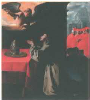
Молитва Бонавентуры об избрании нового папы. Картина работы Франсиско де Сурбарана. Середина XVII в. Дрезденская картинная галерея, Германия