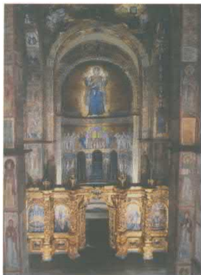
Софийский собор в Киеве. Интерьер. XI в. Современное фото