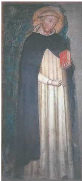
Доминик де Гусман Гарсес. Фреска в базилике св. Доминика в Болонье, Италия. XIV в.