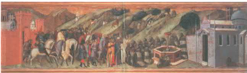
Альберт, католический патриарх Иерусалимский, вручает устав кармелитам. Фрагмент алтаря работы П. Лоренцетти. 1328–1329. Национальная пинакотекa в Сиене, Италия