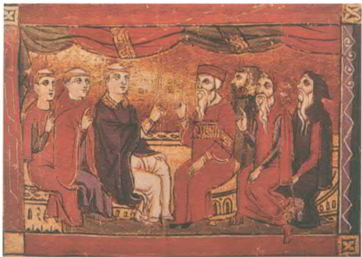
Дебаты между католиками (слева) и православными (справа). Миниатюра. Акра, около 1290