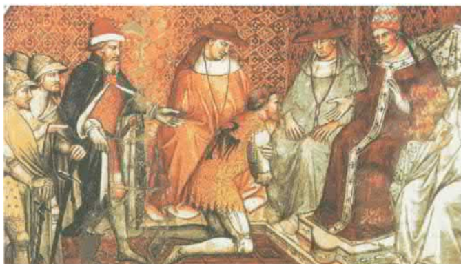
Император Фридрих Барбаросса подчиняется власти папы Александра III. Фреска работы Спинелло Аретино в Палаццо Публико, Сиена, Италия. Конец XIV в.