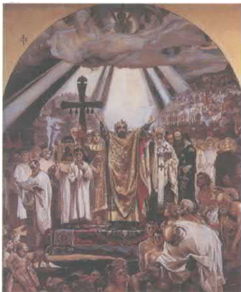
Крещение Руси. Картина работы В.М. Васнецова. 1890. Государственная Третьяковская галерея, Москва