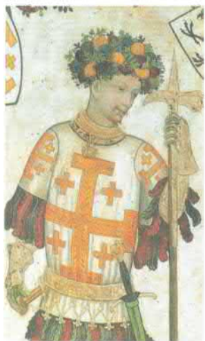
Готфрид Бульонский. Фреска работы Джакомо Жакерио. 1418–1430. Замок Манта близ Салуццо, Италия