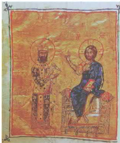
Император Алексей Комнин перед Христом. Миниатюра. XIII–XIV вв. Библиотека Афинского колледжа