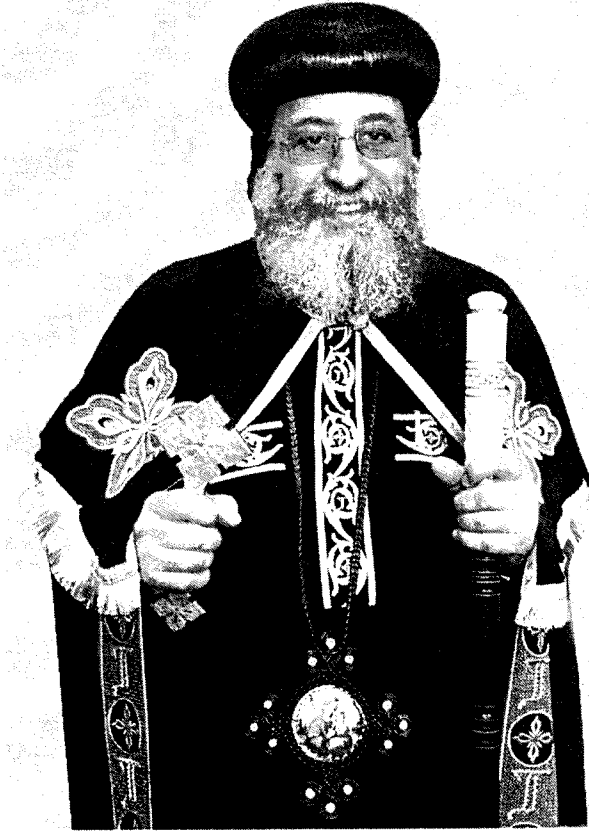
قداسة البابا تواضروس الثاني بابا الأسكندرية وبطريك الكرازة المرقسية