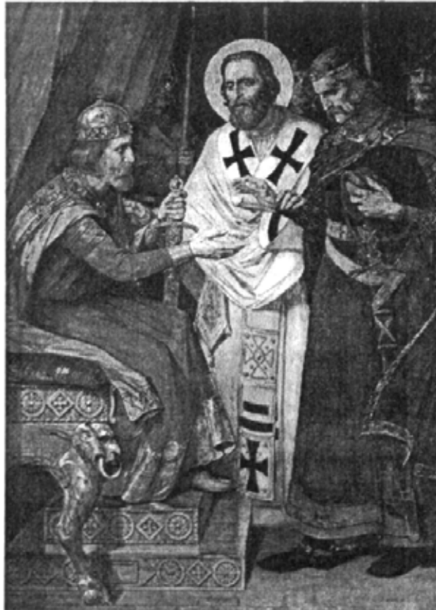
Свети САВА мири браћу (Саборна црква, С. Карловци)

другог човека. Ове моћи својих мисли, позитивних и негативних, човек најчешће није свестан. Неслоге у породици - свађе, болести и свакакве невоље, нарочито крупније које снађу неку породицу, последица су рђавих помисли њених чланова. Први и једини услов за промену рђаве породичне климе јесте промена мисли њених водећих чланова. Почните свесно да шаљете добре мисли, мисли љубави и добрих жеља ономе ко вас је мрзак, ко вас је увредио, ко вас не воли. На сопственом примеру моћи ћете тада да се уверите у снагу добрих мисли.