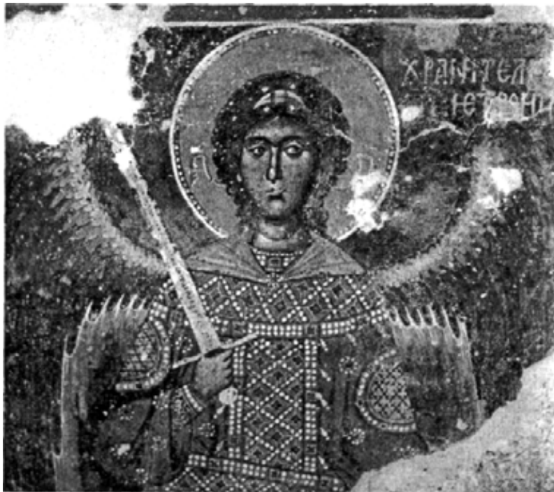
Анђео чувар Свете Тројице, Манастир Сопоћани

Зато то бива и због тога је хајка на православне и на Православље. Православне, смирене и кротке душе моле се непрекидно Богу да Бог спречава зло. И због тога се Православље гони а ми нисмо свесни тога.