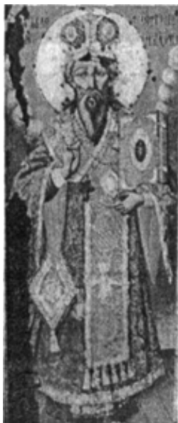
Свети ВАСИЛИЈЕ Острошки

Господ је господар свих умова, Он је силан и моћан да преобрази сваког појединца да дође себи, јер ако га Господ не пробуди ко ће, кад га ни мајка ни отац нису упутили на исправан пут. Ни у школи није могао научити ништа, сем да се у животу једе и пије. Ја сам још као дете много мислио о свету. Још као дете обраћао сам пажњу на мисли, а видим сад да сам остарио и још нисам достигао онај степен који сам достигао као дете, јер Господ Сам просвећује децу. Још сам био мали, ни у школу нисам пошао, а приметио сам да моје мисли лутају док се друга деца играју. То није добро, кажем ја себи, морам да будем ту, присутан мислима, усредсређен само на тај посао, али узалуд, мисли су ми стално бежале. Као дете сам размишљао о свему томе, па сад видим, остарио сам, а још нисам достигао тај степен. Због тога сам желео да видим како су се осећали Свети Оци који су још за време живота од цркве прослављени, а касније и на небу.