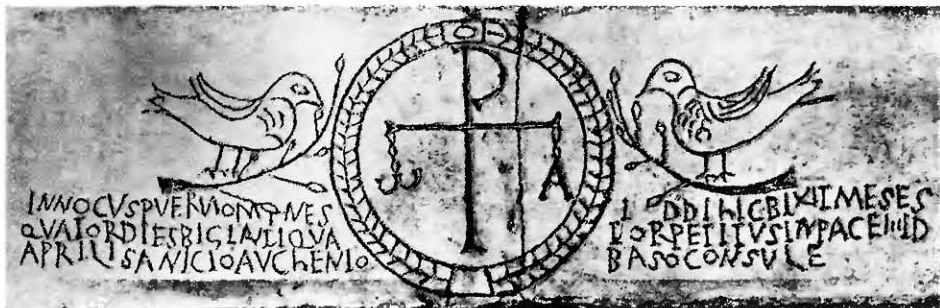
Изображение Α и Ω на гробнице св. Коммодиллы. 409 г. (Музей Ватикана)

Изречение «Я есмь Альфа и Омега», приводимое в Апокалипсисе, отцы и учителя Церкви толкуют применительно к Логосу и Иисусу Христу. В «Строматах» Климент Александрийский сравнивает Логос с кругом, в к-ром Его силы как бы «свиваются», а Его начало и Его конец (Α и Ω) сливаются, не оставляя между собой «ни расстояния, ни интервала» (PG. 9. Col. 1365). В «Педагоге» он размышляет о духовной пище, называемой ап. Павлом «молоком», замечая, что «под образом молока иносказательно говорится о Логосе» как «об альфе и омеге, о начале и о конце», потому что Ипо-