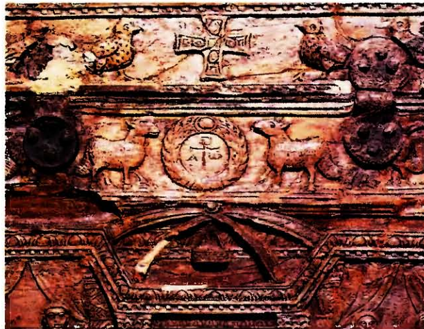
Аворий Саматерского ларца. Ок. 430 г. (Археологический музей, Венеция). Фрагмент

обрядов, где Апокалипсис включен в систему лекционарных чтений. В литургических рукописях кельт. обряда сохранился причастен: «Alpha et Omega ipse, / Christus Dominus, / venit venturus / iudicare homines» (лат.— Альфа и Омега, Христос Господь, грядет Грядущий судить людей — Lodi . P. 1102). Употребление выражения «А. и О.» в песнопении, сопровождающем Причащение, возможно, связано с тем, что в рисунок печатей просфор в древности могли вноситься буквы А и Ω (см. Galavaris . P. 75). Галаварис полагает, что появление в чине проскомидии визант. обряда Богородичной и девятичинной просфор идет от более древнего обычая вырезания букв А и Ω из агничной просфоры (по мнению ученого, часть, вырезавшаяся по контурам буквы А, соответствует части, изымаемой из Богородичной просфоры — Galavaris . P. 100–101). Выражение «А. и О.» использовал в своих литургических