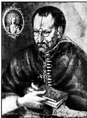
Альфонсо Мария ди Лигуори. 1768 г. (Коллегия Редemptористов, Пагани)

АЛЬФОНСО МАРИЯ ДИ ЛИГУОРИ [итал. Alphonso Maria di Liguori] (27.09.1696, Маранелла, близ Неаполя — 1.08.1787, Почера-Инферноре), св. католич. Церкви (пам. католич. 1 и 2 авг.), итал. свящ., католич. богослов. В 16 лет стал доктором гражданского и церковного