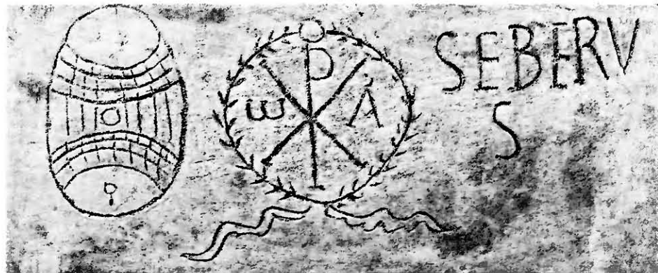
Изображение Α и Ω на погребальной плите Сибири. IV в. (Музей Ватикана)

Смысл этого имени Божия, к-рое использовано в Апокалипсисе и у ранних христ. писателей (Пруденций, Тертуллиан), очевиден из «описательных» имен, сопровождающих наименование Α. и Ω.: «Который есть и был и грядет» (Откр 1. 8), «Нача-