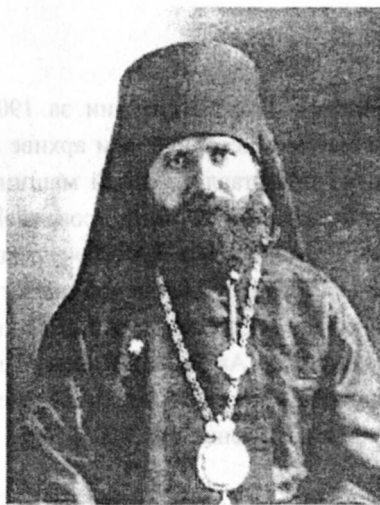
Святитель Тихон – епископ Алеутский и Североамериканский. Фотография выполнена после его прибытия в Америку