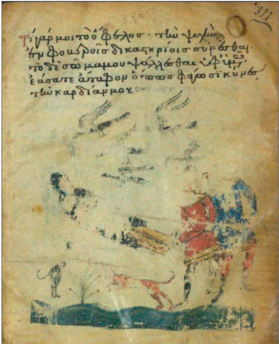
Илл. 1. Lesb295: 337, миниатюра с изображением канона “на исход души”, третий тропарь 6-й песни.