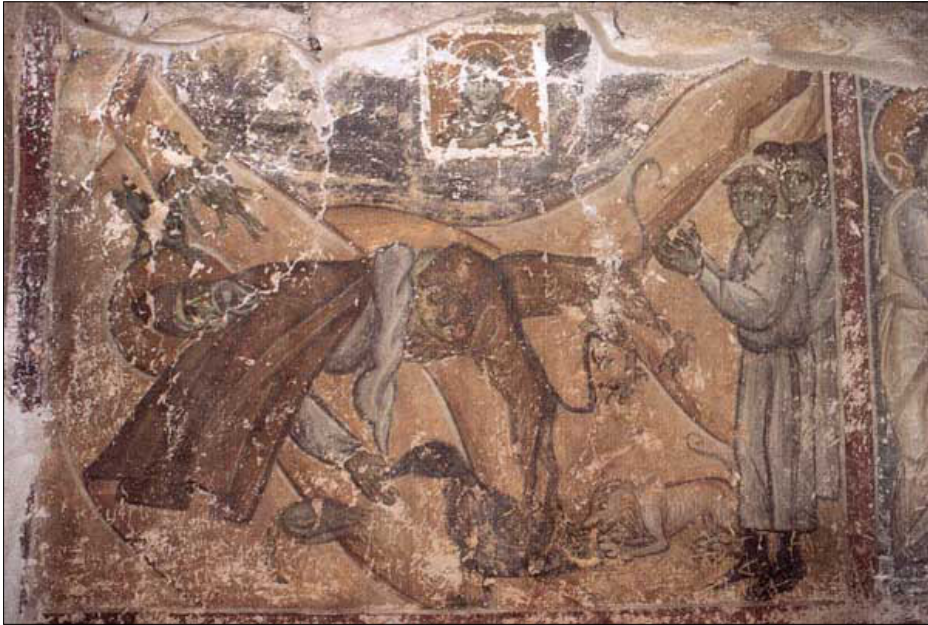
Илл. 2. Хиландар, башня св. Георгия, фреска с изображением канона “на исход души”, четвертый тропарь 6-й песни.