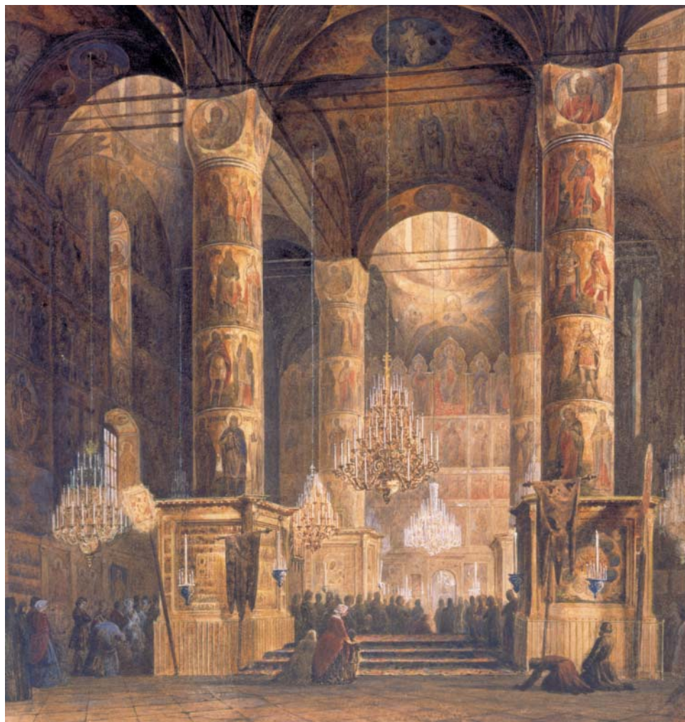
А. Х. Кольб (1829—1887). Интерьер Большого Успенского собора. Акварель