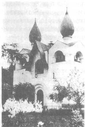
Марфо- Мариинская Обитель Милосердия

В наше время мало тех, кто спасается подвигами прежних святых: редки великие постники, те, кто проводят ночи в бдении, носят вериги, спят на земле, творят непрестанную молитву... Но жалеть, сострадать, Милловать страждущих – что проще, естественнее, привлекательнее для христианской души. Милосердие – это, безусловно, – самый легкий и прямой путь ко спасению.