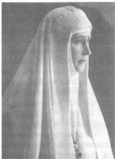
Великая Княгиня Елизавета Федоровна

цать часов ночи, после дневных трудов, вставала на молитву, потом обходила Свою больницу. Кому-нибудь из больных плохо – оставалась рядом, ухаживала до утра, всю Себя каждому отдавала... Умирили все – только на Ее руках. И Псалтирь по усопшим ночи напролет читала одна. Как-то картошку перебирать, сестры заспорили, никому не хочется, – Матушка молча оделась и пошла Сама. Тогда уж за Ней все побежали.