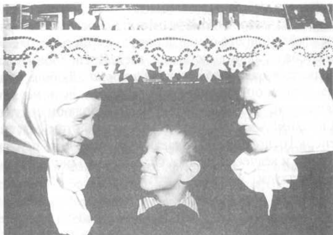
Матушка Надежда и матушка Любовь с крестником

моя, и еще. Это – самое дорогое, самое счастье. Тут враг и действует, конечно, строит козни, тут борьба должна быть.