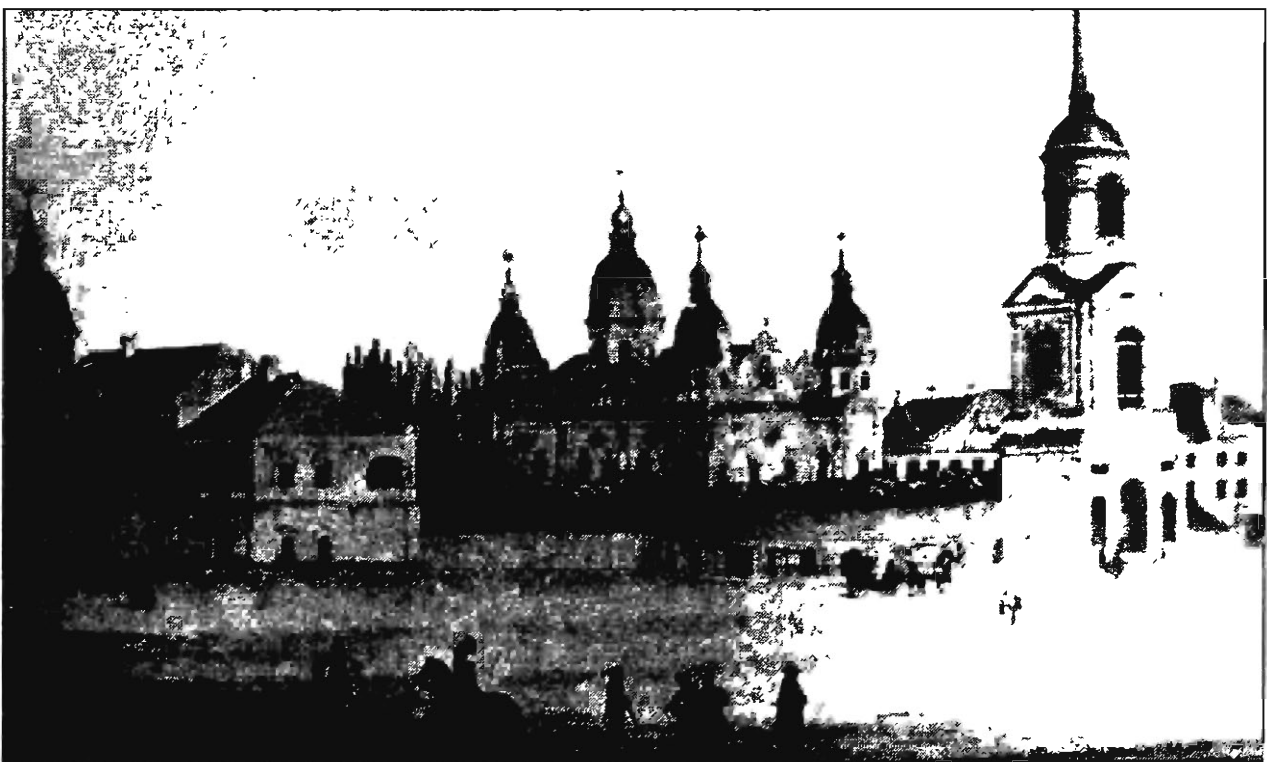
Богоявленский монастырь и здание Киевской Духовной академии