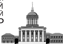
Российский Православный Университет