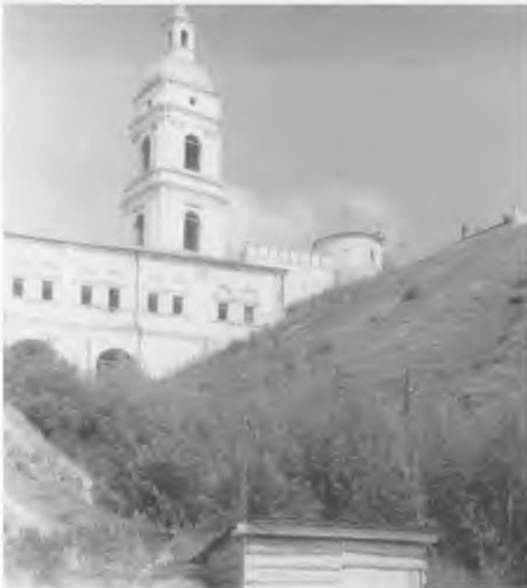
Тобольск. Колокольня кафедрального собора и «Рентерея» (в момент съемки — областной архив); ворота и спуск в город