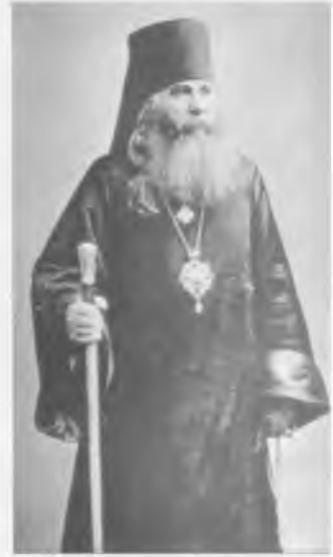
Священномученик архиепископ Василий (Богоявленский)