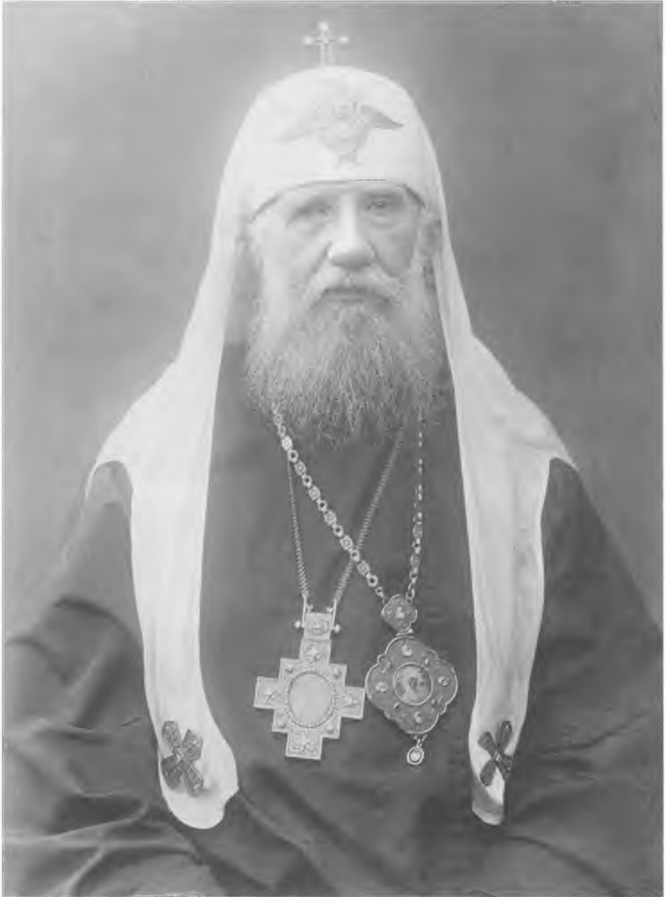
Святейший Патриарх Тихон