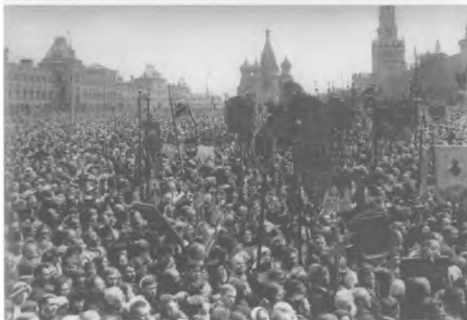
Крестный ход и молебствие у Никольских ворот Кремля 9 (22) мая 1918 г.

Из книги «Православная Москва в 1917—1921 годах»