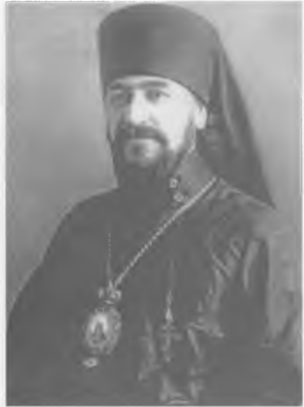
Епископ Нестор (Анисимов) ЦИА ПСТГУ