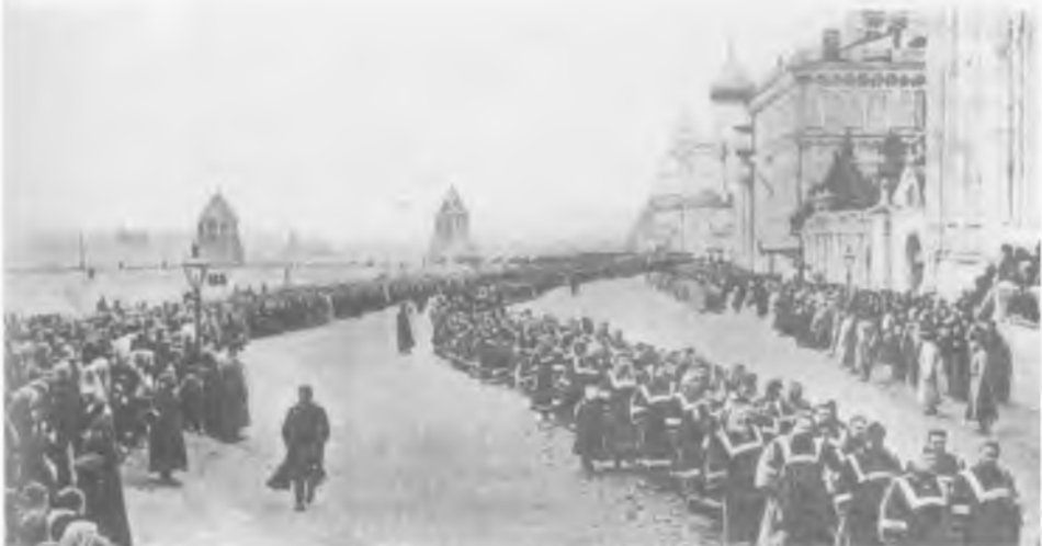
Крестный ход в Кремле во время интронизации Патриарха Тихона 21.11(4.12).1917

Из книги «Православная Москва в 1917—1921 годах»