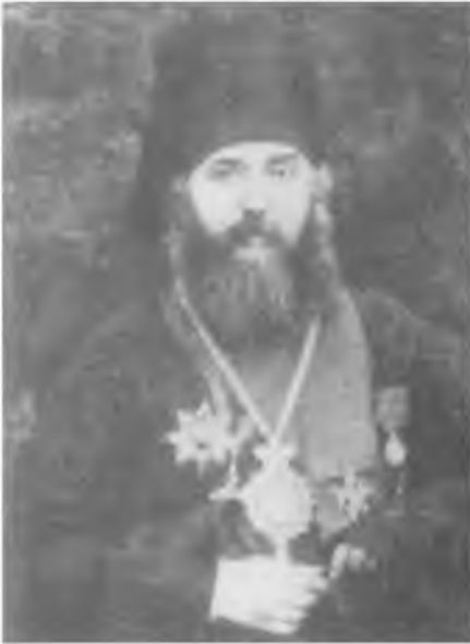
Архиепископ Димитрий (Абашидзе)