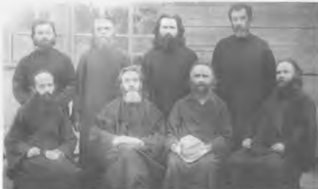
Православные иерархи и клирики в Среднеазиатской ссылке (Ашхабад)