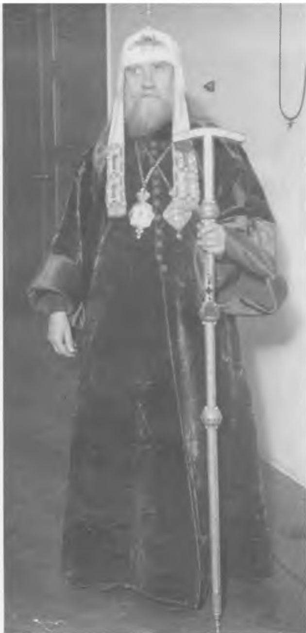
Святейший Патриарх Тихон Первый (или один из первых) фотоснимков в сане Патриарха. Москва, Епархиальный дом в Лиховом переулке