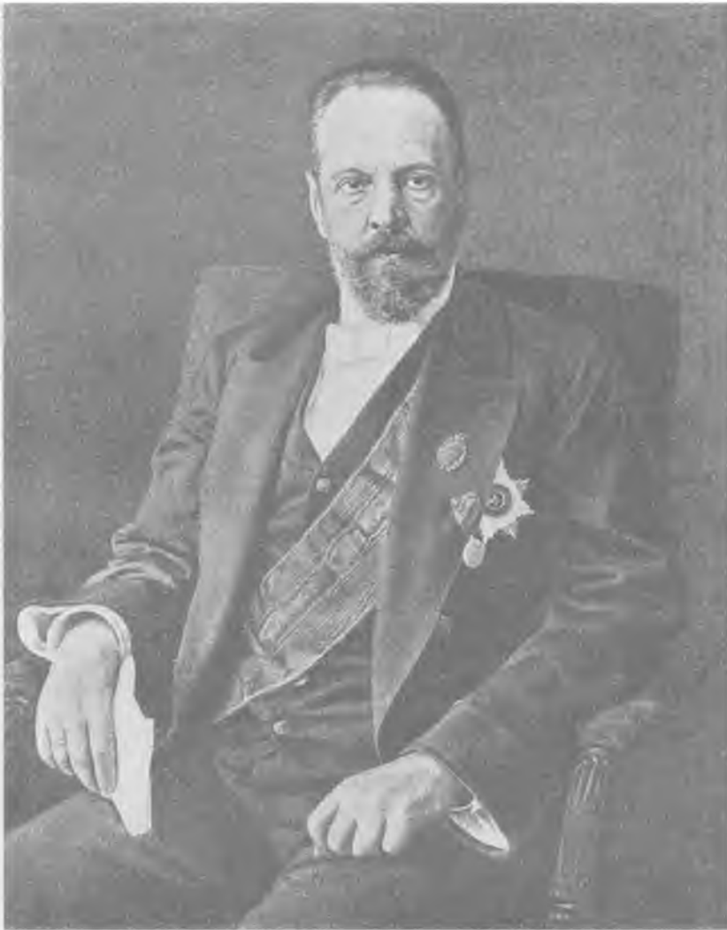
Сергей Юльевич Витте (1849–1915)

Инициатор (совместно с митрополитом Антонием Вадковским) вопроса о реформе Русской Церкви и восстановления в ней Патриаршества. Премьер-министр и граф (после Портсмутского договора 1905 г.). Автор манифеста 17 октября 1905 г. Своей политикой, направленной к созданию некоторого компромисса между монархией и либеральной буржуазией, вызвал недоверие царя и придворных кругов, вследствие чего весной 1906 г. получил отставку и тем закончил свою политическую карьеру