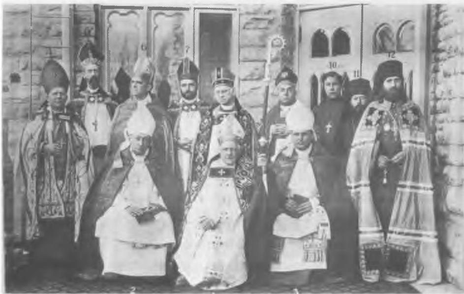
Группа епископальных епископов, участвовавших в посвящении Фондюлакского викария и православные русские гости

Под цифрами на снимке указаны: 1. Епископ г. Фонд-дю-Лак Чарлз Чепмен Графтон. 2. Епископ г. Милуоки Айзек Ли Николсон. 3. Епископ-коадьютор г. Чикаго Чарлз Палмерстон Андерсон. 4. Епископ польских старокатоликов в США А. Козловский. 5. Епископ г. Маркетт Дж. Мотт Вильямс. 6. Епископ-коадьютор г. Фонд-дю-Лак Реджинальд Хебер Уэллер. 7. Епископ штата Индиана Джозеф Маршалл Фрэнсис. 8. Епископ г. Чикаго Уильям Е. Мак-Ларен. 9. Епископ-коадьютор штата Небраска Артур Вильямс. 10. Сщмч. протоиерей Иоанн Кочуров. 11. Архимандрит-миссионер о. Севастиан (Дабович), капеллан при русском епископе. 12. Епископ Алеутский и Северо-Американский Тихон