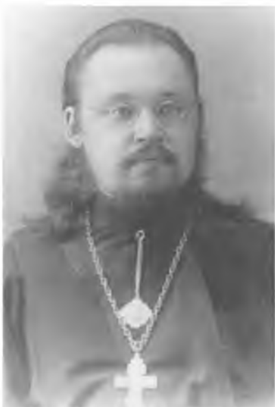
Священномученик протоиерей Илия Четверухин ЦИА ПСТГУ