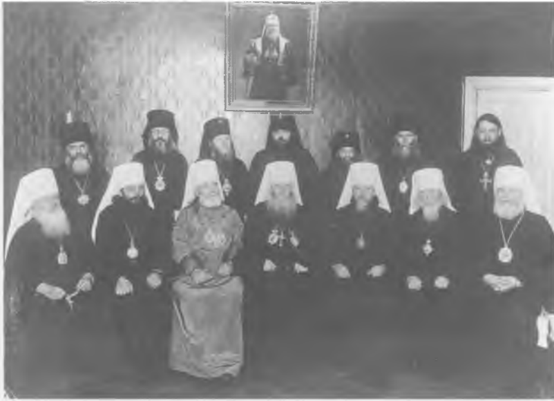
Митрополит Арсений (Стадницкий) в группе членов Синода при Заместителе Патриаршего Престола в начале 1930-х годов

1-й ряд слева направо: митрополиты: Павел (Борисовский), Анатолий (Грисюк), Арсений (Стадницкий), Сергей (Страгородский), Алексей (Симанский), Серафим (Александров), Константин (Дьяков).