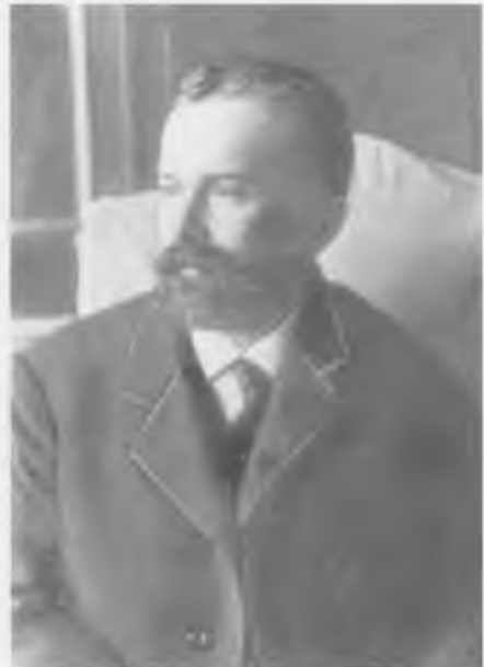
Князь Евгений Николаевич Трубецкой