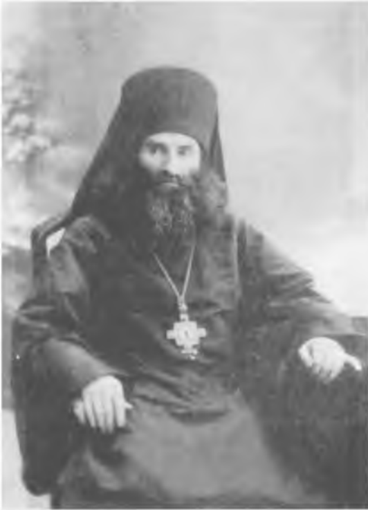
Священномученик архиепископ Андроник (Никольский) ЦИА ПСТГУ