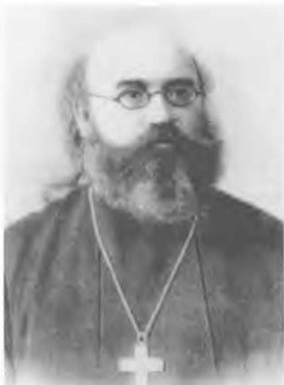
Священномученик протоирей Иоанн Восторгов