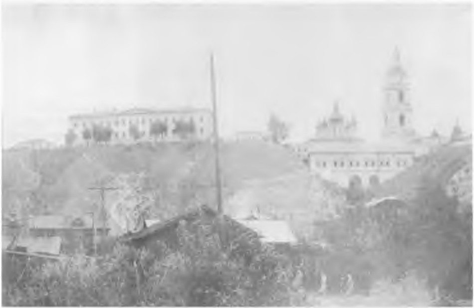
Общий вид Тобольского Кремля. Справа кафедральный Софийско-Успенский собор, в котором 2(15).08.1918 г. совершено отпевание тела епископа Гермогена (Долганева). Слева, на возвышенности — бывший дворец генерал-губернатора