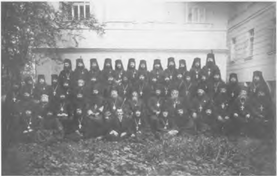
Архиепископ Тихон среди участников съезда ученого монашества в Свято-Троицкой Сергиевой Лавре. Июль 1917 г.