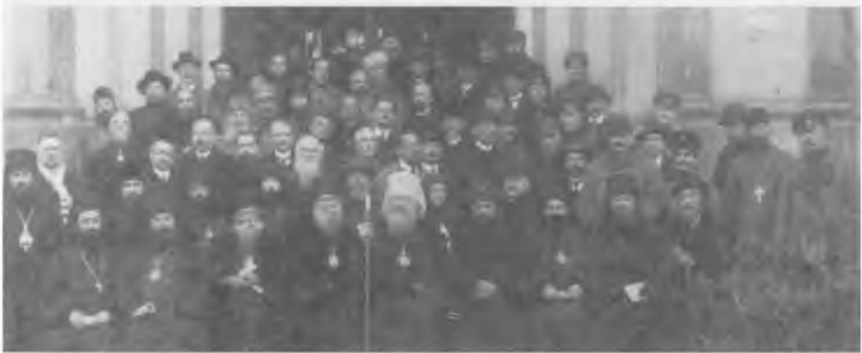
Снимок участников церковного Собора в Сремских Карловцах в 1921 г.