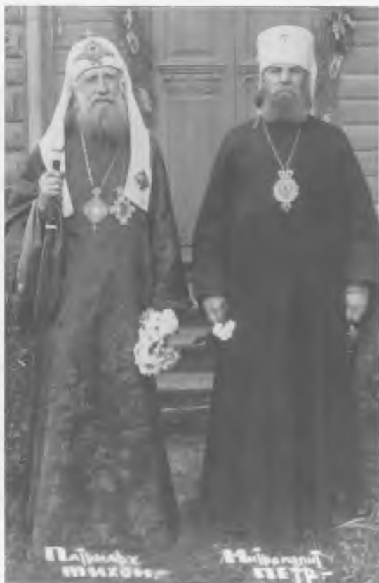
Патриарх Тихон и митрополит Петр Полянский