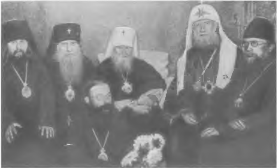
Патриарх Тихон в Николе-Угрешском монастыре Слева направо: епископ Серпуховской Арсений (Жадановский), архиепископ Бийский Иннокентий (Соколов), святитель Макарий (Невский), Патриарх Тихон, священномученик архиепископ Николай (Добронравов), с цветами сидит архиепископ Феодор (Поздеевский)