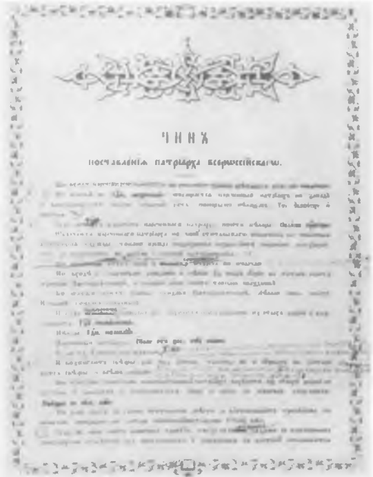
Черновик разработки чина поставления на Патриарший Престол Патриарха Тихона

Член Священного Собора 1917—1918 гг. Председатель комиссии, выработавшей чин интронизации Патриарха Всероссийского ЦИА ПСТГУ