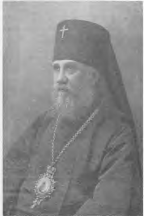
Архиепископ Тихон с 21 июня 1917 г. Московский и Коломенский