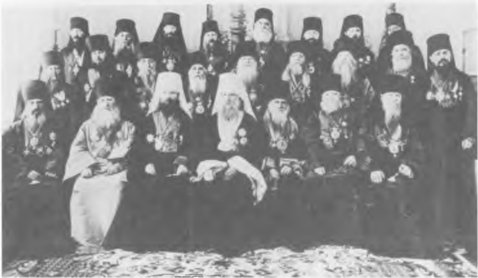
Собор архипастырей в г. Киеве в 1899 г. по случаю пятидесятилетия священнослужения митрополита Киевского Иннокентия

Третий слева в первом ряду митрополит Московский и Коломенский Владимир (Богоявленский), рядом митрополит Иннокентий (Руднев)