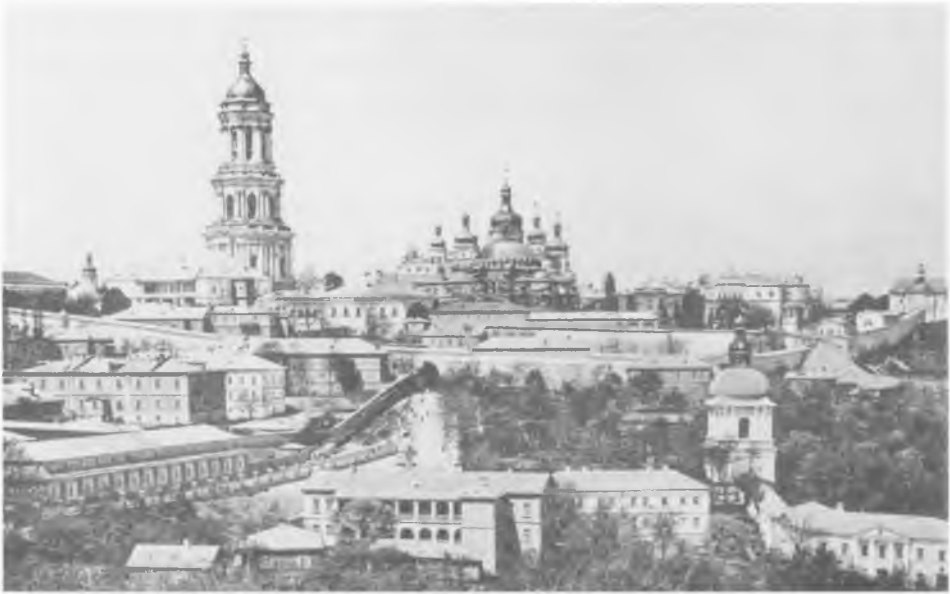
Киево-Печерская Успенская Лавра