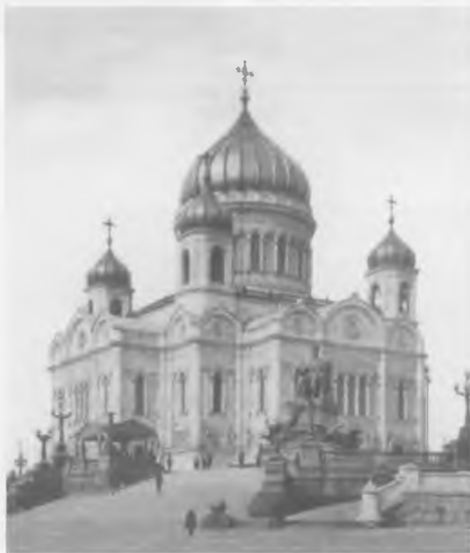
Храм Христа Спасителя – место избрания на Патриарший Престол митрополита Тихона