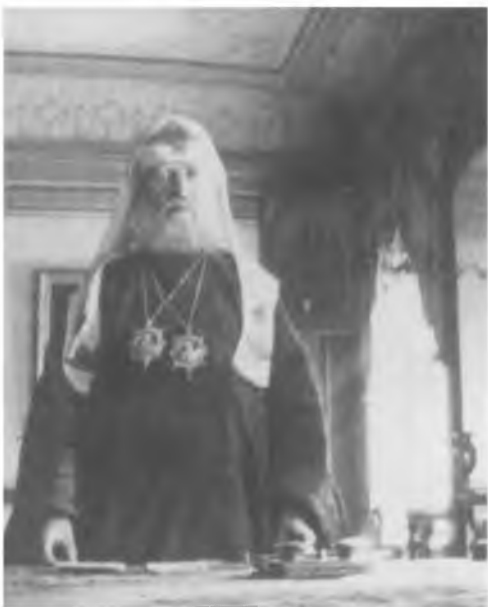
Патриарх Тихон на Троицком подворье