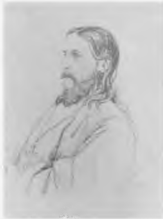
Священномученик архимандрит Матфей (Померанцев)