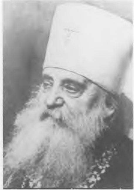
Кандидаты на Патриарший Престол митрополиты Арсений (Стадницкий) и Антоний (Храповицкий)