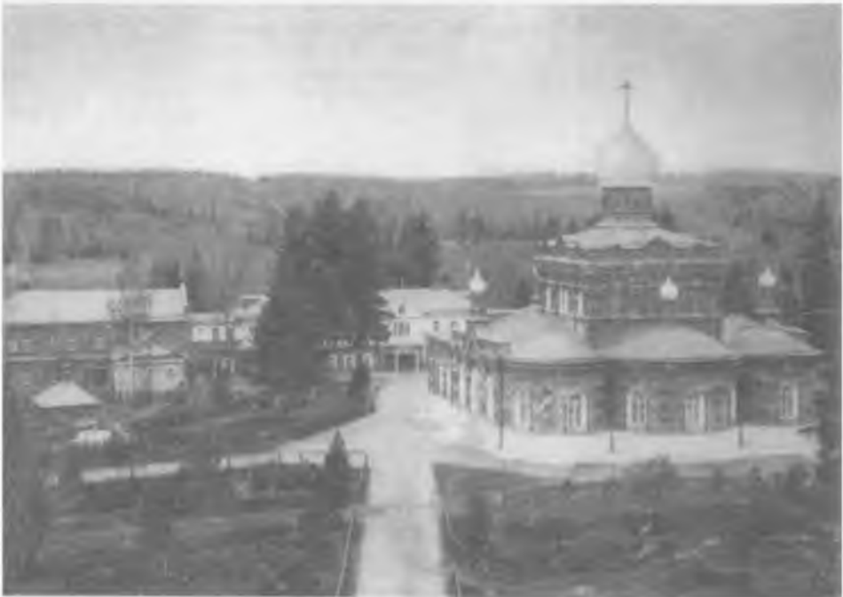
Смоленская Зосимова пустынь