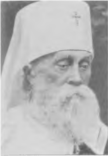
Митрополит Анастасий (Грибановский)

Член Священного Собора 1917—1918 гг. Председатель комиссии, выработавшей чин интронизации Патриарха Всероссийского ЦИА ПСТГУ