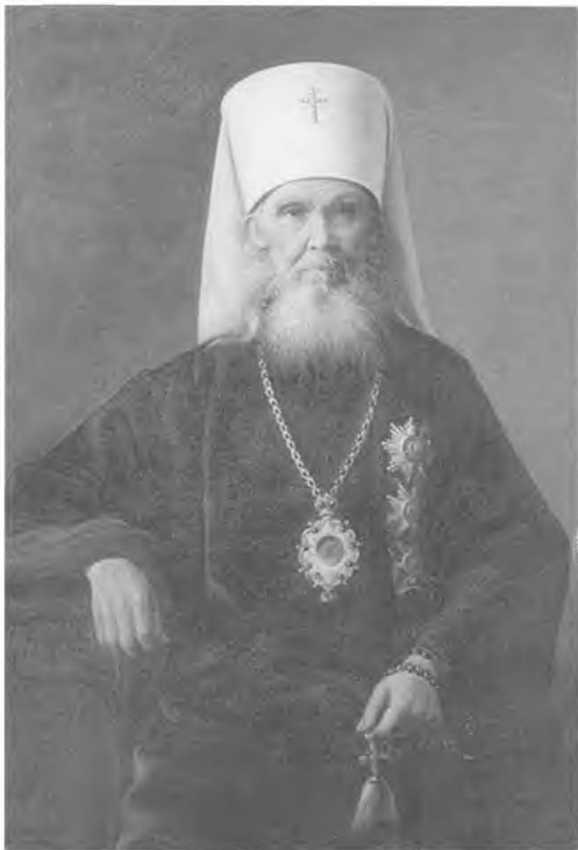
Святитель Макарий (Невский)