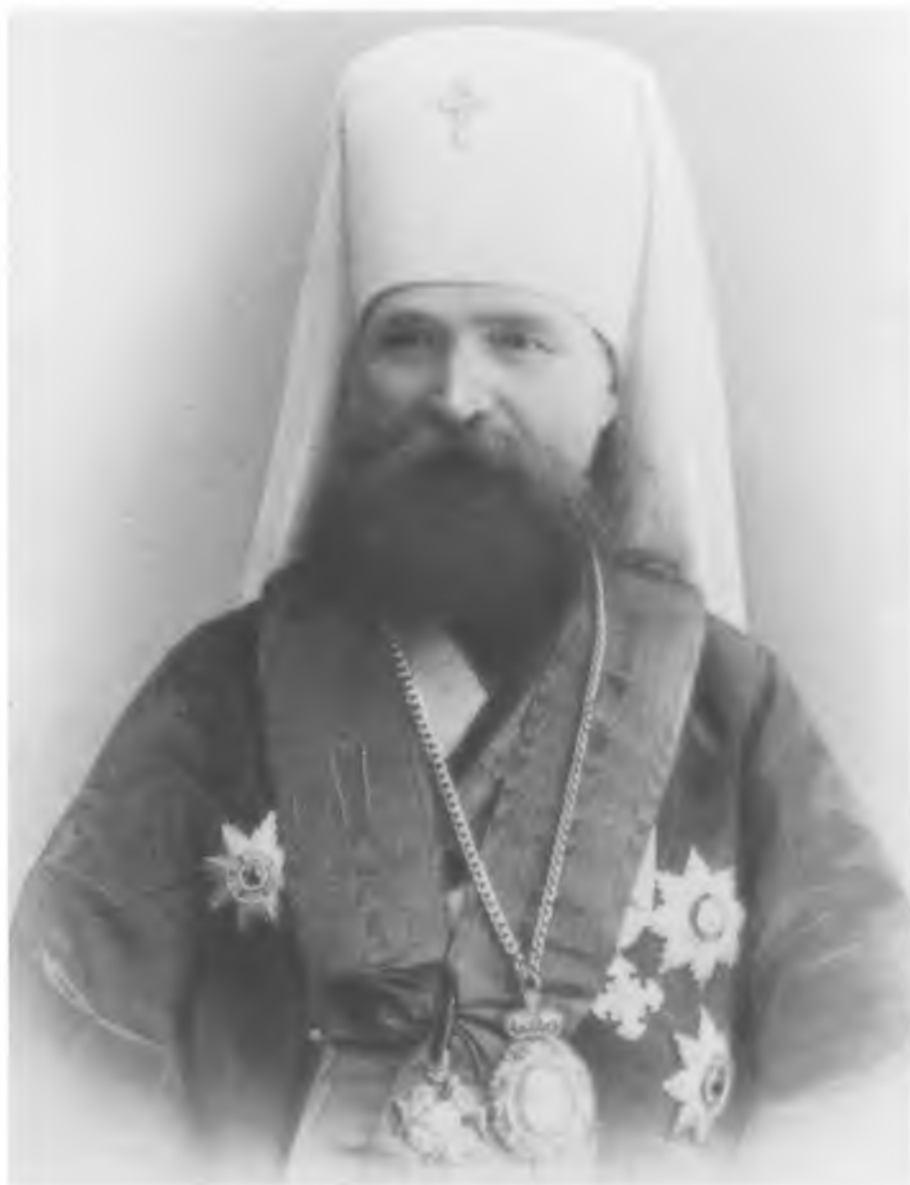
Священномученик митрополит Киевский и Галицкий Владимир (Богоявленский)