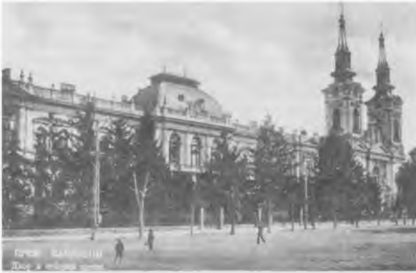
Сремские Карловцы. Патриарший дворец и соборная церковь