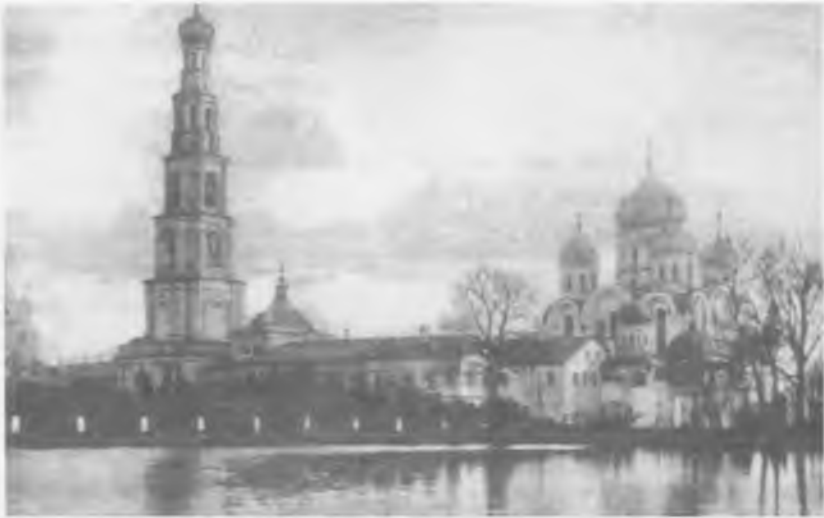
Николо-Угрешский монастырь — место ссылки митрополита Макария ЦИА ПСТГУ