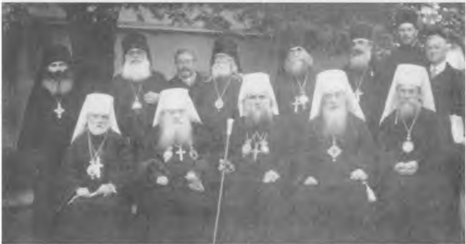
Иерархи Русской Зарубежной Церкви. 1930-е годы

В центре — Патриарх Сербский Варнава (Росич), слева от него митрополит Антоний (Храповицкий), справа — митрополит Евлогий (Георгиевский)