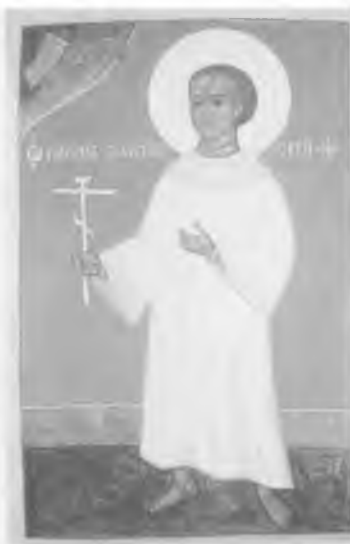
Икона мученика Гавриила Белостокского