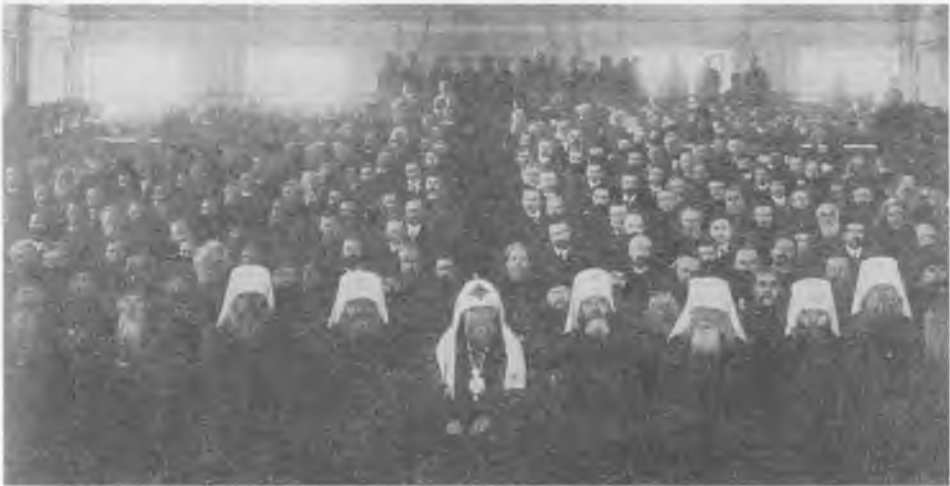
Члены Священного Собора Православной Российской Церкви 1917–1918 гг.