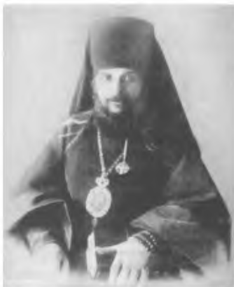
Священномученик Гермоген (Долганев), епископ Тобольский