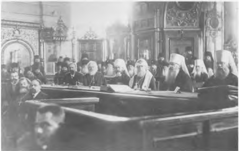
Святейший Патриарх Тихон возглавляет заседания Всероссийского Поместного Собора в Соборной палате Московского епархиального дома