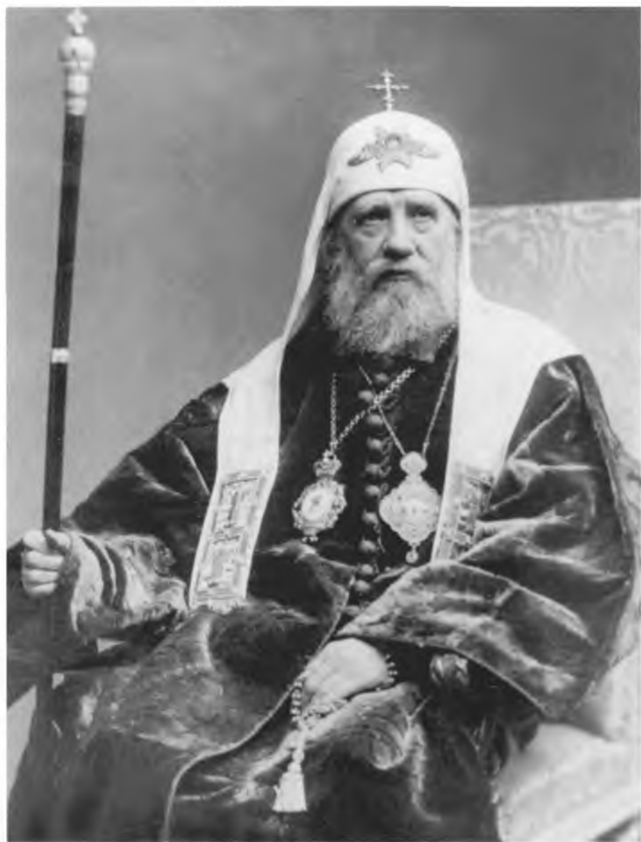
Metropolitan Nannigyl Munkon in Paris.