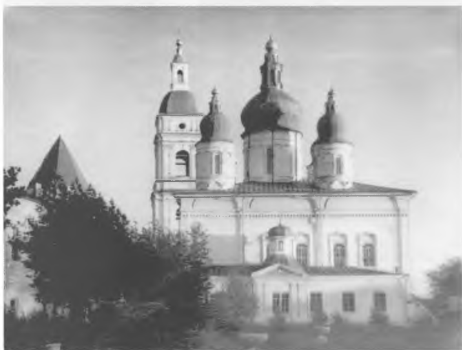
Успенско-Софийский кафедральный собор в Кремле г. Тобольска