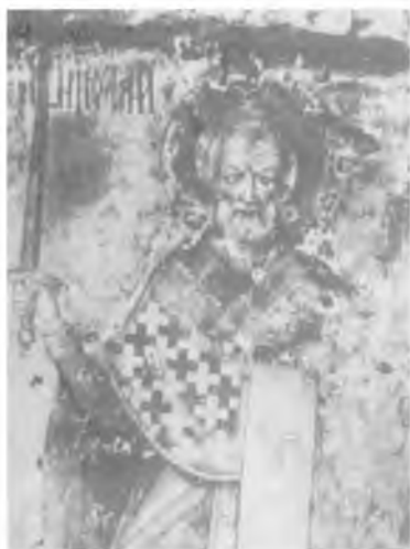
Образ св. Николая с Никольской башни Кремля, поврежденный во время обстрела в 1917 г.