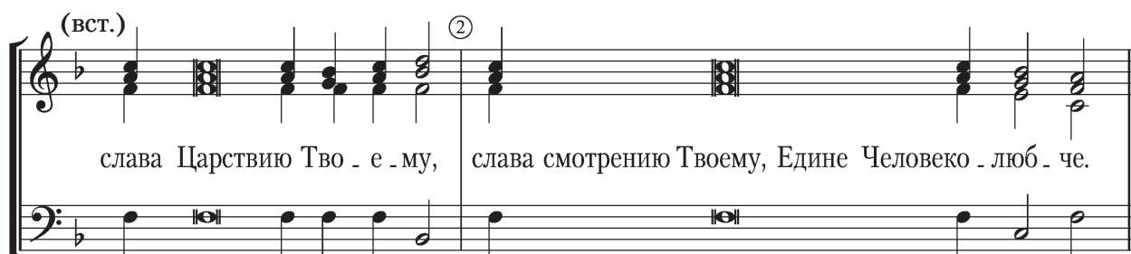
Схема чередования строк: ||:1, (встав.), 2:||