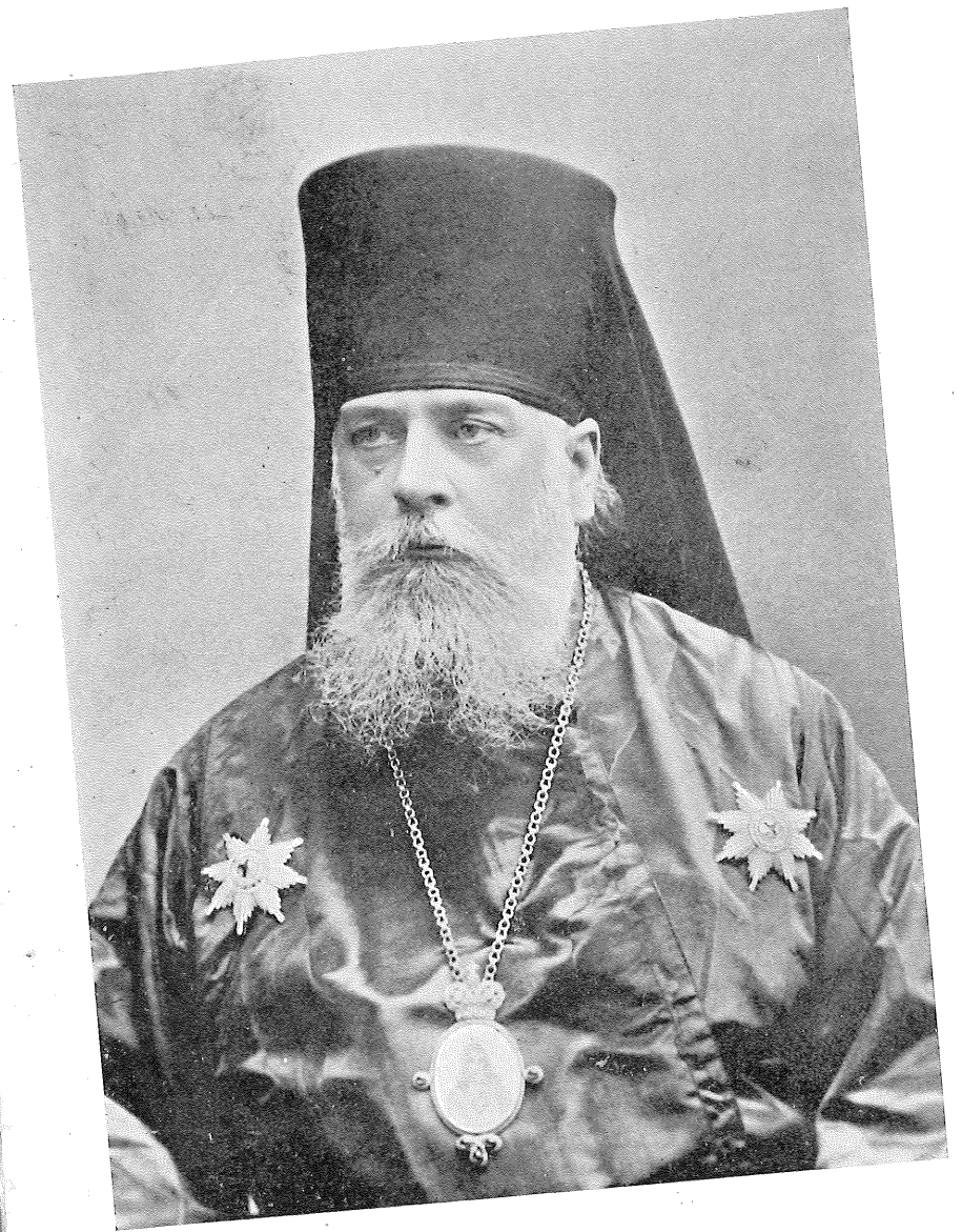
Серафимъ Ахромскій Кавказскій