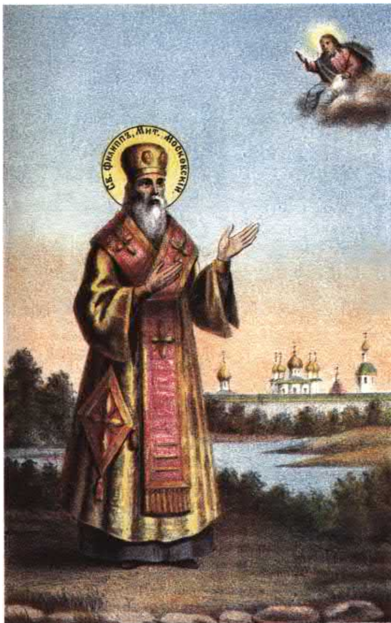
Преподобный Филипп, игумен Соловецкий, впоследствии митрополит Московский и Всероссийский. Соловецкий Патерик. 1873 г.