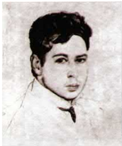
Константин Андреевич Сомов, художник, корреспондент В.В. Розанова. Автопортрет. Акваель, гуашь. 1903 г.