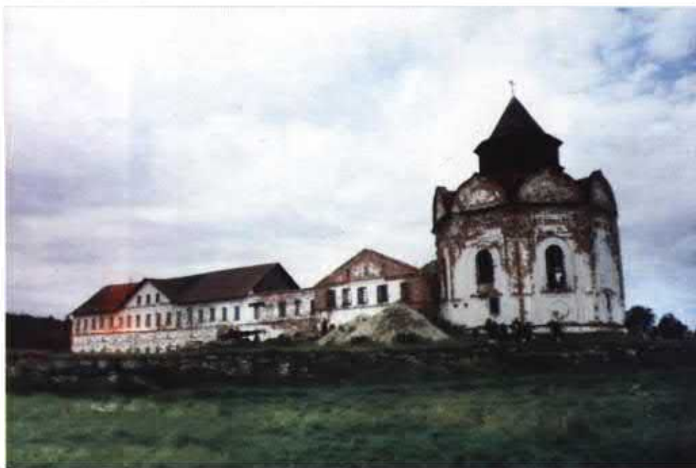
Современный вид Свято-Троицкого скита.