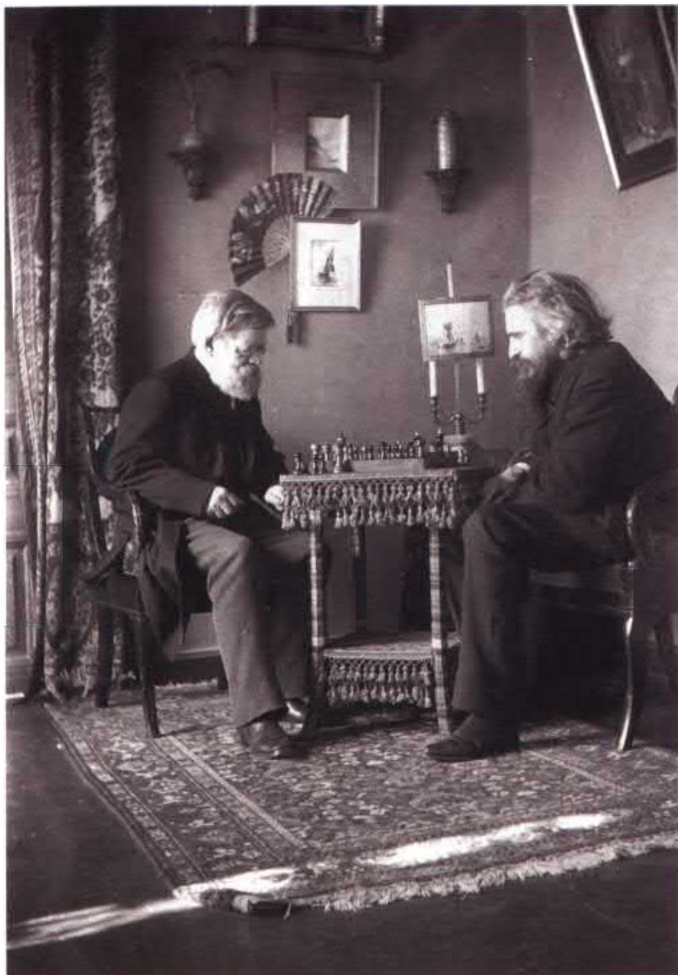
Вл. С. Соловьев (справа) и А.Н. Пыпин за шахматами. Фото М.Н.Чернышевского. НИОР РГБ. Ф. 171. К. 22. Ед. хр. 19. Л. 8.