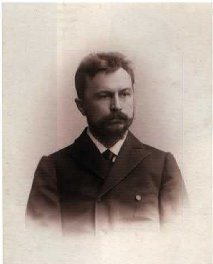
Сергей Николаевич Булгаков , философ, экономист, корреспондент В.В. Розанова. Фото. НИОР РГБ. Ф. 249. К. 1340. Ед. хр. 1. Л. 25.