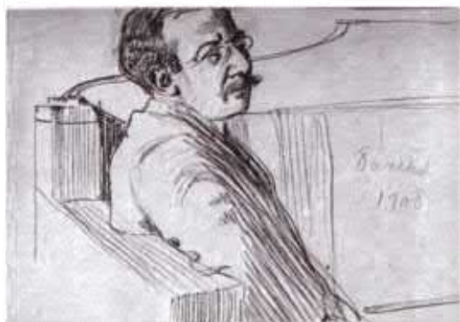
Лев Самойлович Бакст, художник, корреспондент В.В. Розанова. Рис. А.Н. Бенуа. Карандаш, сангина. 1908 г.