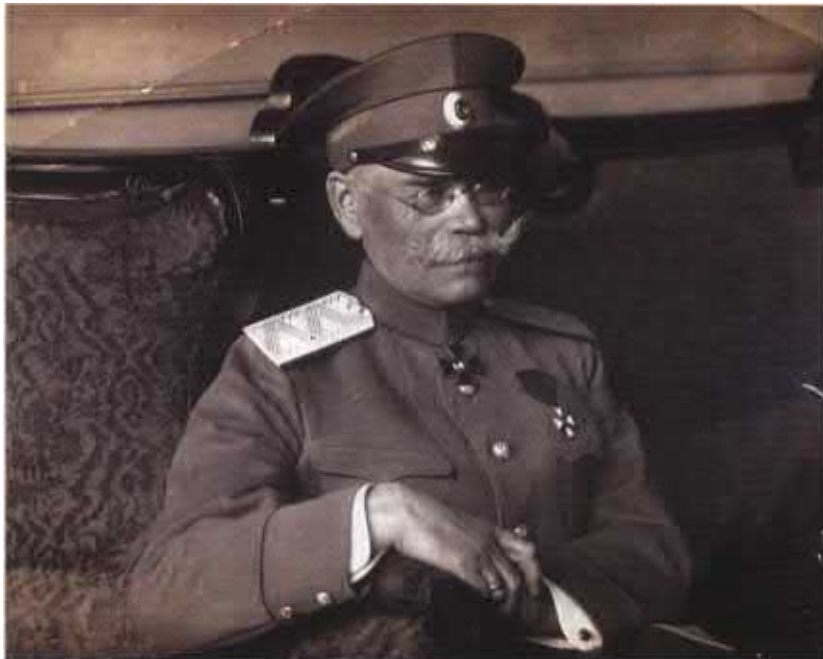
М.В. Алексеев незадолго перед революцией. НИОР РГБ. Ф. 855. К. 12. Ед. хр. 33. Л. 4.