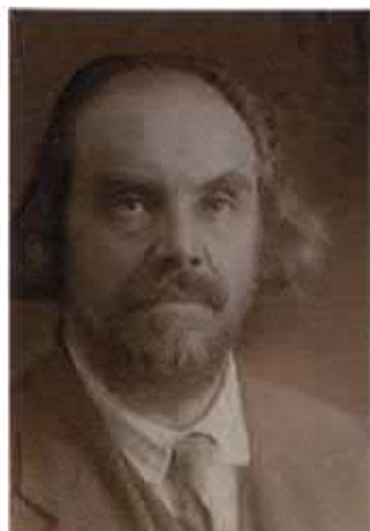
Николай Александрович Бердяев, философ, публицист, корреспондент В.В. Розанова.