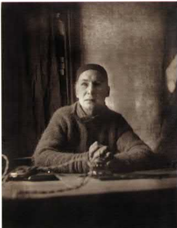
Андрей Белый (Б.Н. Бугаев), поэт, прозаик, публицист. Фото. НИОР РГБ. Ф. 249. К. 1340. Ед. хр. 1. Л. 26.