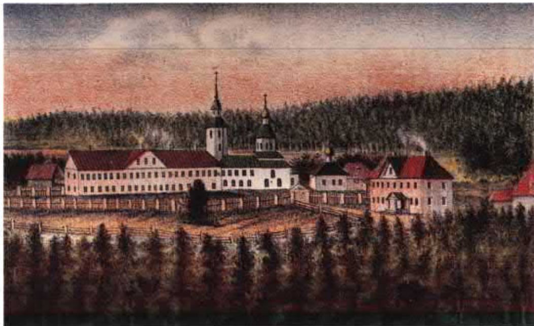
Свято-Троицкий скит на Анзерском острове. Соловецкий Патерик. 1873 г.