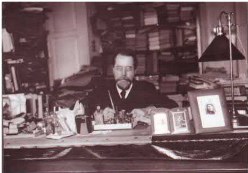
Николай Никанорович Глубоковский, профессор Санкт-Петербургской духовной академии, корреспондент В.В. Розанова. Фото от 1 июля 1914 г. НИОР РГБ. Ф. 249. М. 4198. Ед. хр. 11. Л. 7.