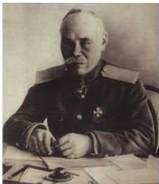
М.В. Алексеев в период Первой мировой войны.