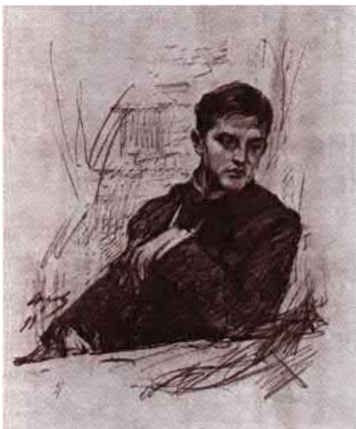
Дмитрий Владимирович Философов, публицист, корреспондент В.В. Розанова . Литография В.А. Серова. 1899 г.