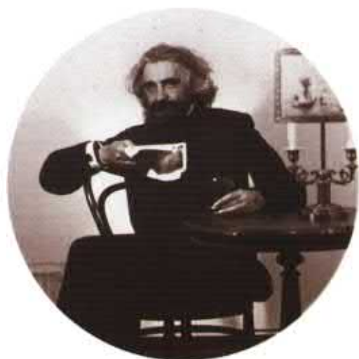
Вл. С. Соловьев за чтением воспоминаний о Н. Г. Чернышевском. Фото М.Н. Чернышевского. НИОР РГБ. Ф. 171. К. 22. Ед. хр. 19. Л. 1.