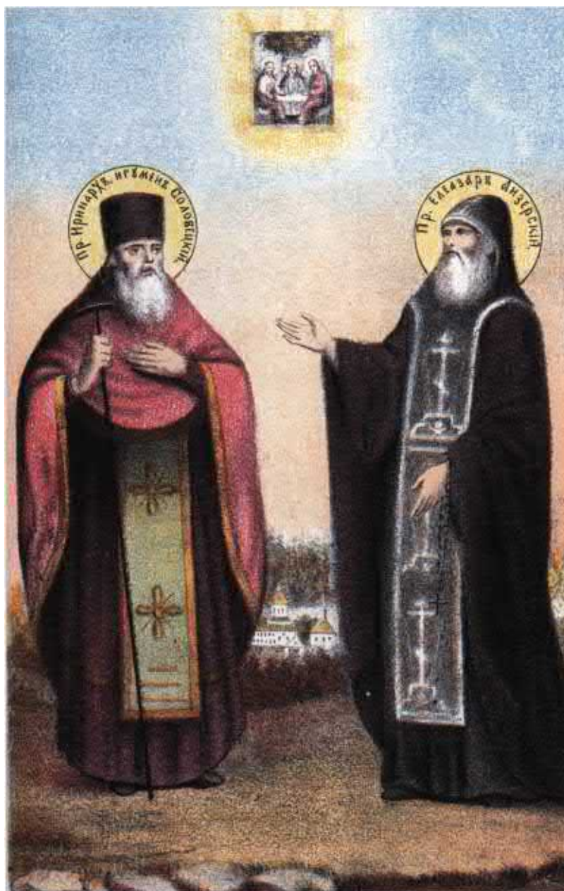
Чудотворцы Соловецкие, преподобные Иринарх (игумен Соловецкий) и основатель Свято-Троицкого скита Елеазар (справа). Соловецкий Патерик. 1873 г.