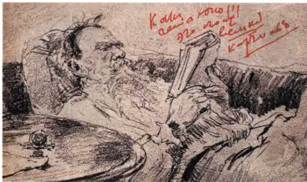
«Как гениально!!! Это стоит великой картины». Автограф В.В. Розанова на открытке с изображением фрагмента рисунка И.Е. Репина «Толстой за чтением». Август 1909 г. НИОР РГБ. Ф. 249. М. 4216. Ед. Хр. 13. Л. 4.