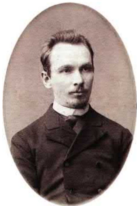
Василий Васильевич Розанов. Фото конца 1880-х — начала 1890-х гг. НИОР РГБ. Ф. 249. К. 1340. Ед. хр. 1. Л. 6.