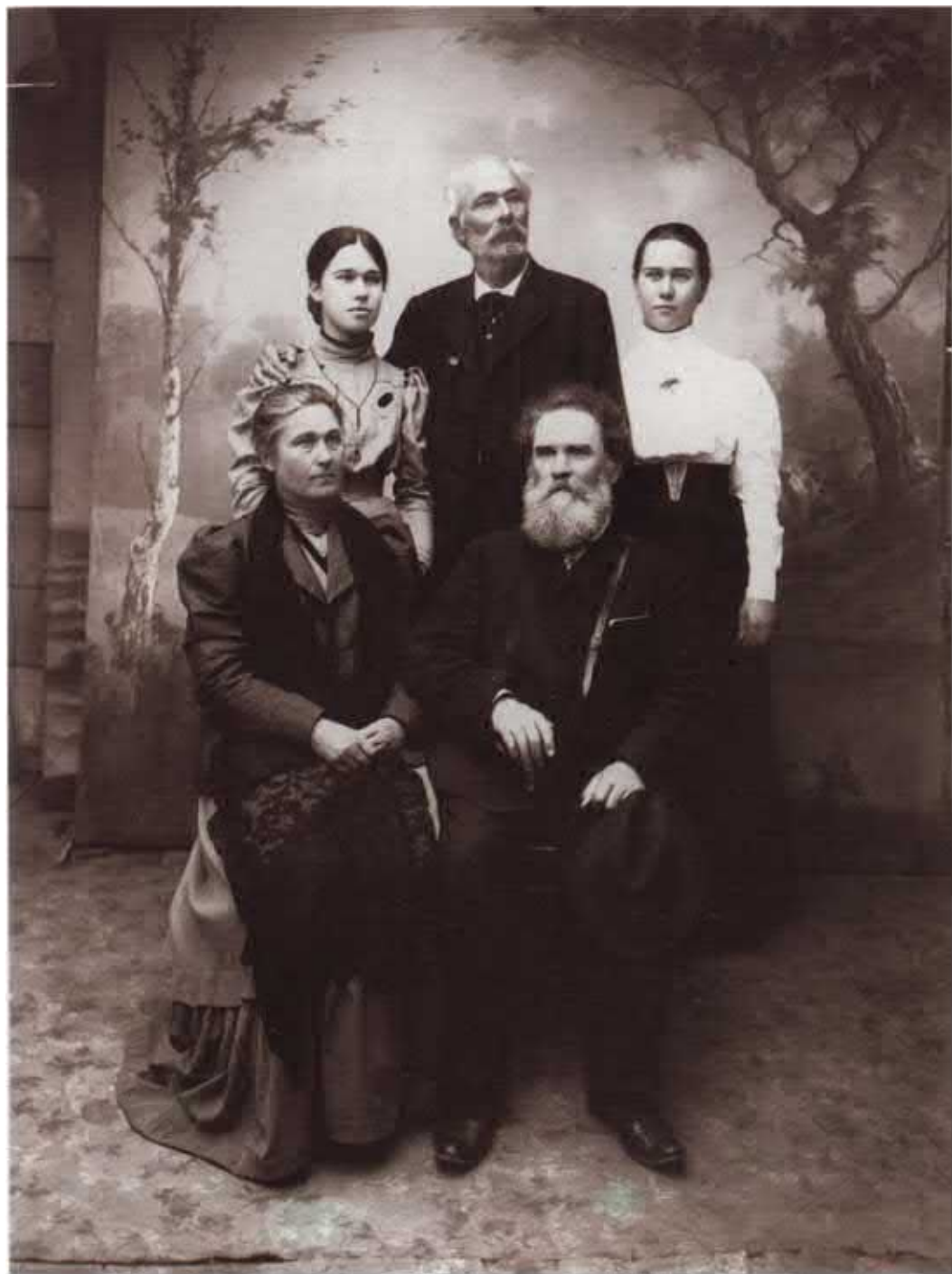
Владимир Галактионович Короленко с семьей. Тульча. 1903 г. НИОР РГБ. Ф. 135. Разд. Ш. К. 56. Ед. хр. 12.