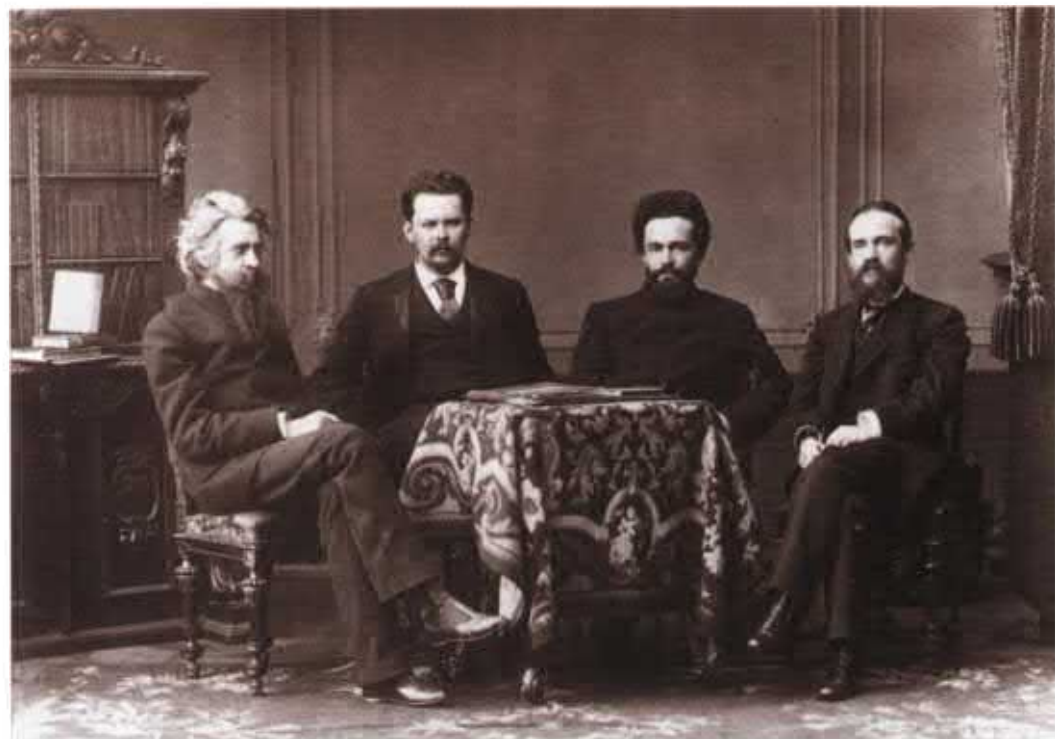
Вл. С. Соловьев (слева), С.Н. Грубещкой, Н.Я. Грот, Л.М. Лопатин. 1890-е гг. НИОР РГБ. Ф. 16. К. 24. Ед. хр. 20.