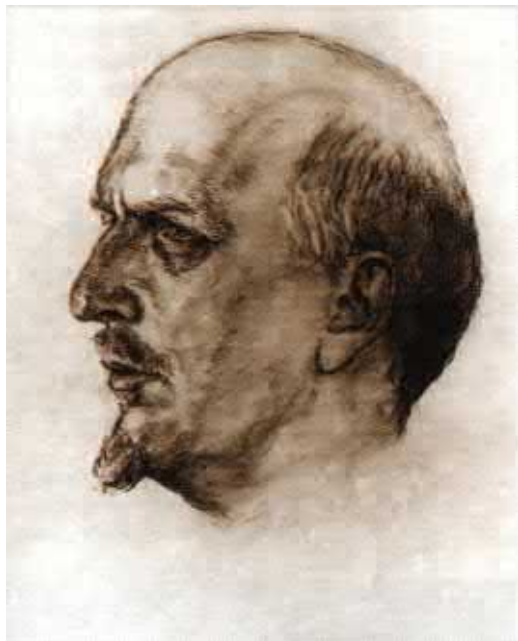
Рис. Е.Е. Климова. Из новых поступлений в ф. 167 (Э.К. Метнера).