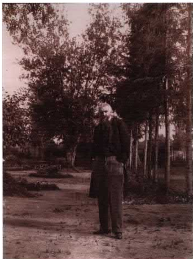
Владимир Сергеевич Соловьев, философ, поэт, публицист, корреспондент В.В. Розанова. Фото. НИОР РГБ. Ф. 249. К. 1340. Ед. хр. 1. Л. 1.