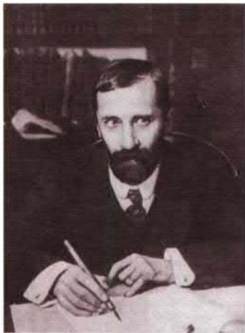
Дмитрий Сергеевич Мережковский, писатель, поэт, литературный критик, корреспондент В.В. Розанова. Фото. 1913 г.