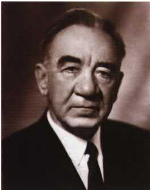
Федот Петрович Филин, член-корр. АН СССР. Фото. 1982 г. НИОР РГБ. Ф. 816. К. 44. Ед. хр. 15.