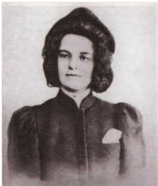
Зинаида Николаевна Гиппиус, поэтесса, литературный критик, корреспондент В.В. Розанова. Фото. 1913 г.