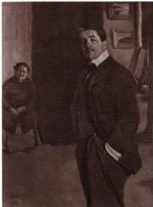
Сергей Павлович Дягилев (с няней), корреспондент В.В. Розанова . Портрет работы Л.С. Бакста. Масло. 1906 г.