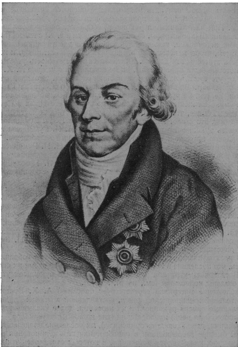
Портрет Н. П. Румянцева. — Древняя и новая Россия, 1877, т. 2, с. 9