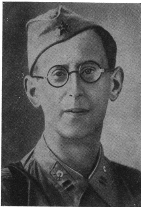
В. М. Мирошевский. Фотография. 1942. Ф. 469, № 4.51.

В первые дни Великой Отечественной войны В. М. Мирошевский пошел добровольцем на фронт, был политруком стрелковой роты, затем — редактором дивизионной газеты. 17 августа 1942 г. он героически погиб 1 .