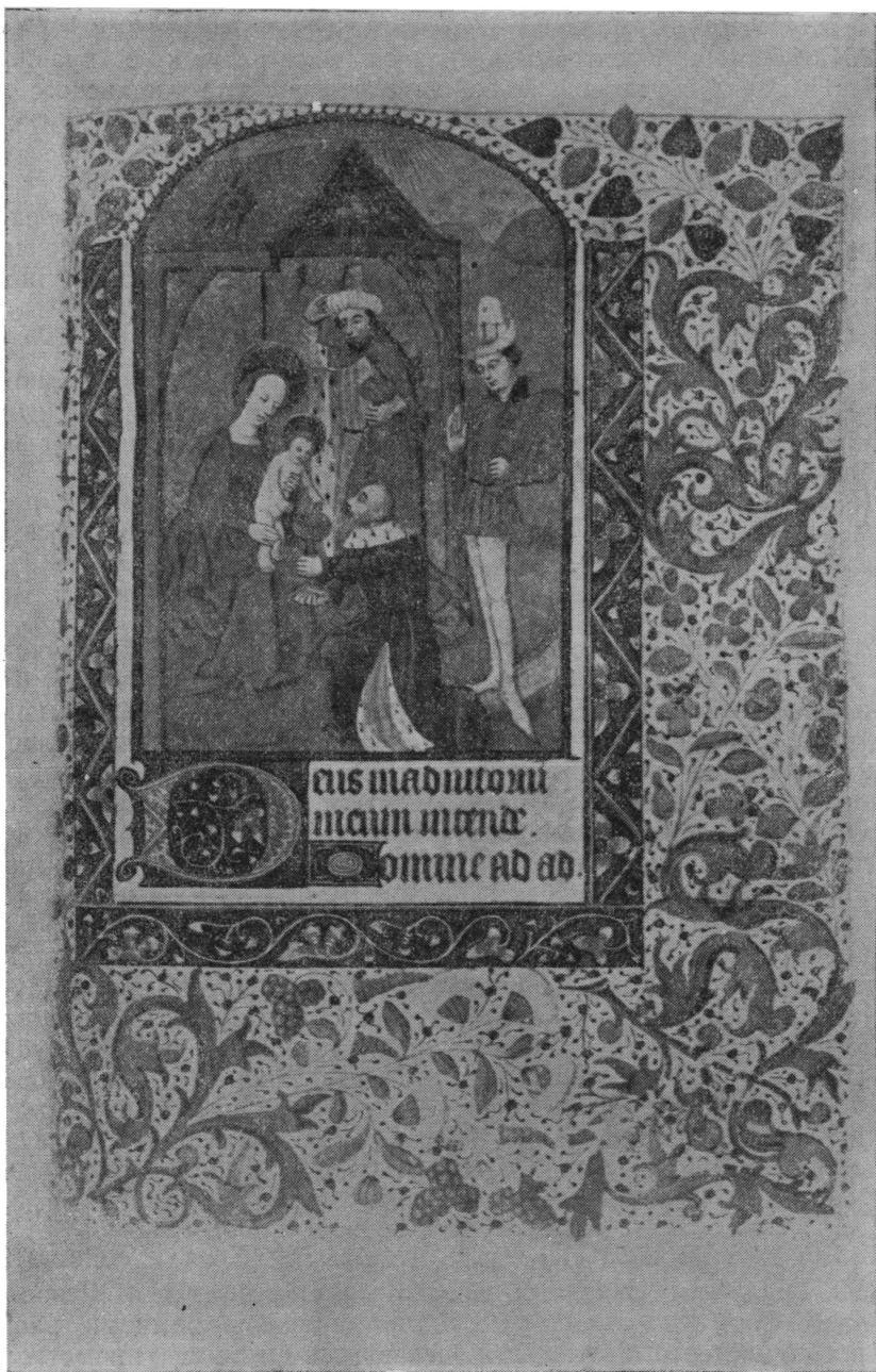
«Поклонение волхвов». Миниатюра в красках с золотом. Л. 64 из Часослова перв. пол. XV в., писанного на пергаменте [в Северной Франции?]