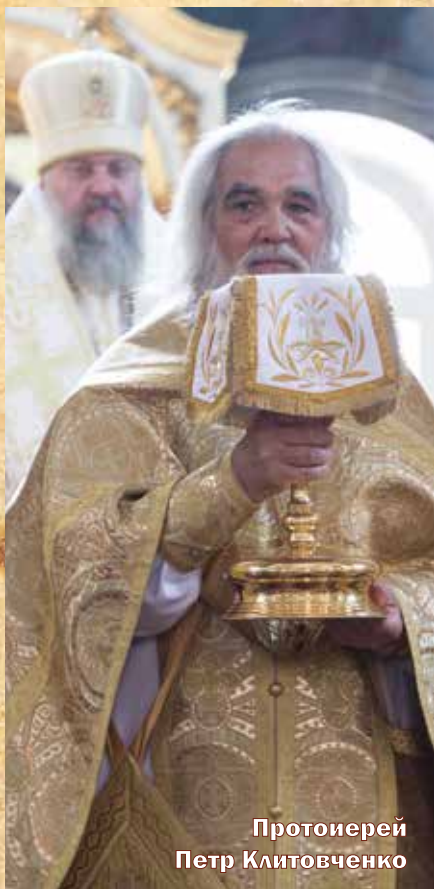
Протоиерей Петр Клитовченко