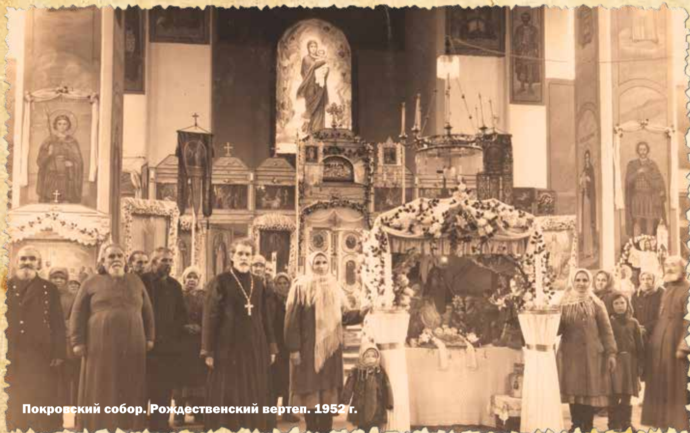
Покровский собор. Рождественский вертеп. 1952 г.