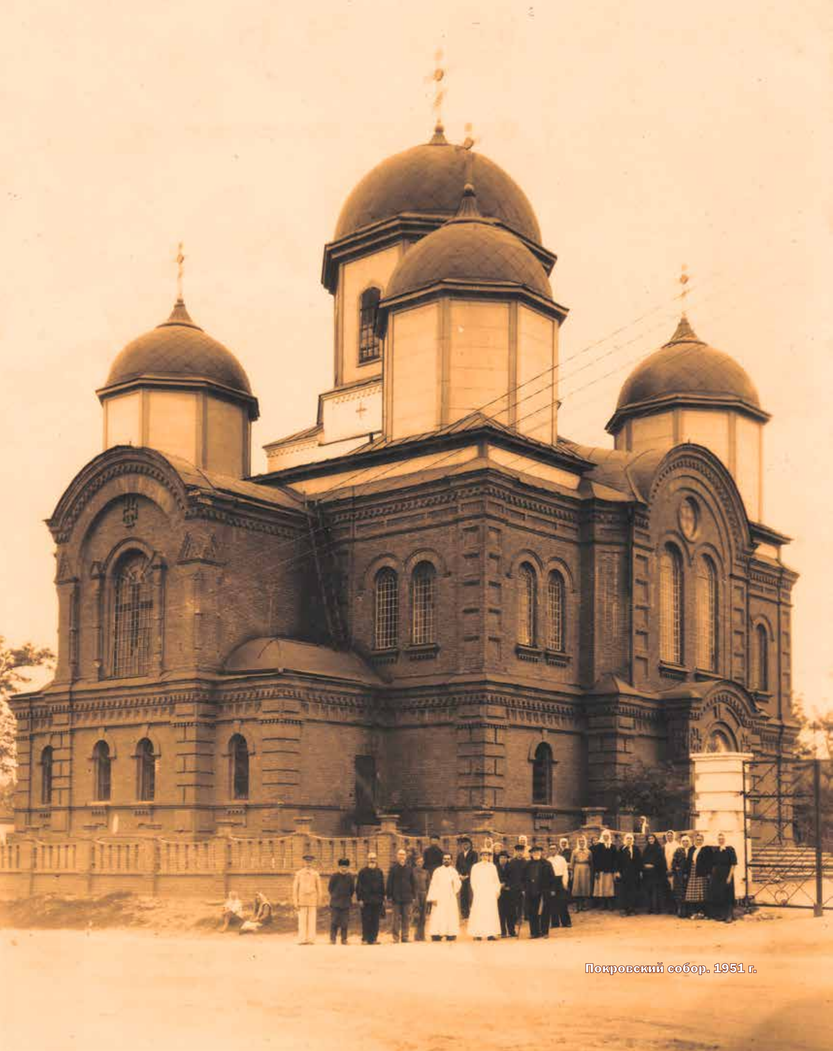
Покровский собор. 1951 г.