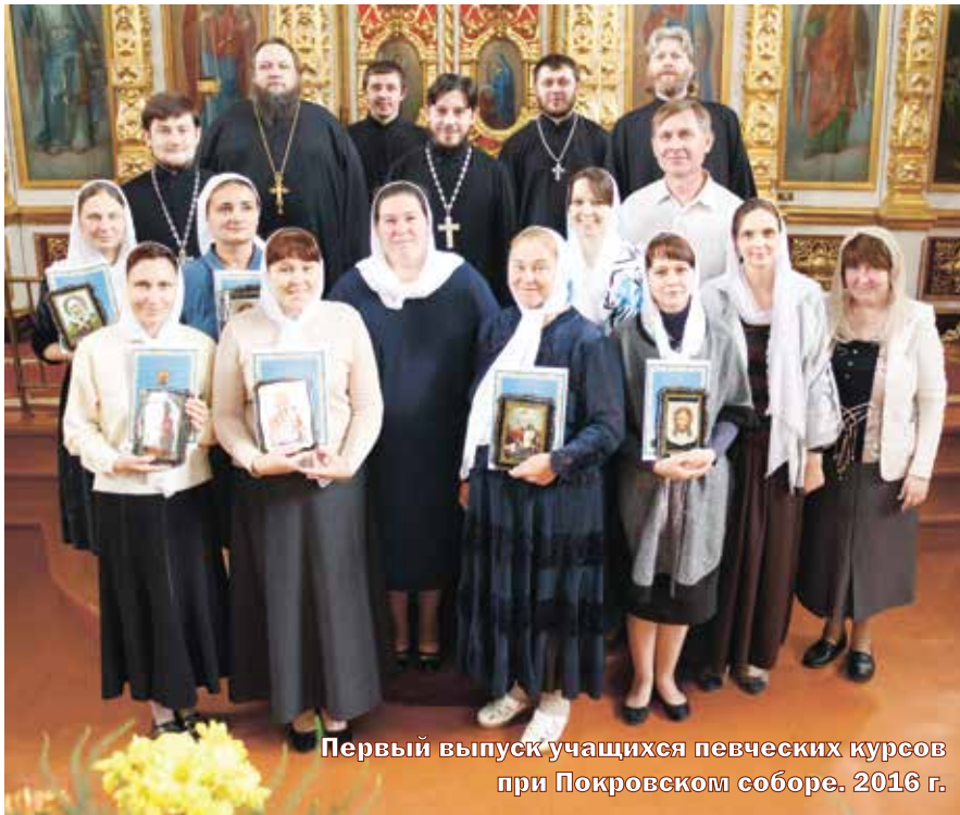
Первый выпуск учащихся певческих курсов при Покровском соборе. 2016 г.