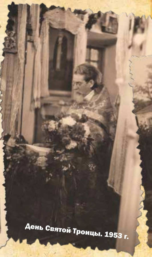
День Святой Троицы. 1953 г.

любой формы религиозной деятельности. В 1937 году взорвали храм в честь Казанской иконы Божией Матери на Романовском подворье монастыря. Покровский храм остался нетронутым, но был закрыт до 1942 года. По рассказам прихожан, в нем в тот период располагалось зернохранилище.