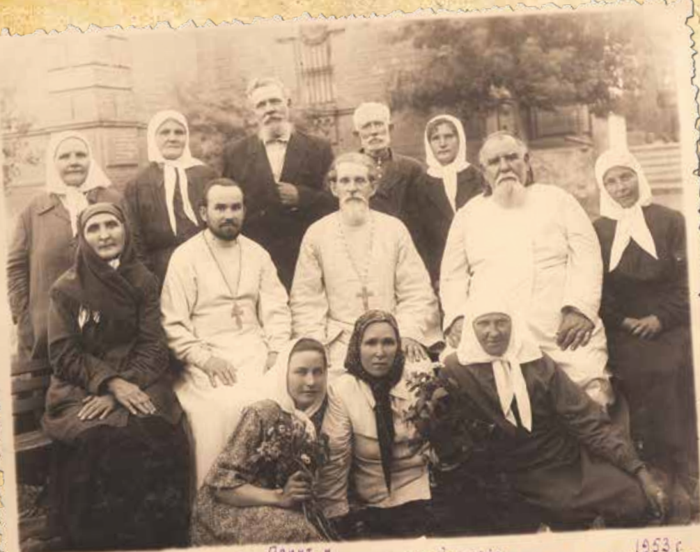
Левый клир. Покровского собора, г. Кропоткин. 1953 г.