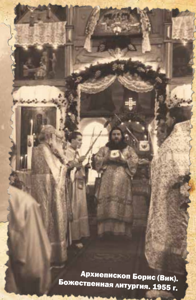
Архиепископ Борис (Вик). Божественная литургия. 1955 г.

Перепуганные люди, видя такое спокойствие, успокаивались сами, присоединяли свои молитвы к богослужению». Под покровом Пресвятой Богородицы и прошел Кропоткин Великую Отечественную.