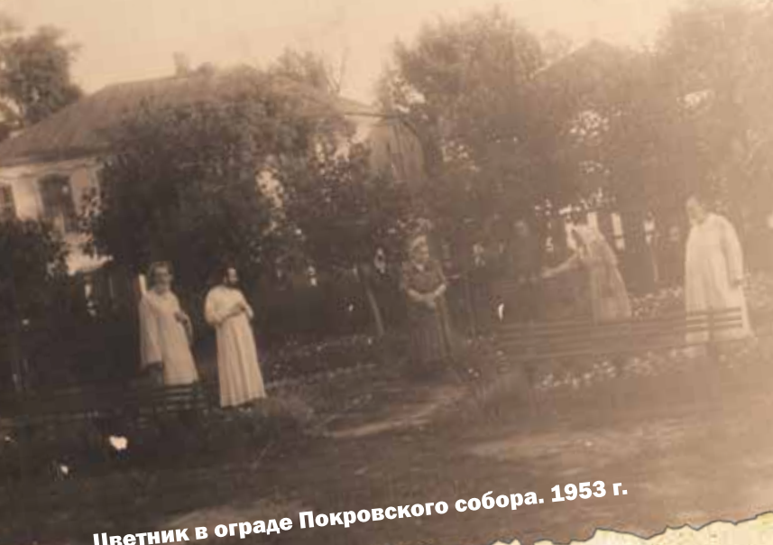
Цветник в ограде Покровского собора. 1953 г.