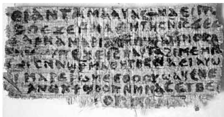
Фрагмент Евангелия от Марка. Конец I в.

стилю. Однако эта простота является следствием динамичности с быстрой сменой одних событий другими, что подчеркивается глаголами настоящего времени и выражением «и тотчас». Каждое событие Евангелия связывается с предыдущим хронологически («в субботу»,