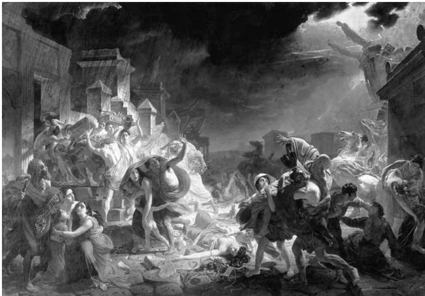
Карл Брюллов. Последний день Помпеи. 1833. ГРМ

...Картина Брюлова может назваться полным, всемирным созданием. В ней все заключилось. По крайней мере, она захватила в область свою столько разнородного, сколько до него никто не захватывал» 3 .