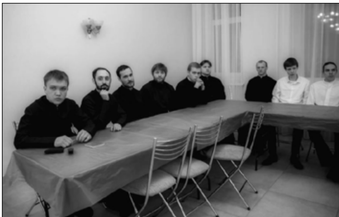
Фото 2. Студенты РПДС готовятся отвечать на вопросы олимпиады