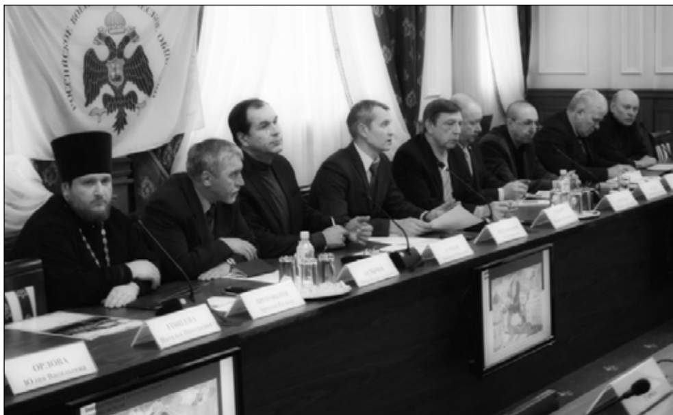
Фото 1. «Круглый стол» в доме общественных организаций