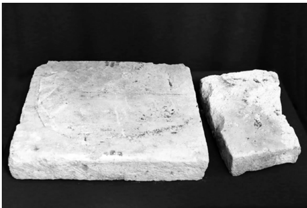
Фото 2. Фрагменты белокаменного саркофага царевича Иакова. XVII в.