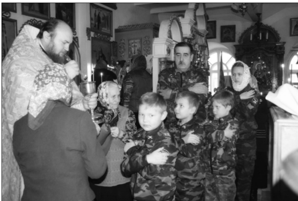
Фото 2. Таинство Евхаристии. Атаман станицы Штанько С. Н. с кадетами. Станичный храм в честь иконы Матери Божией «Споручница грешных»