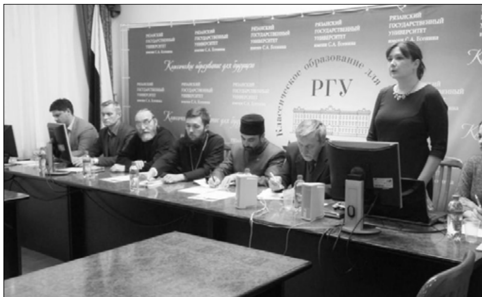
Фото 3. «Круглый стол» в РГУ имени С.А.Есенина