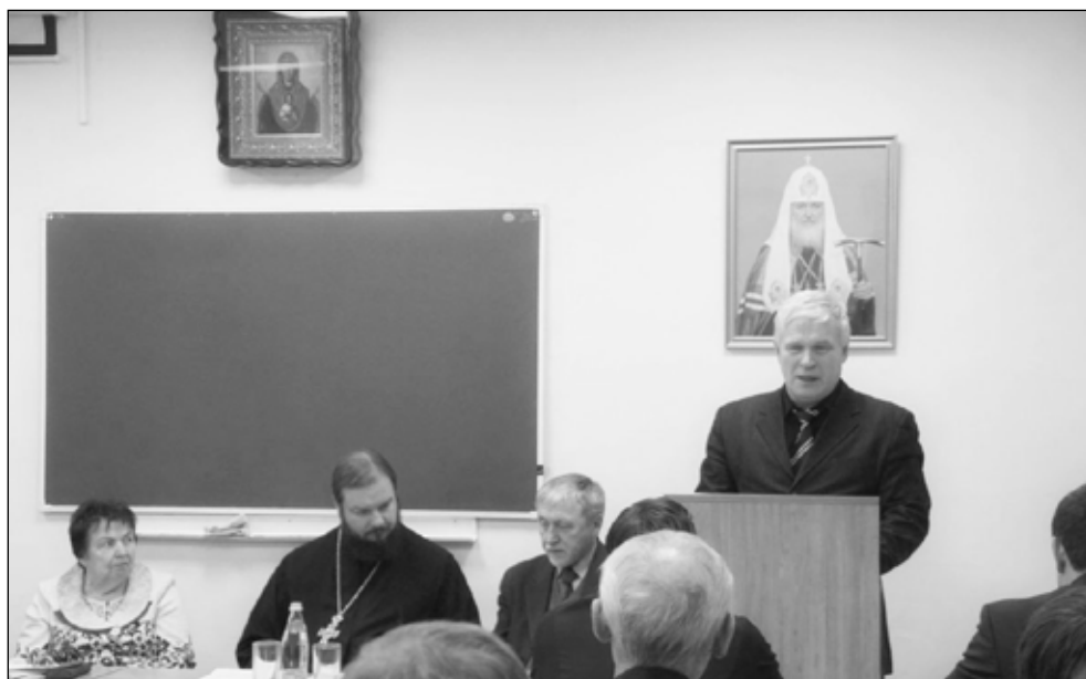
Фото 6. Участие членов РПИО в региональных Рождественских чтениях на базе Рязанской православной духовной семинарии, 2017 г.