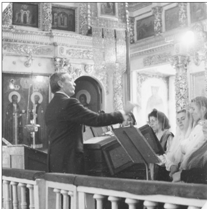
Фото 1. Борисо-Глебский кафедральный собор. 1980-е годы