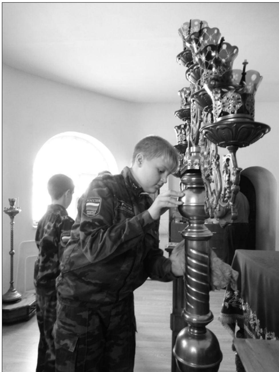
Фото 3. В станичном храме. Генеральная уборка в алтаре перед праздником. Кадеты старшего взвода