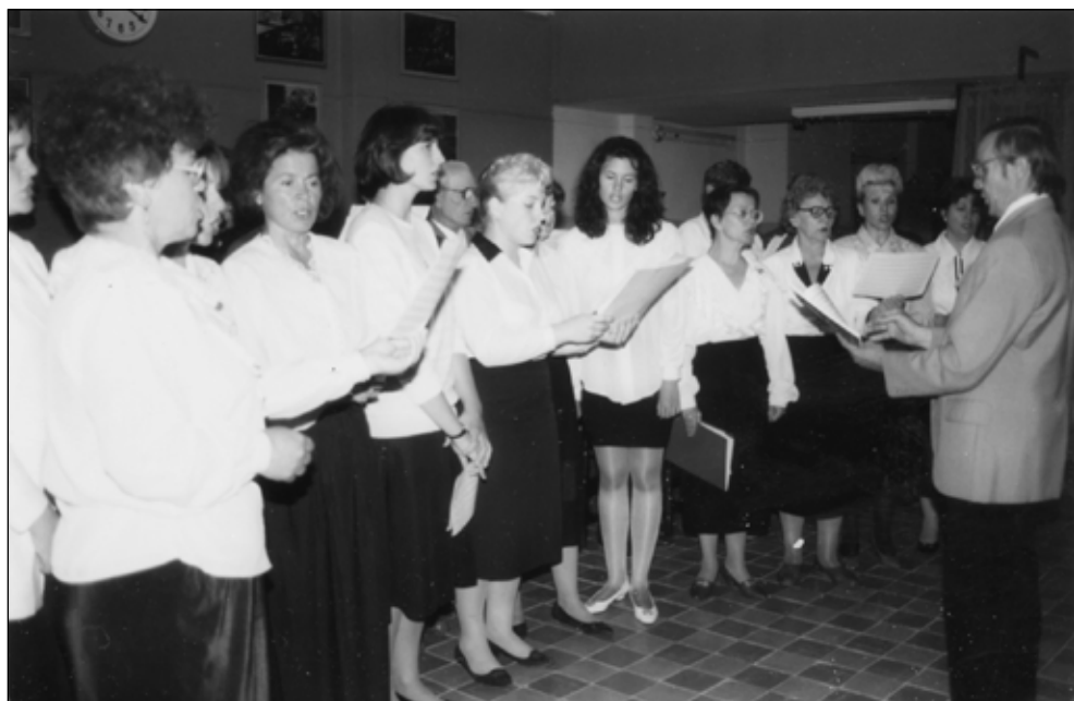
Фото 4. Освящение Торгового центра «Барс на Московском». 1985 год