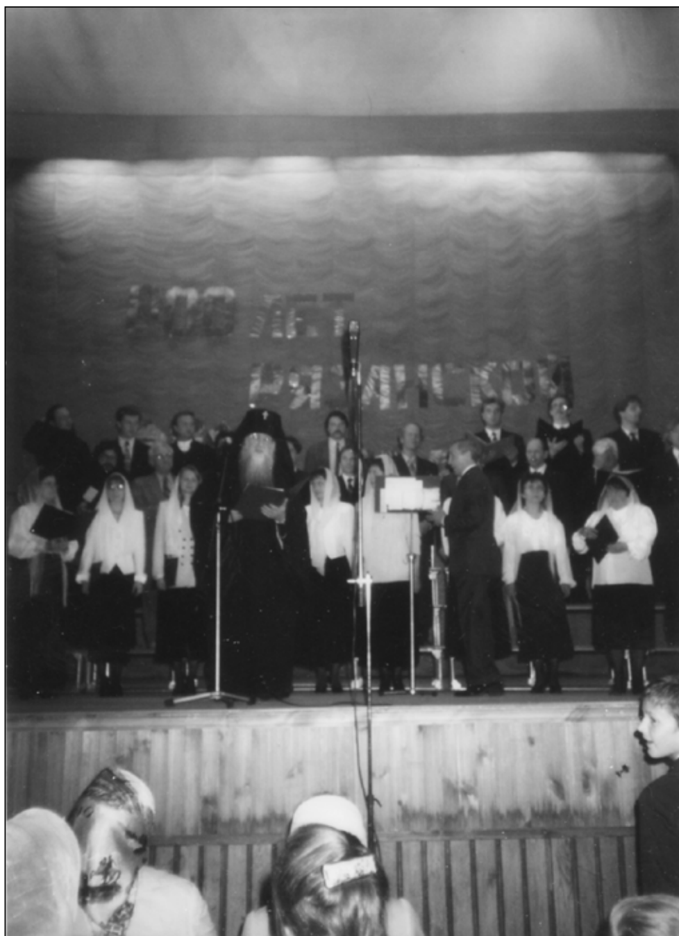
Фото 3. Выступление в областной филармонии, посвященное 800-летию Рязанской епархии. 1995 год