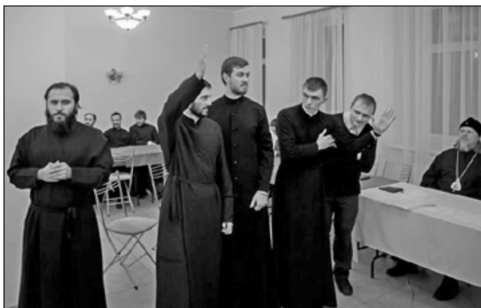
Фото 3. Семинаристы знают правильный ответ на вопрос комиссии