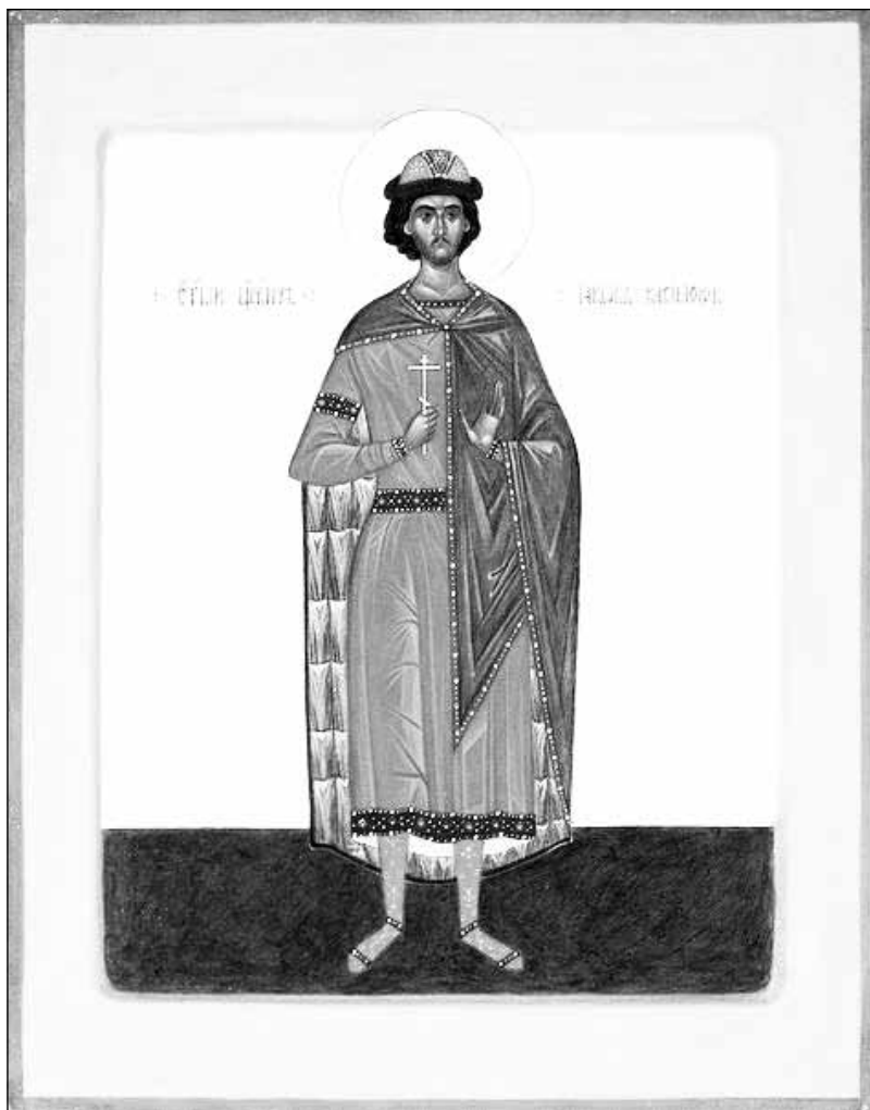
Фото 1. Икона св. блж. царевича Иакова. г. Касимов

Подготовила Маргарита Рябова по материалам официальной группы «ВКонтакте» Научно-производственного центра «Рязанская Археологическая Экспедиция» [Электронный ресурс] - Режим доступа: https://vk.com/npcrae , и официального сайта Касимовской епархии [Электронный ресурс] - Режим доступа: http://kaseparb.ru/index.php?option=com_content&view=article&id=6026:-1-r&catid=1:kasimovnews&Itemid=27