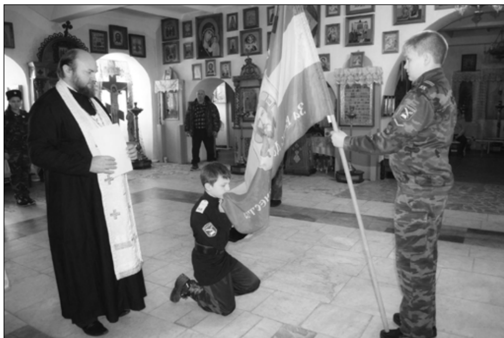
Фото 4. Кадетская присяга в станичном храме