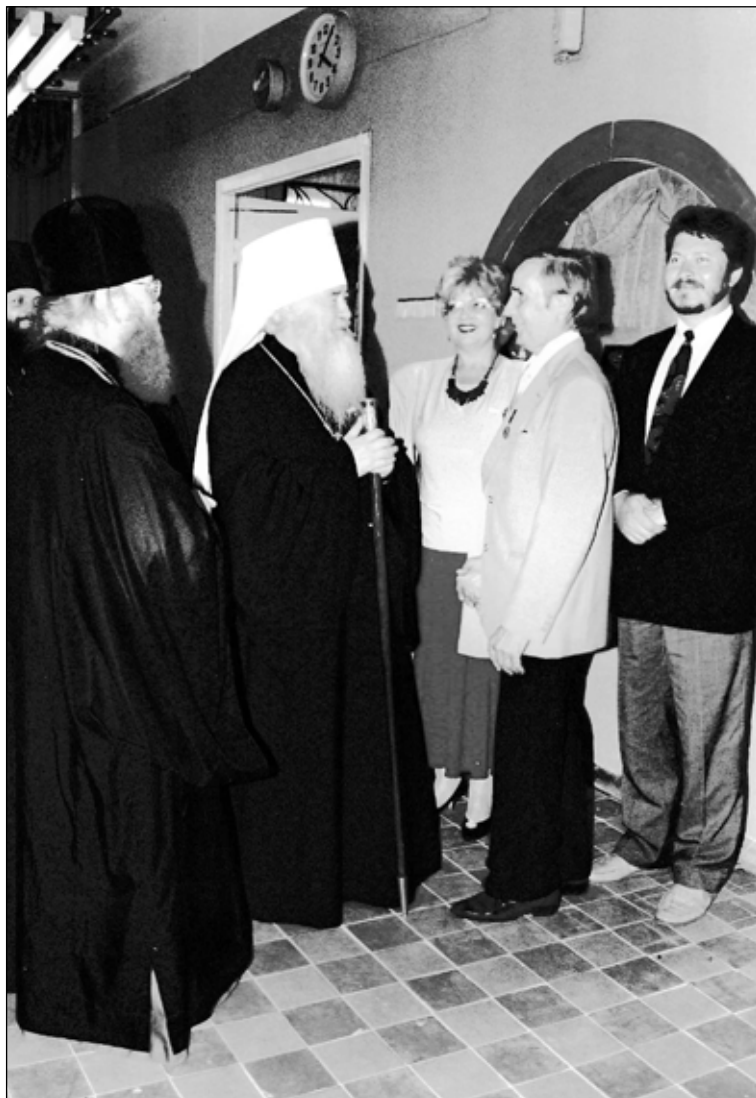
Фото 10. Митрополит Крутицкий и Коломенский Ювеналий (Поярков) и Н.Н. Лоханков на освящении Торгового центра «Барс на Московском». 1985 год