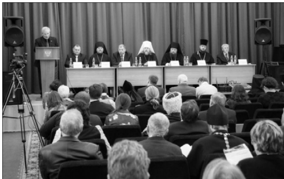
Фото 5. Собрание РПИО, 2016 г.