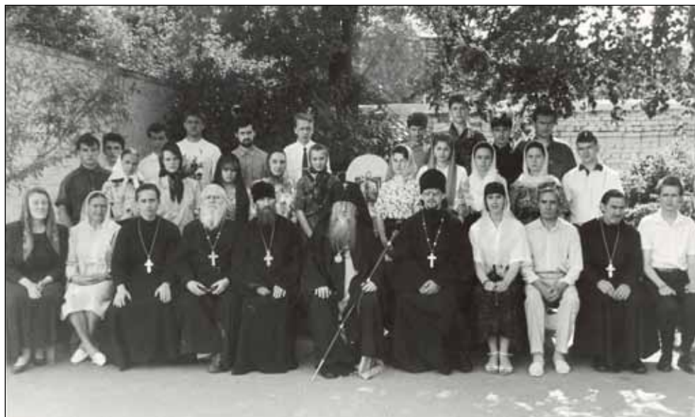
Фото 8. Первый выпуск рязанского православного духовного училища. 1991 год. В центре – архиепископ Рязанский и Касимовский Симон (Новиков), третий справа – Н.Н. Лоханков