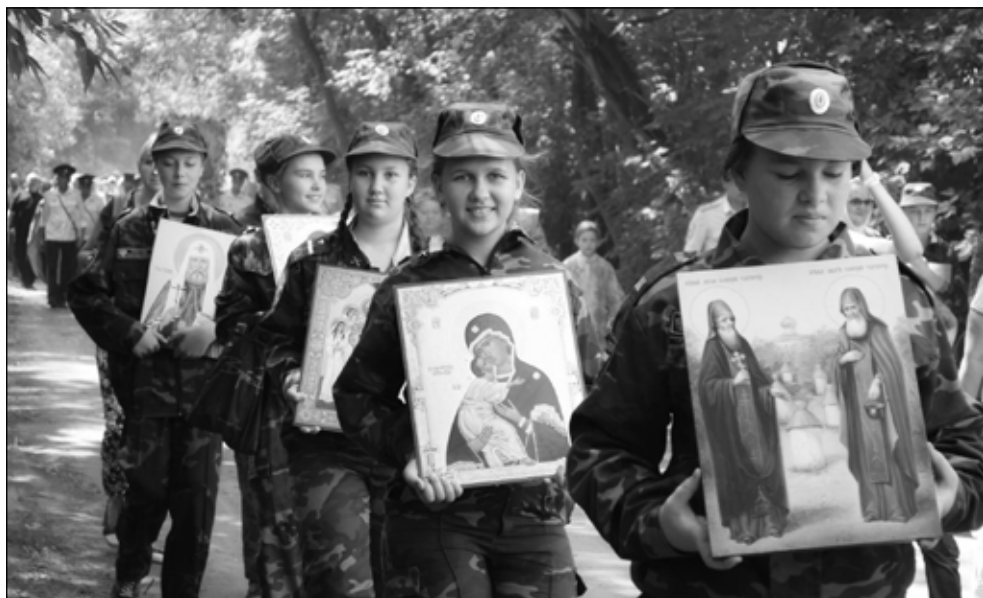
Фото 1. Крестный ход в день празднования Тихвинской иконы Божией Матери. 9 июля. Село Сушки. Кадеты старшего взвода