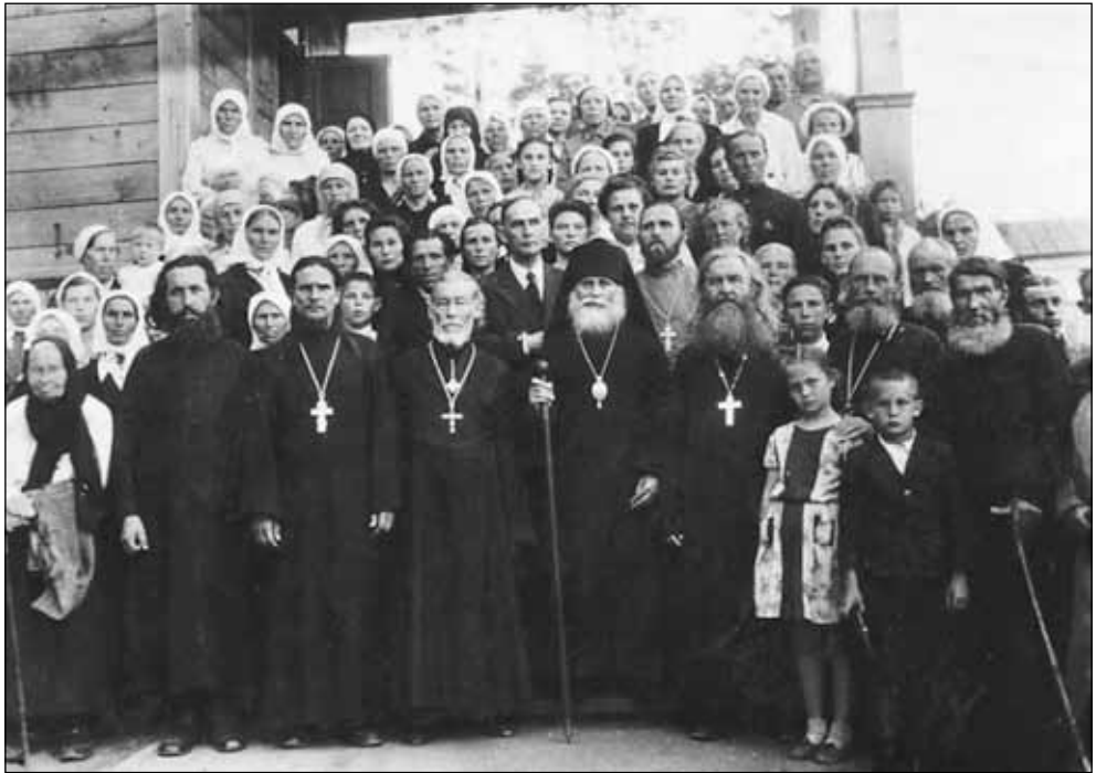
Фото 3. Духовенство и прихожане Христорожественного собора г. Хабаровска. В центре – архиепископ Гавриил (Огородников). В светлом подряснике, во втором ряду – священник Симеон Теплоухов. Хабаровск, 1949 г.