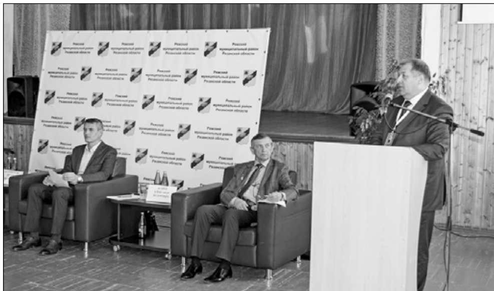
Фото 5. Участников Гаретовских чтений приветствует вице-губернатор Сергей Филимонов