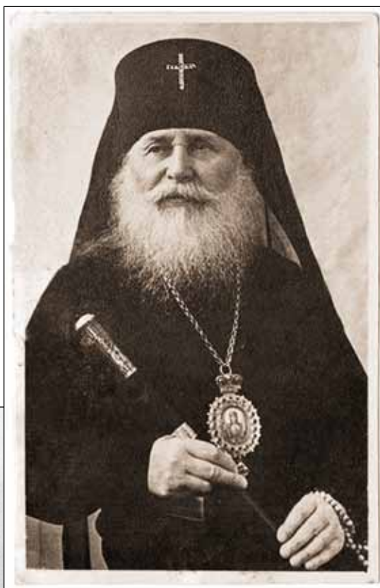
Фото 1 (справа). Архиепископ Гавриил (Огородников)