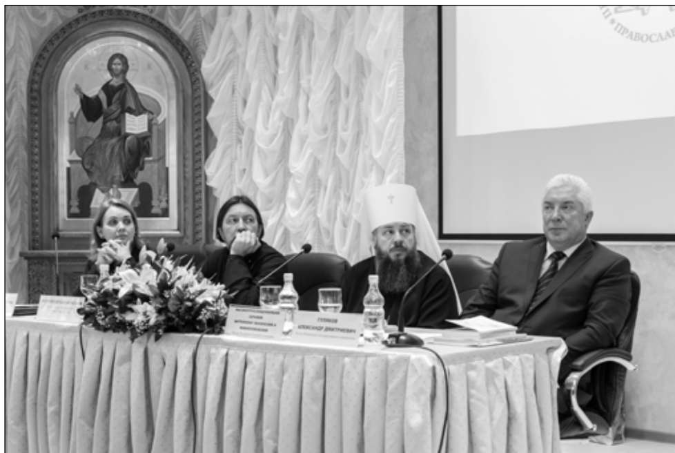
Фото 1. Возглавил работу пленарного заседания конференции митрополит Пензенский и Нижнеломовский Серафим