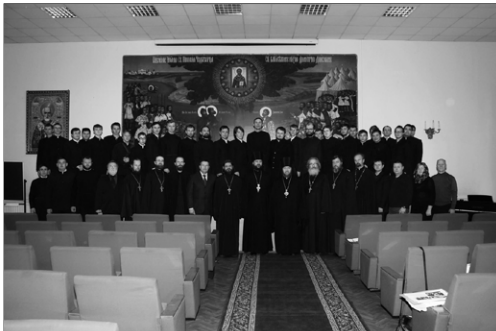
Фото 1. Участники конференции