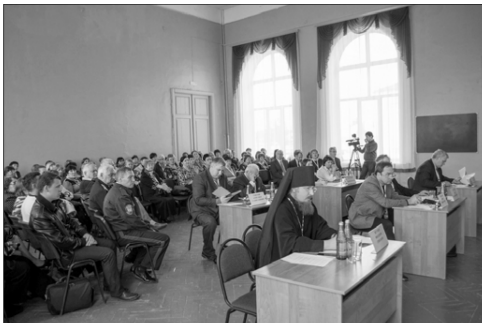
Фото 3. Участники Гаретовских чтений слушают выступления докладчиков