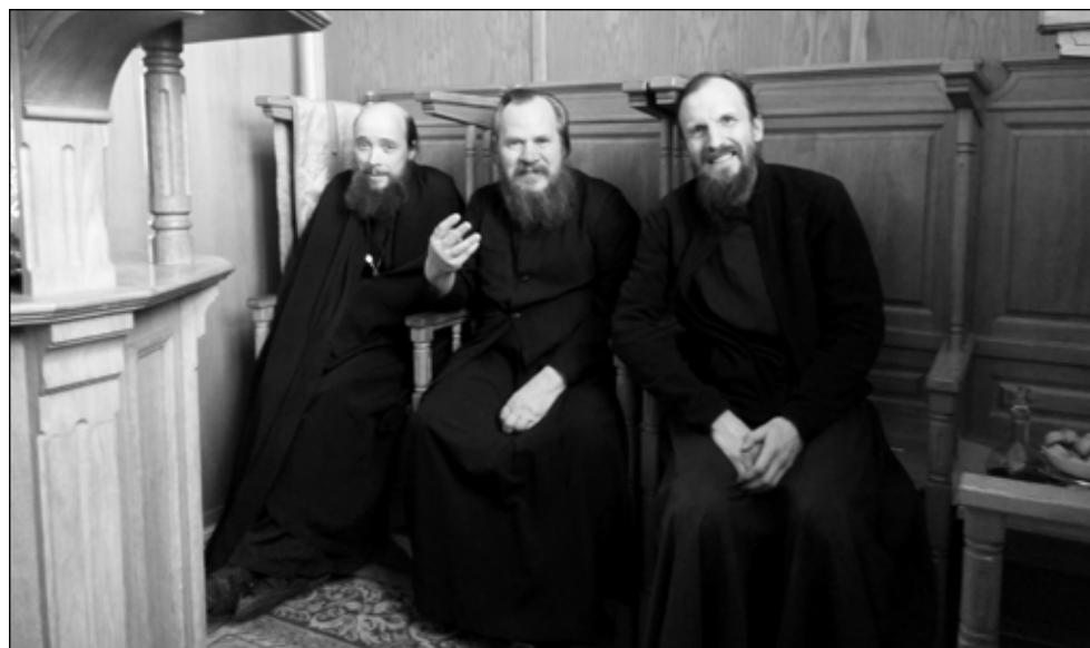
Фото 3. С братией Иоанно-Богословского монастыря, лето 2017 года