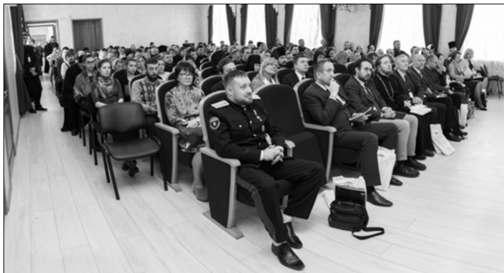
Фото 3. Участники пленарного заседания слушают выступления докладчиков