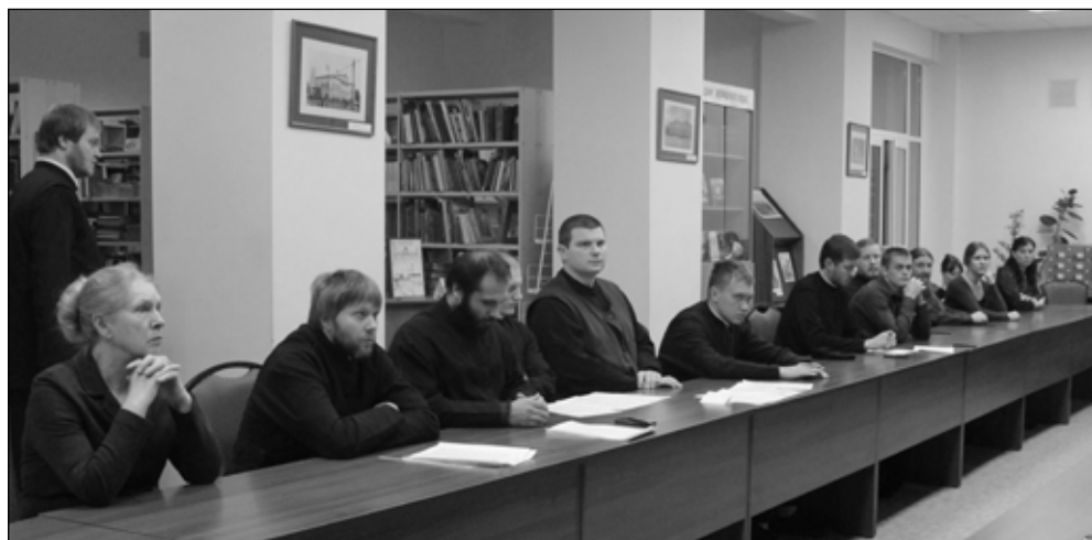
Фото 3. Семинаристы готовятся выступать с докладами