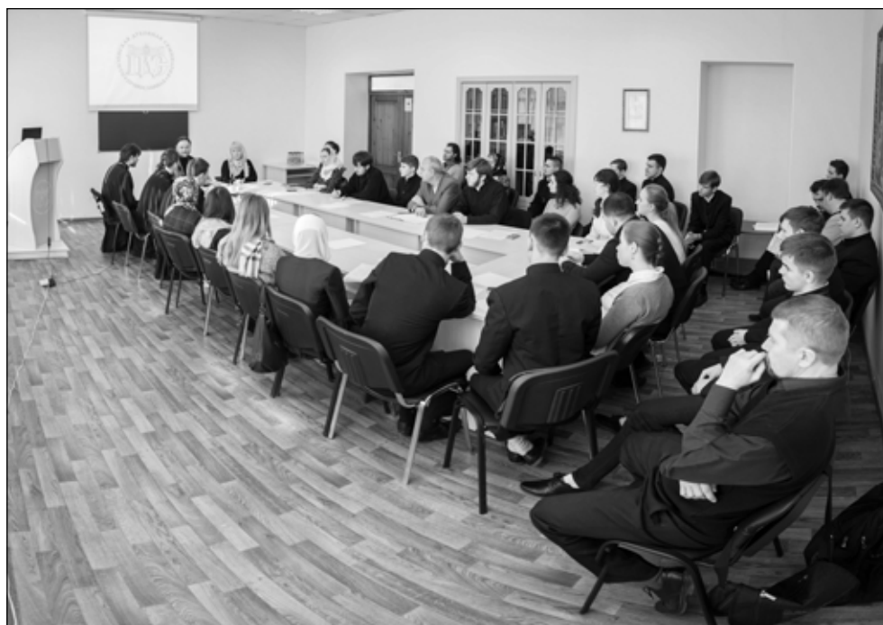
Фото 4. Историческая секция конференции