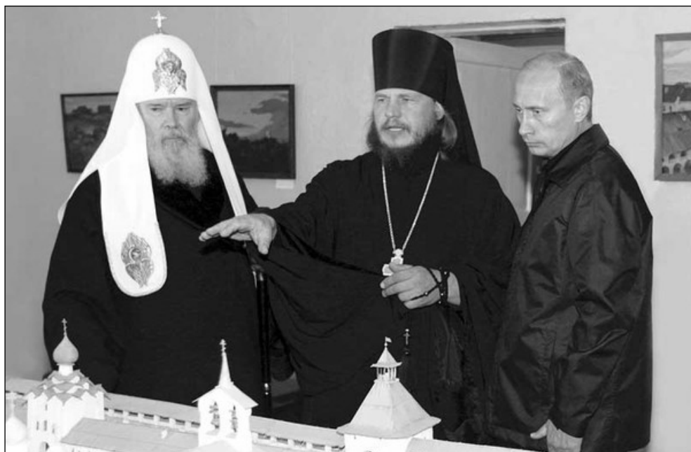
Фото 4. Святейший Патриарх Алексий II, архимандрит Иосиф, Президент РФ Владимир Путин обсуждают планы по восстановлению Соловецкого монастыря