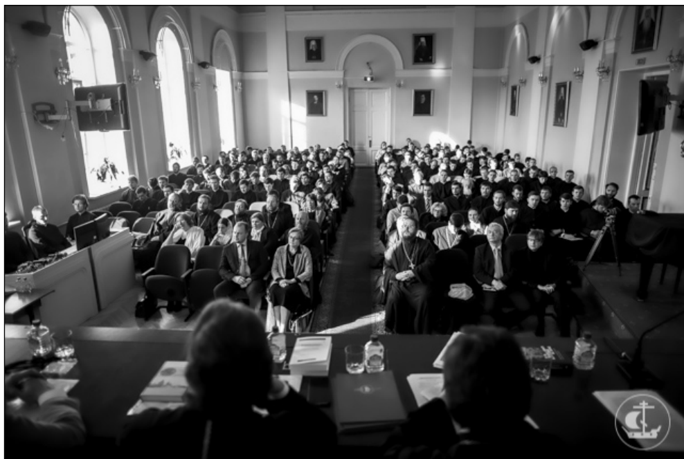
Фото 1. Участники конференции на пленарном заседании