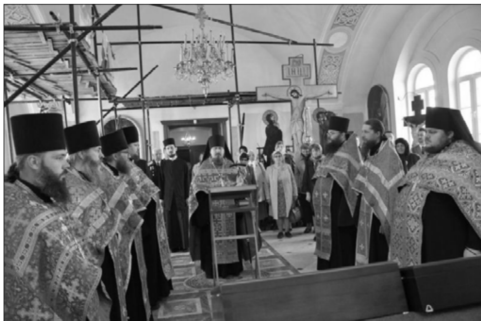
Фото 2. Праздничное богослужение, посвященное открытию XIII Гаретовских чтений