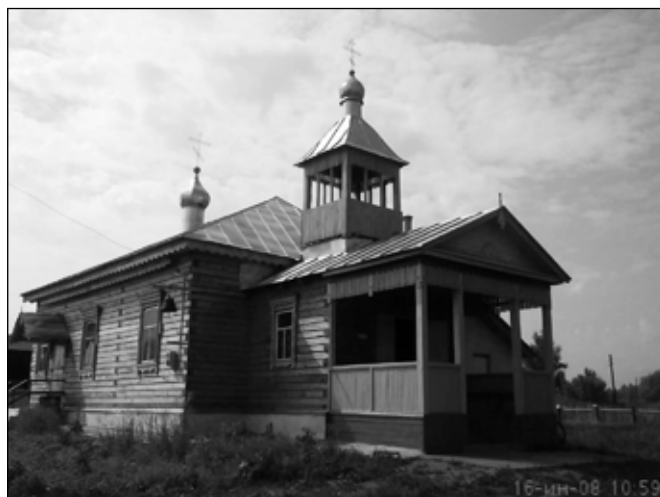
Фото 3. Храм Казанской иконы Божией Матери с. Кутуково (настоящее время)