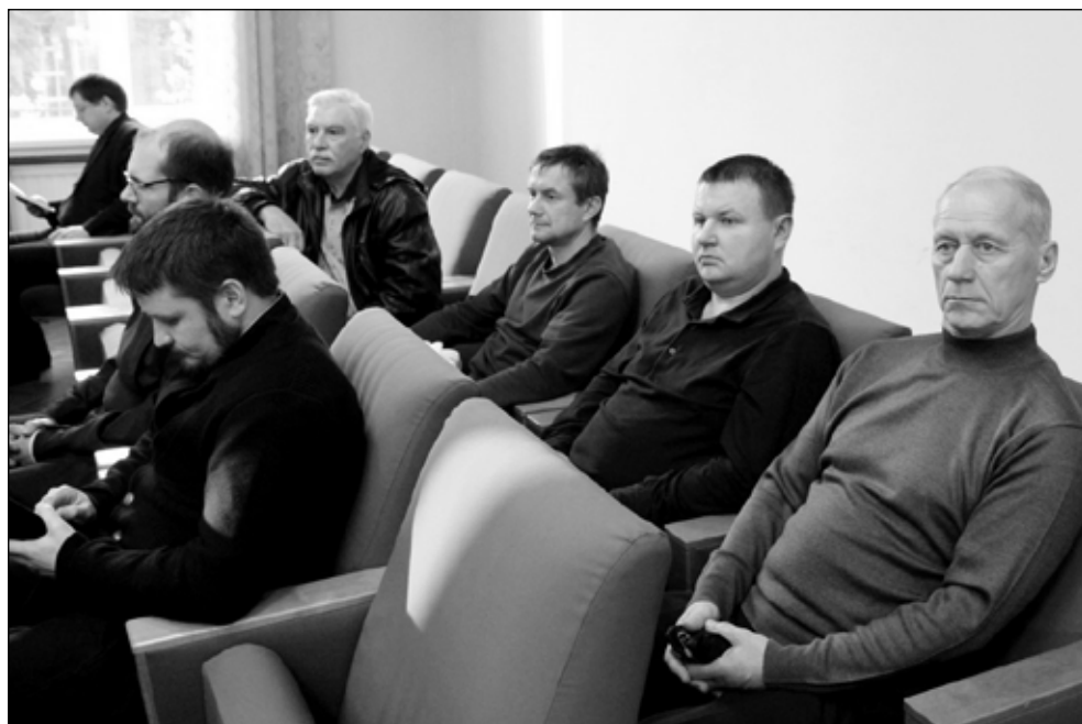
Фото 2. На пленарном заседании