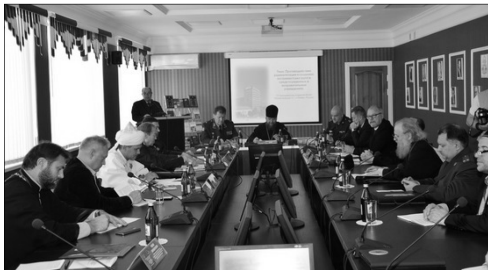
Фото 2. Участники пленарного заседания конференции