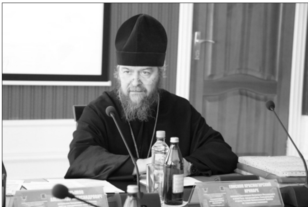
Фото 1. Почетный гость форума – епископ Красногорский Иринарх, викарий Святейшего Патриарха Московского и всея Руси, председатель Синодального отдела Русской Православной Церкви по тюремному служению