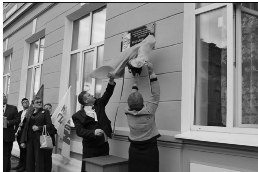
Фото 4. Открытие мемориальной доски писателю И.И. Макарову