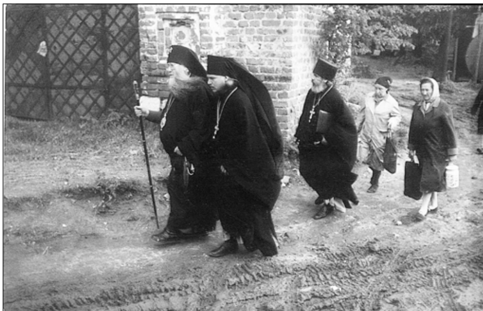
Фото 2. Первые шаги по возрождающемуся Иоанно-Богословскому монастырю Рязанской епархии. (Слева направо: архиепископ Рязанский и Касимовский Симон (Новиков), отец Иосиф, архимандрит Авель (Македонов)