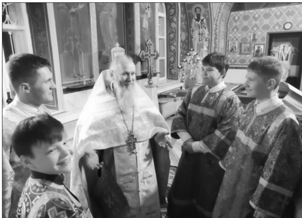
Фото 4 (вверху). Светлое Христово Воскресение. 2021 год