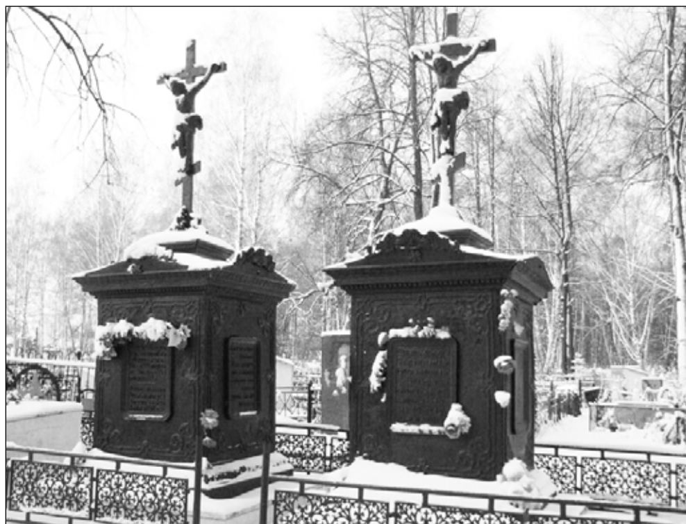
Фото 4 (вверху). Могилы декабристов