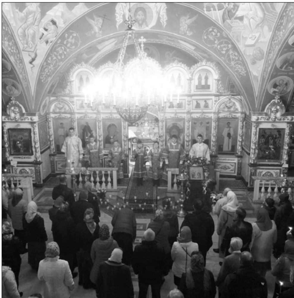
Фото 7 (слева сверху). После архиерейского богослужения в Никольском храме. В центре митрополит Рязанский и Михайловский Марк, слева от владыки протоиерей Геннадий Черкасов. Апрель, 2021 год

Фото 8 (слева внизу). Архиерейское богослужение в Никольском храме г. Рыбное в дни Великого поста. Апрель, 2021 год