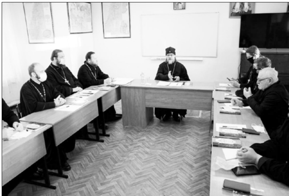
Члены Ученого совета обсуждают рабочие вопросы