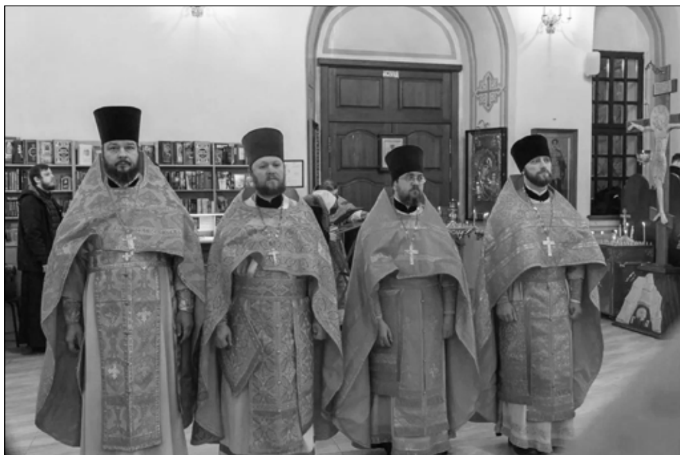
Фото 1 (слева вверху). Богослужение возглавил и.о. ректора РПДС митрополит Рязанский и Михайловский Марк

Фото 2 (слева внизу). Семинаристы были активными участниками богослужения