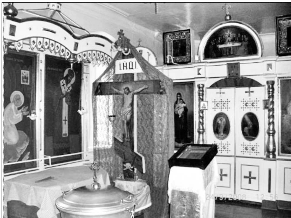
Фото 6 (слева). Икона св. Семи отроков Ефесских

Фото 7 (вверху). Придел преп. Серафима Саровского и свят. Иннокентия Иркутского