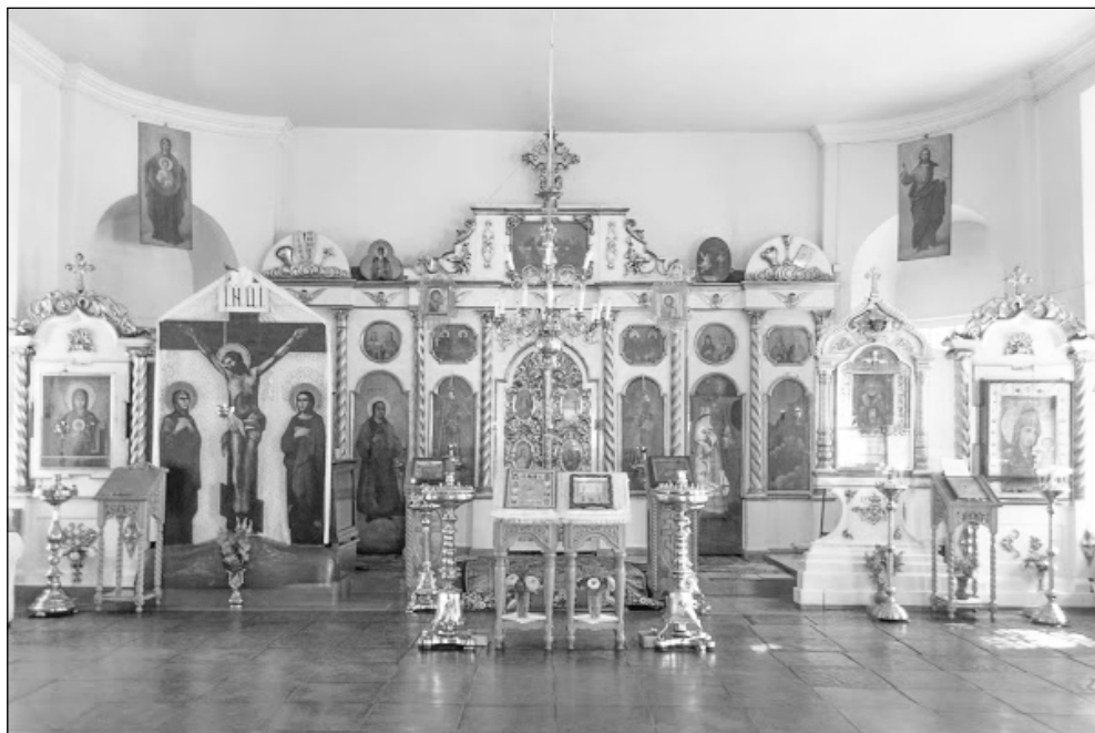
Фото 1 (вверху). Внутренний вид храма

Фото 2 (справа вверху). Храм св. Семи отроков Ефесских г. Тобольска. Нач. XX века.