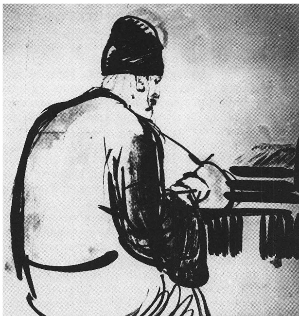
Старец Нектарий Оптинский (рис. Л. Бруни)