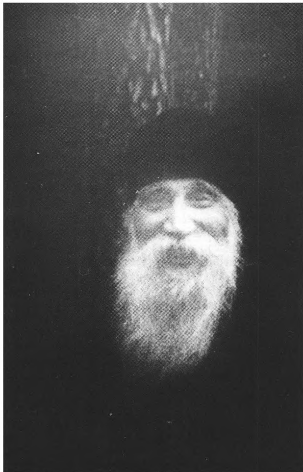
Архимандрит Таврион незадолго до кончины