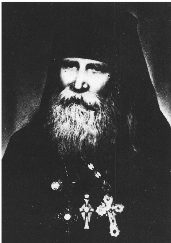
Архимандрит Таврион в зрелые годы