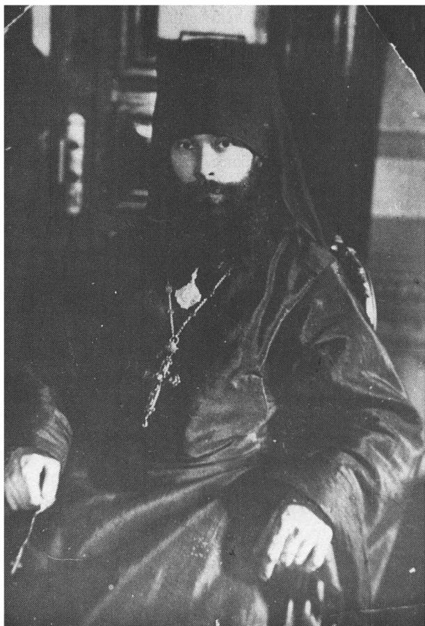
Епископ Серафим (Звездинский)