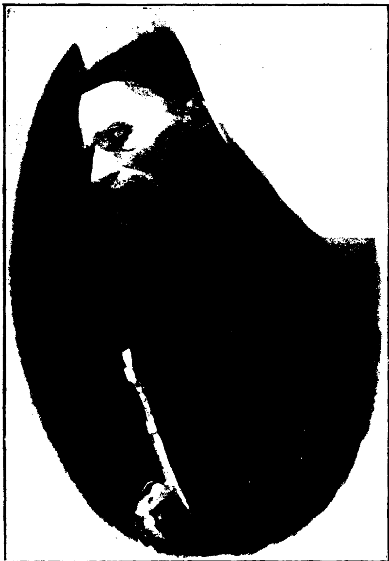
Александръ Матвѣевичъ Бухаревъ (Архимандритъ Феоdorf) въ гробу.