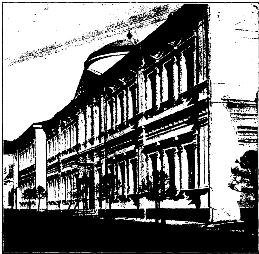
Зданіе Библіотеки Императорской Московской Духовной Академіи въ новомъ видѣ (слѣва—престройка 1914-го года).