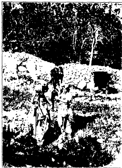
Арабки у источника.

редакціи, непохожей на первоначальную, по всему магометанскому селенію. Многія приходили сюда съ бѣльемъ, поло-ская которое въ наполненныхъ водою канавкахъ около источника, весело щебетали на своемъ гортанномъ нарѣчій. Мы удивлялись тому, какъ эти молодя мусульманки, зачерпнувши кувшинами воду, ставили послѣдніе на свои головы и, какъ бы не чувствуя особой тяжести на головѣ, беззаботно уходили, часто не поддерживая руками своихъ наполненныхъ водою сосудовъ, которые, не смотря на это, не теряли все-таки своего равновѣсія на граціозныхъ головкахъ мусульманокъ. Передъ нами живо встали библейскіе рассказы, гдѣ говорится о посѣщеніяхъ дѣвушками древнихъ колодцевъ. Нравы, обычаи, даже костюмы,—все напоминаетъ древнія времена.