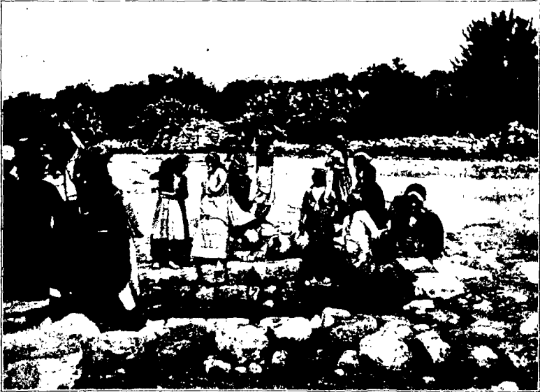
Арабки у источника.

плечъ, служа вмѣстѣ съ тѣмъ покрываломъ; маленькая круглая шапочка увѣнчиваетъ голову арабской женщины. Вотъ