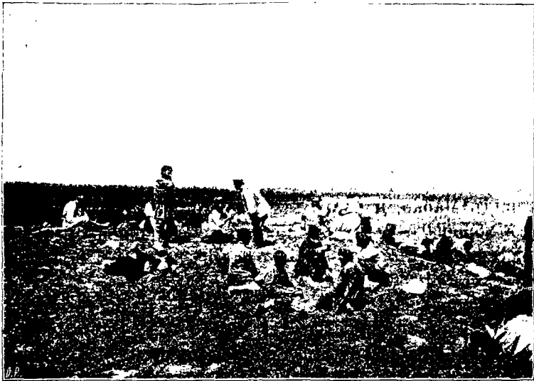
Паломники на пути въ Назаретъ.

отъ дороги, Марко указаль намъ мѣсто, гдѣ имѣють обык- новеніе отдыхать паломники, идущіе въ Назаретъ большими