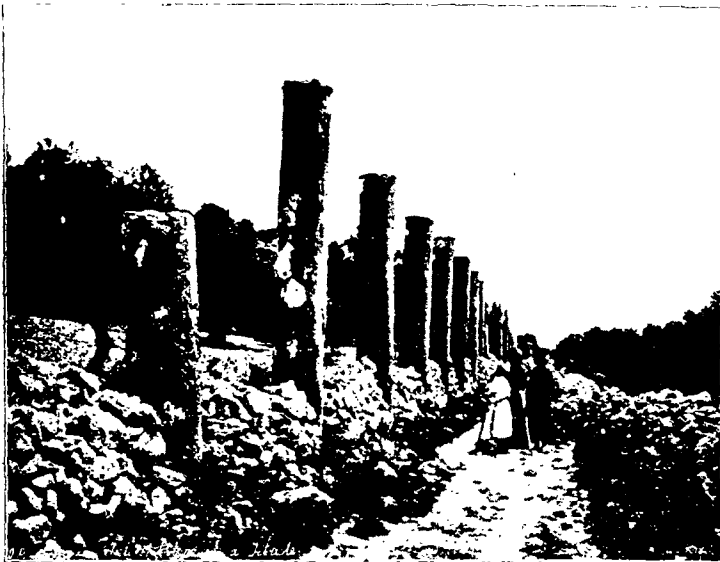
Севастія. Развалины дворца Ирода Великаго.

Поднявшись обратно по ступенькамъ вверхъ, мы съ облегченіемъ вдохнули въ себя струю свѣжаго, хотя и горя-