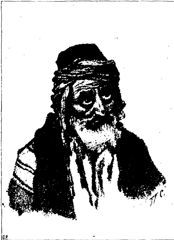
Еврей. Изъ Иерусалимскихъ типовъ.

легая стань, достигаетъ до пять. И все скопище народа говорить, шумить, спорить, оглашая воздухъ разноязыч-