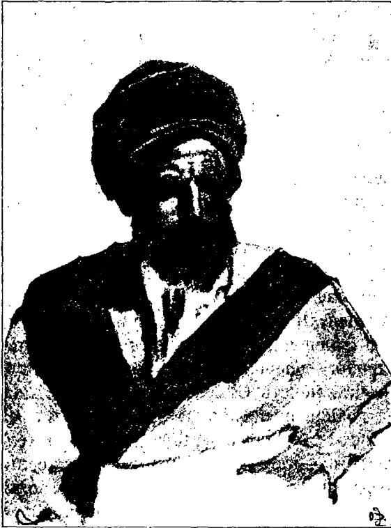
Феллахъ. Изъ Иерусалимскихъ типовъ.

всѣхъ убѣжденій и вѣрованій“. Лица всѣхъ національностей, и не національностей только, а всѣхъ расъ и цвѣтовъ встрѣчаются на каждомъ шагу на улицахъ Иерусалима. Азія