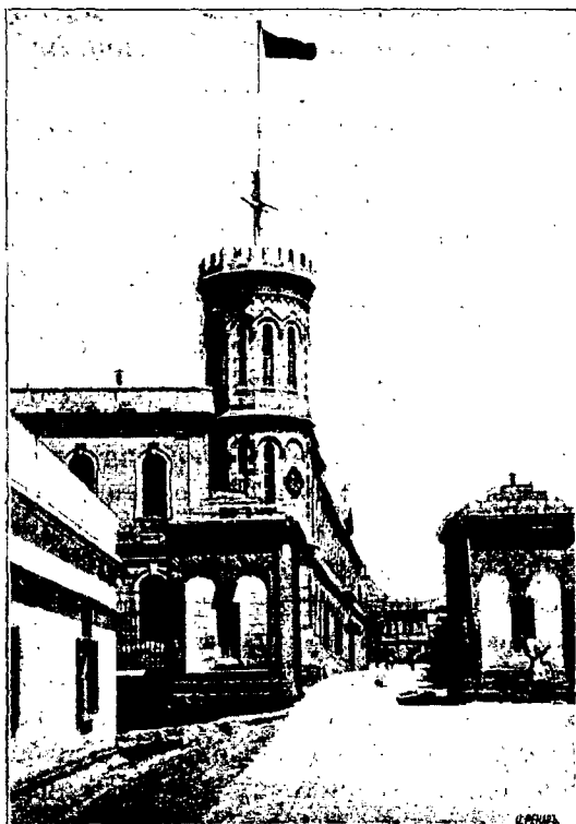
Новое Русское подворье Палестинскаго Общества.

ловѣкъ—для женщинъ. Внутри корпуса проповодятъ очень благопріятное впечатлѣніе. Они высоки, свѣтлы и образцово чисты. По сторонамъ стоятъ желѣзныя кровати, около