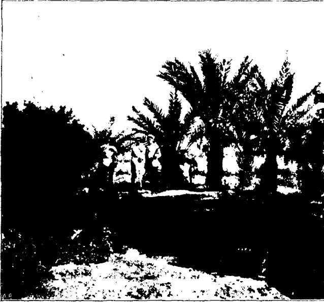
Въ Іерихонѣ—подъ пальмами.

встрѣчу намъ поднялся холодный пронзительный вѣтеръ. Но мѣръ того, какъ мы приближались къ Іерусалиму, темпе-