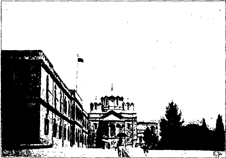
Зданіе миссіи и Троицкій Соборъ при ней.

Святой Землѣ“, издаваемыхъ Обществомъ. (До сихъ поръ вышло болѣе 60 чтеній). Эти чтенія и предлагаются ежедневно, кромѣ кануновъ праздниковъ, вниманію паломниковъ въ столовой Общества при Новомъ подворьи. Эти духовно-назидательныя чтенія обыкновенно продолжаются часа два, предваряясь и заканчиваясь общимъ пѣніемъ тропарей и молитвъ. Первый часъ обычно посвящается священной исторіи, исторіи Церкви, житіямъ Святыхъ, а второй—священной географіи, подробному описанію Святой Земли, Синаи, Аѳона. Чтенія иллюстрируются туманными картинами. Благодаря этому, паломники въ Иерусалимѣ и его окрестностяхъ теперь не бродятъ уже въ потьмахъ, какъ раньше, и кромѣ того съ пользою употребляютъ то время, которое прежде шло на сплетни, пересуды и другія непристойныя дѣла. Кромѣ того, во время этихъ чтеній паломники и особенно паломницы такъ спѣваются, что потомъ составляютъ въ