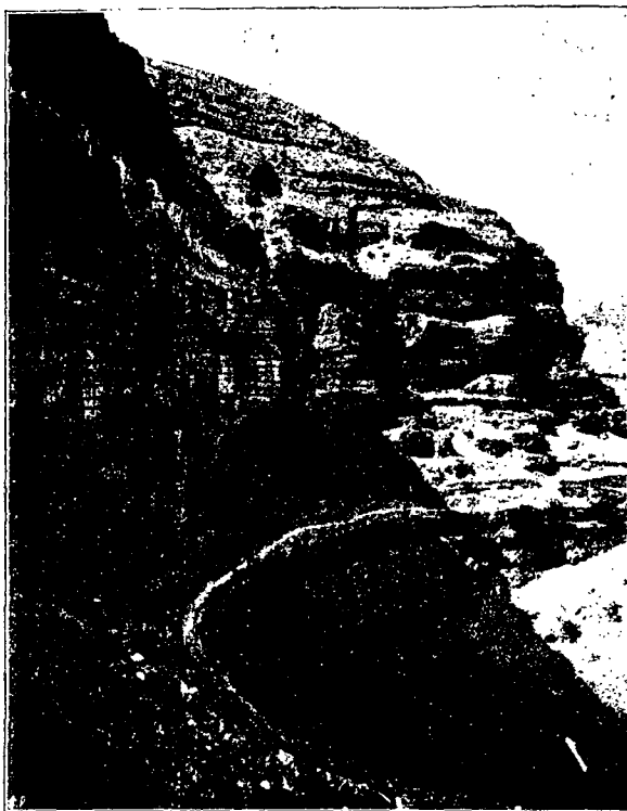
Скалы у монастыря Хозевита.

Дорога идетъ по такой же пустынь, какъ и прежде. По прежнему кругомъ камни и скалистые горы, перерѣзываемыя глубокими ущельями и долинами, среди которыхъ лавируетъ дорога, то спускаясь на дно ущелій, то взбѣгая на откосы горъ. Синева Мертваго моря и темная даль возвышающихся за нимъ горъ мелькаютъ чаще. Самая природа