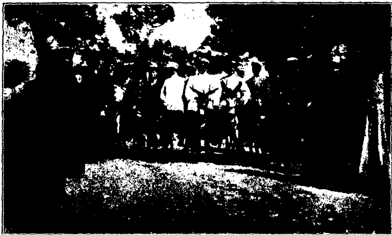
Кавалькада на ослахъ.