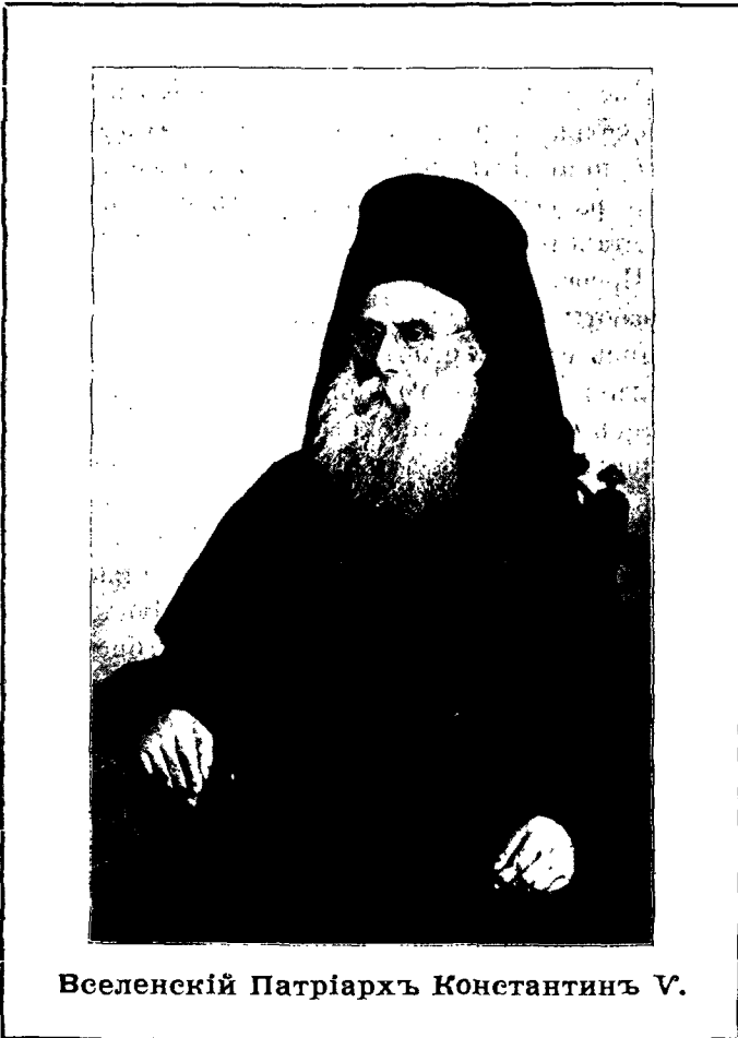
Вселенскій Патріархъ Константинъ V.

Наконецъ мы остановились въ Фанарѣ, около монастыря св. Георгія, въ которомъ живетъ Вселенскій патріархъ