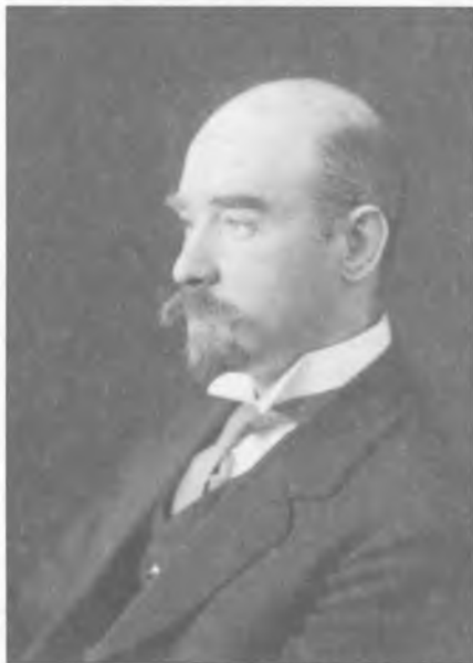
П.Г.Чесноков. 1913 год

2. Каждая партия, составляющая хор, должна чутко вслушиваться во все остальные партии хора, дабы: а) силой своего звука не выделяться из партий всего хора и б) правильно (в смысле высоты) строить свой звук по отношению к звукам остальных партий.