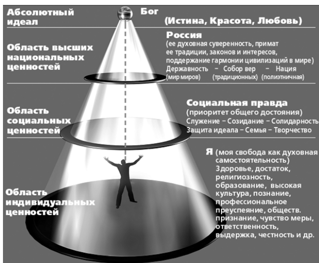
Рис. 3. Типовая схема ценностных приоритетов

Следовательно, страдающему человеческому «Я» необходимо сегодня восстановить сферу идеалов (как религиозных, так и нравственных), сферу высших социальных ценностей, научиться ставить личную «сверхзадачу», решение которой свяжет его персональные цели с общими. В уже цитируемом документе (9, с. 23) приводится схема, которая иллюстрирует возможность построения такой системы ценностей, помогающая человеку крепко и твердо стоять на ногах в нашей быстро меняющемся мире, возможность возвращения человека к службе не самому себе, а другим.