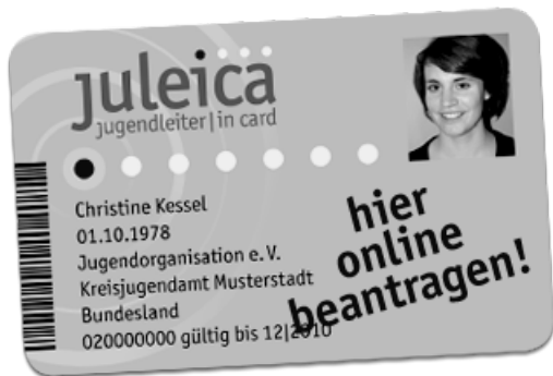
Рис. 1. Карточка молодежного лидера в ФРГ (JuLeiCa)

В настоящее время для реализации идей участия и мобильности в европейских странах используют различные технологии . Наиболее распространенными являются различные программы неформального образования. В Германии программы тренингов для молодых активистов сопровождаются поддержкой их мобильности, вручением особой «карточки молодежного лидера (руководителя)» (JuLeiCa — Jugend Leiter/in Card), дающей определенные скидки в учреждениях культуры и спорта, на транспорте, в магазинах молодежного ассортимента. Получение карты связано с прохождением определенного модульного курса повышения квалификации, включающего основы законодательства, социальной педагогики, тренинги по лидерству и эффективной коммуникации, семинары по толерантности и гендерной проблематике, а также курсы оказания первой помощи. Общий вид карточки в новом дизайне представлен на рис. 1.